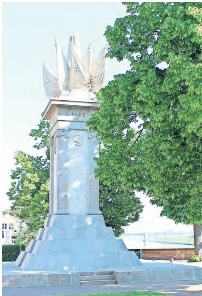
Bereits am 25. April beginnt um 10.30 Uhr am Denkmal der Begegnung die Kranzniederlegung zum 79. Jahrestag der historischen Begegnung an der Elbe.

79. JAHRESTAG der historischen Begegnung an der Elbe – Ein Fest mit Kultur- und Unterhaltungsprogramm