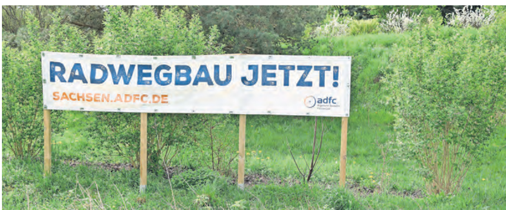
Der Ruf nach mehr Radwegen in und um Torgau wird lauter.