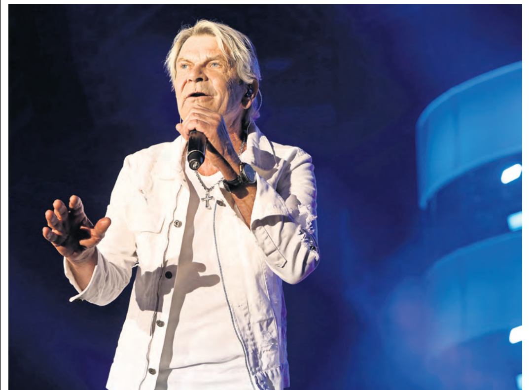
Am 9. August ist Schlagersänger Matthias Reim zum dritten Mal in Wernsdorf live zu Gast.

Jetzt schon Karten fürs Konzert AM 9. AUGUST sichern!