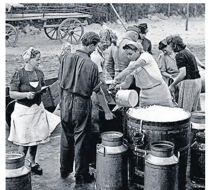
Dem Thema Genuss und Geschichte widmet sich eine Führung durch das Museum Torgau am 26. April.

lungsorten zu Nutzgärten umgestaltet. Die Blumenbeete verschwanden, der Rasen wurde abgetragen. Stattdessen wurden Möhren angepflanzt, Salat, Kartoffeln, Kohl, Zuckerrüben, Ziersträucher wurden ersetzt durch Stachel-, Johannes- und Himbeersträucher. Wer konnte, baute sich einen Hühner- oder Kaninchenstall. Erlebbar wird an diesem Abend eine ganz eigene Küchenkultur. Seien Sie gespannt auf geschichtliche Ereignisse, Dokumente rund um die Ernährung dieser Zeit, auf Rezepte und natürlich auf Verkostungen, denn einige Rezepte hat die Autorin des Vortrags ausprobiert und für die Gäste des Abends zur Verkostung vorbereitet. SWB