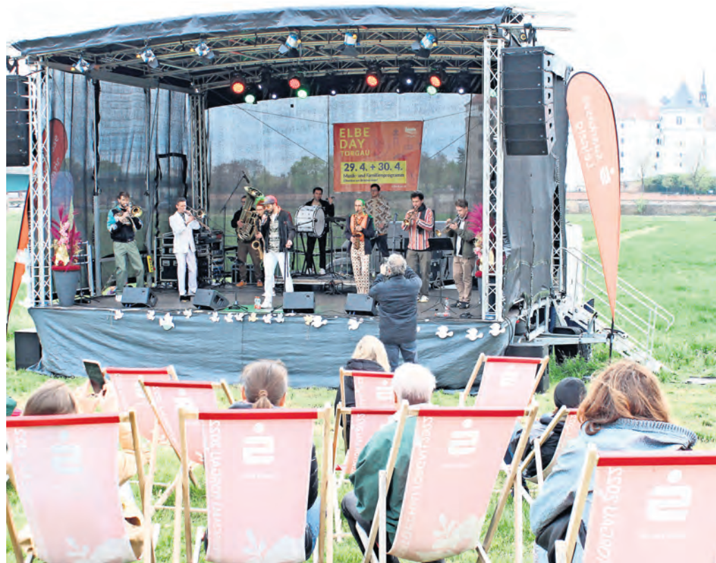
In diesem Jahr steht die Bühne wieder an der anderen Elbseite am Schiffsanleger am Pestalozziweg: Das zweitägige Programm kann sich sehen lassen.