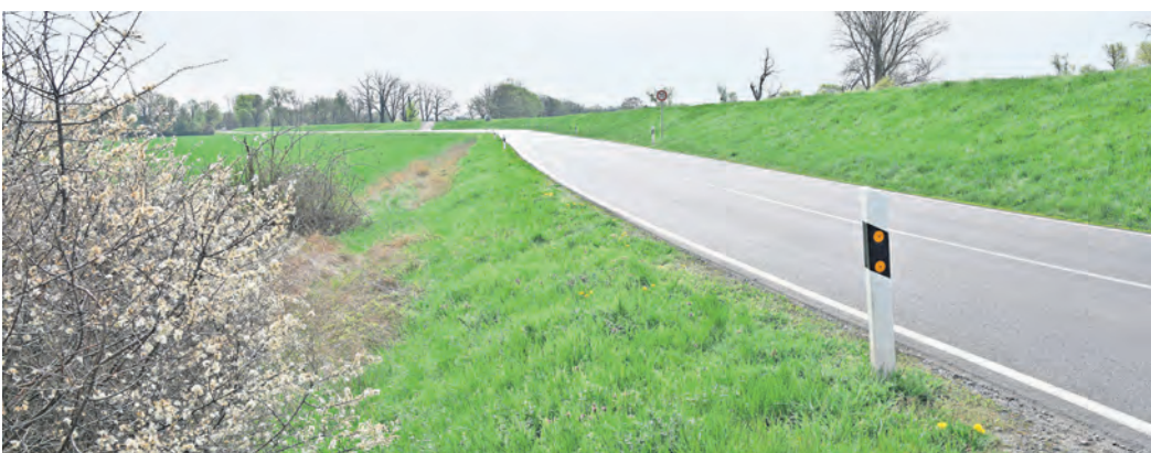
Speziell zwischen Werdau und Graditz wäre ein Radweg an der B 183 ein echter Gewinn - für beide Seiten, für Auto- und Radfahrer.

RAD AG TORGAU lädt alle Interessenten am 25. April ein