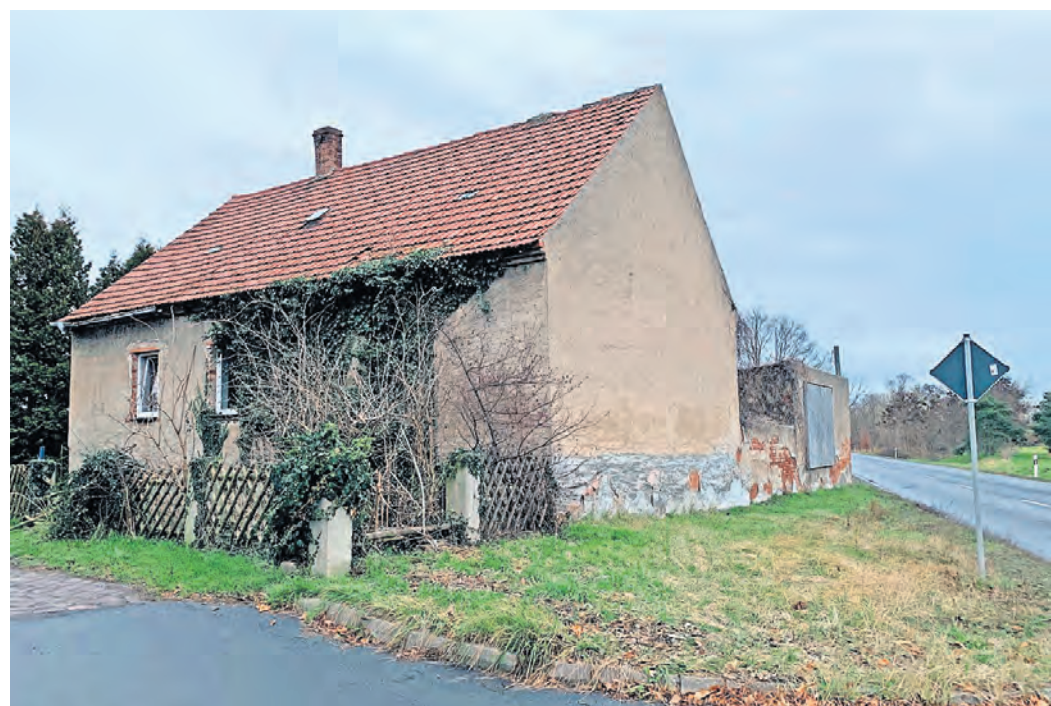
Erstaunlich, was aus einem alten Haus in Werdau wurde. Überzeugen Sie sich vom Vorher-Nachher-Effekt am Sonntag, 21. April, ab 13.30 Uhr.

K & K Baugesellschaft mbH info@kieslich-baugesellschaft.de