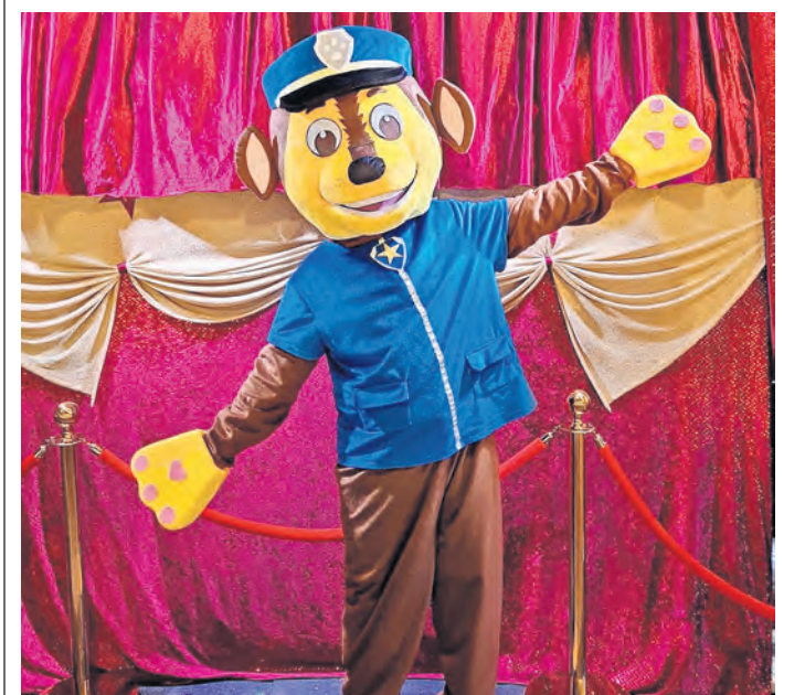
Vorhang auf für die Paw Patrol im Torgauer Kulturhaus.

Kindern werden durch das Puppentheater POSITIVE ASPEKTE vermittelt