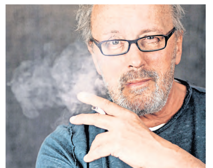
Hans Werner Olm liefert seit 30 Jahren Comedy-Power.

TORGAU. Am Samstag, 27. April, tritt ab 20 Uhr HANS WERNER OLM mit seinem Programm „EIN IRRER IST MENSCHLICH! - Die Legende lebt!“ in der Torgauer Kulturbastion auf. „Ich trinke meinen Kaffee immer schwarz - und ohne Wasser“, ist ein O-ton von Olm. Olm ist pur, rough, unverwundlich, direkt und verspielt. Er besitzt den fixierenden stahlharten Blick in einem Samtäuglein, einen durchtrainierten Körper und er kennt keine Angst. Zumindest nicht die Art von Angst, die der großflächig, verunsicherten, sogenannten breiten Masse Tagtäglich eingepfropft wird. Der zweimalige Comedy Preis Gewinner und Kopf seiner ehemaligen TVShow „Olm“ blüfft nicht, sondern kommt ohne Umwege auf den Punkt, ungefiltert und mit der Schärfe einer japanischen Blattsäge. In einer Zeit zunehmender Orientierungslosigkeit wird die Frage nach dem Sinn des Lebens immer lauter. Wenn es beim Roulette heißt „Nichts geht mehr“ heißt es im richtigen Leben - „Alles geht!“. Nur, wer kennt sich noch aus im Gestrüpp tausender Konflikte? Wer weiß schon heute was er morgen fühlt? Alle reden vom Weltuntergang aber das bringt und doch auch nicht weiter. Und so bearbeitet OLM in einem 2-stündigen Schnelldurchlauf all