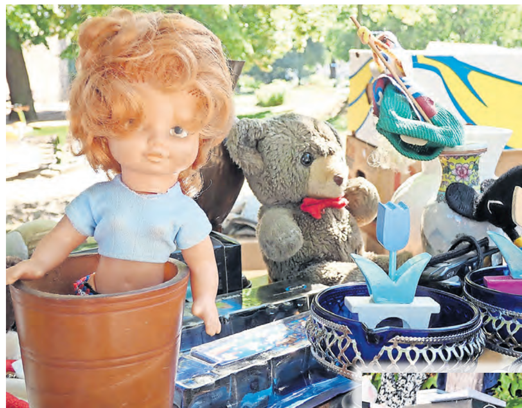
Jede Menge Trödel gibt es am 11. Mai rund ums Stadt- und Waagenmuseum zu entdecken.

Am 11. Mai kommen SCHNÄPPCHENJÄGER UND SAMMLER auf ihre Kosten