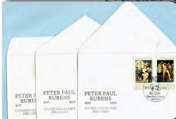
Ganzsachen wie diese anlässlich der Dresdner Rubens-Jubiläumsausstellung 1977 sind begehrte Sammelobjekte.