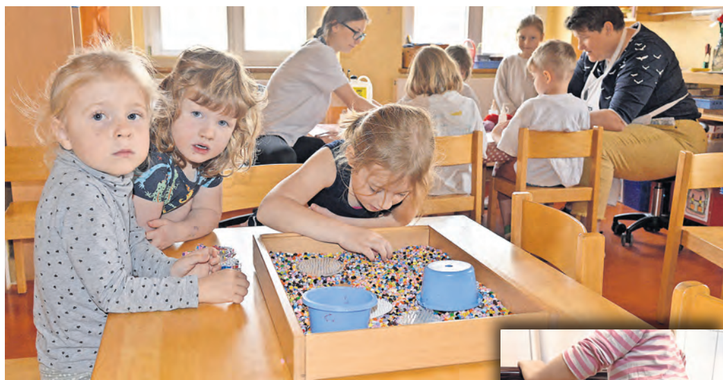
Die Kinder der kirchlichen Kindertagesstätte beim Spielen.

Um dies zu werden, müssen bestimmte Kriterien erfüllt werden, die auch jährlich einer Prüfung unterliegen. So wird nach den fünf Säulen von Kneipp gearbeitet. Zudem hat der überwiegende Teil der pädagogischen