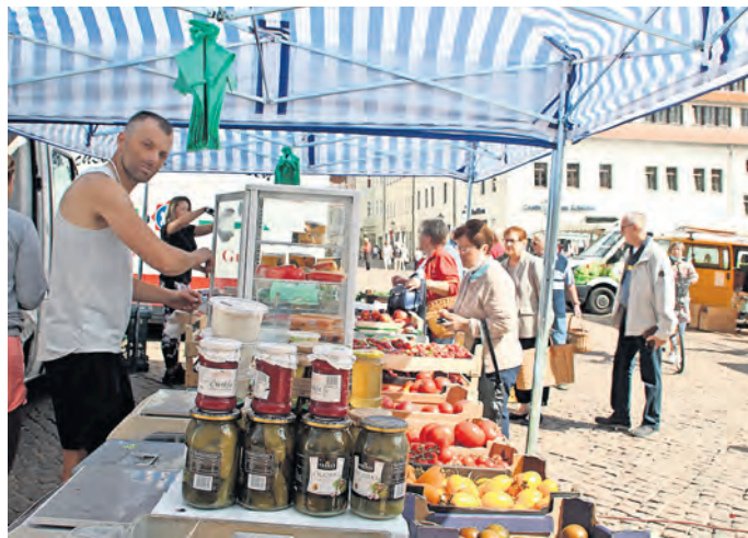
Der Oschatzer Wochenmarkt mit seinen zahlreichen Ständen bereichert das Stadtleben.

Der Wochenmarkt bietet vorrangig Lebensmittel wie Fleisch- und Wurstwaren, Fisch, Back-