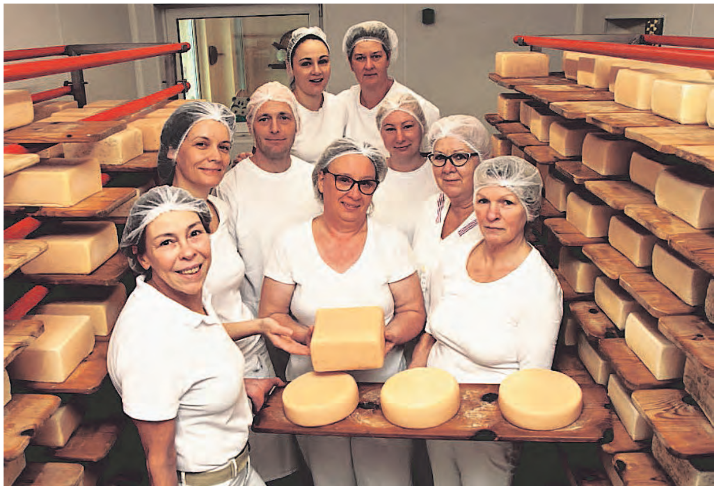
Die Gesichter der Hofmolkerei Bennewitz: Kern der Produktion sind Käsesorten in verschiedenen Geschmacksrichtungen. Neben dem handwerklichen Können ist auch immer eine große Portion Liebe mit dabei.

Das 25-jährige Jubiläum soll am Samstag, 25. Mai, von 10 bis 15 Uhr am Hofläden in Ben-