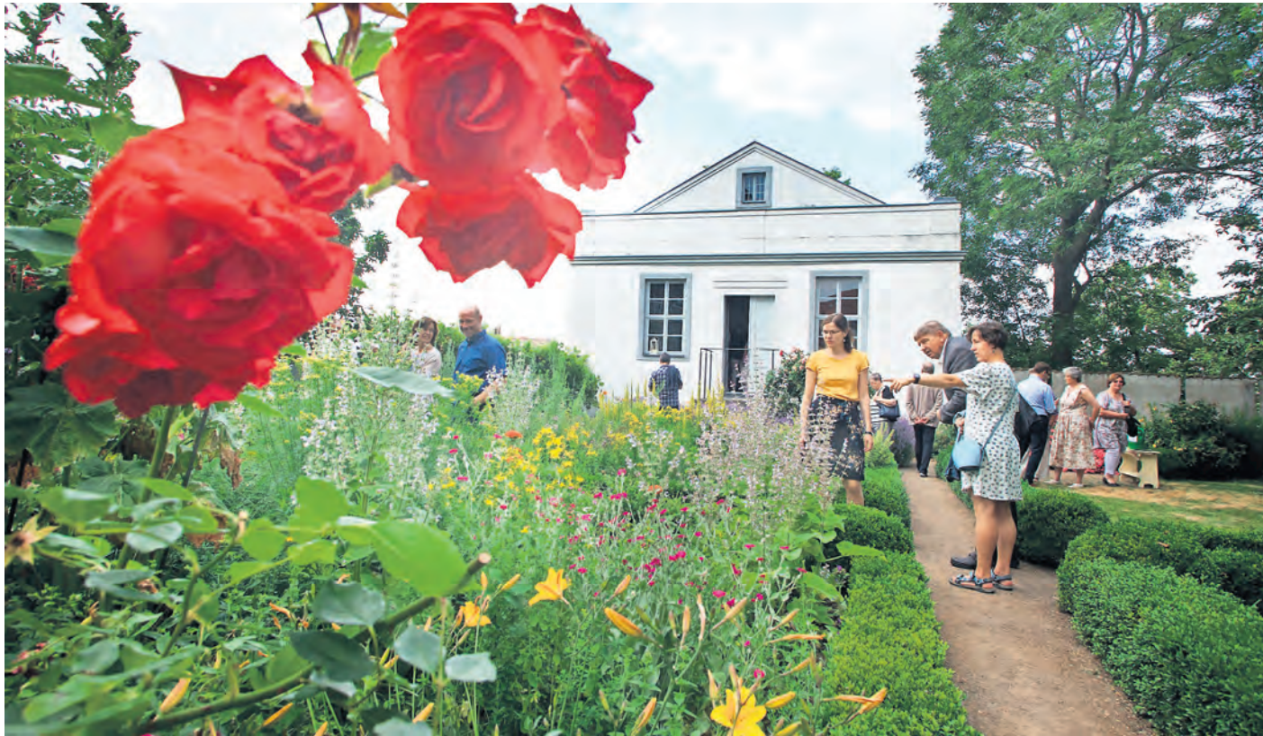
Zu einer lauschigen „Garten-Nacht“ wird am Freitag, 7. Juni, um 19 Uhr im Hof des Stadtmuseums Torgau geladen.

GARTENLUST UND SOMMERNACHT im Hof des Museums Torgau