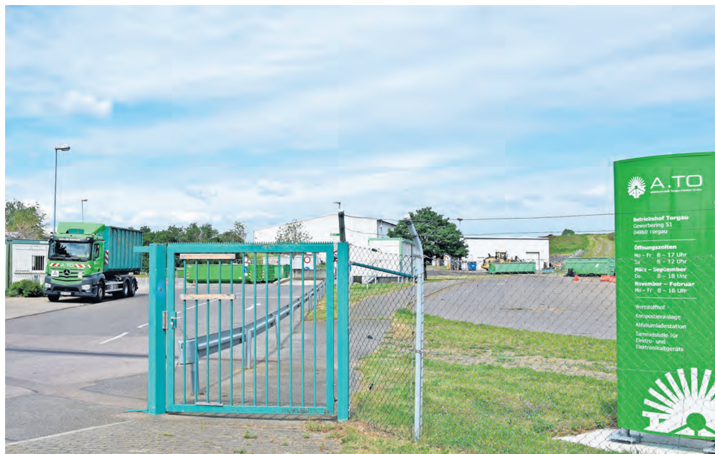
Um längere Wartezeiten bei der Anlieferung von Sperrmüll auf dem A.TO-Wertstoffhof in Torgau zu vermeiden, besteht die Möglichkeit, Abfälle kostenlos von Zuhause abholen zu lassen.

Abfallwirtschaft Torgau-Oschatz GmbH im Gewerbegebiet 51 in Torgau Kontaktdaten: Wertstoffhof Torgau: 03421 77300-23 oder 24, Wertstoffhof Rechau/Zöschau: 03435 921359