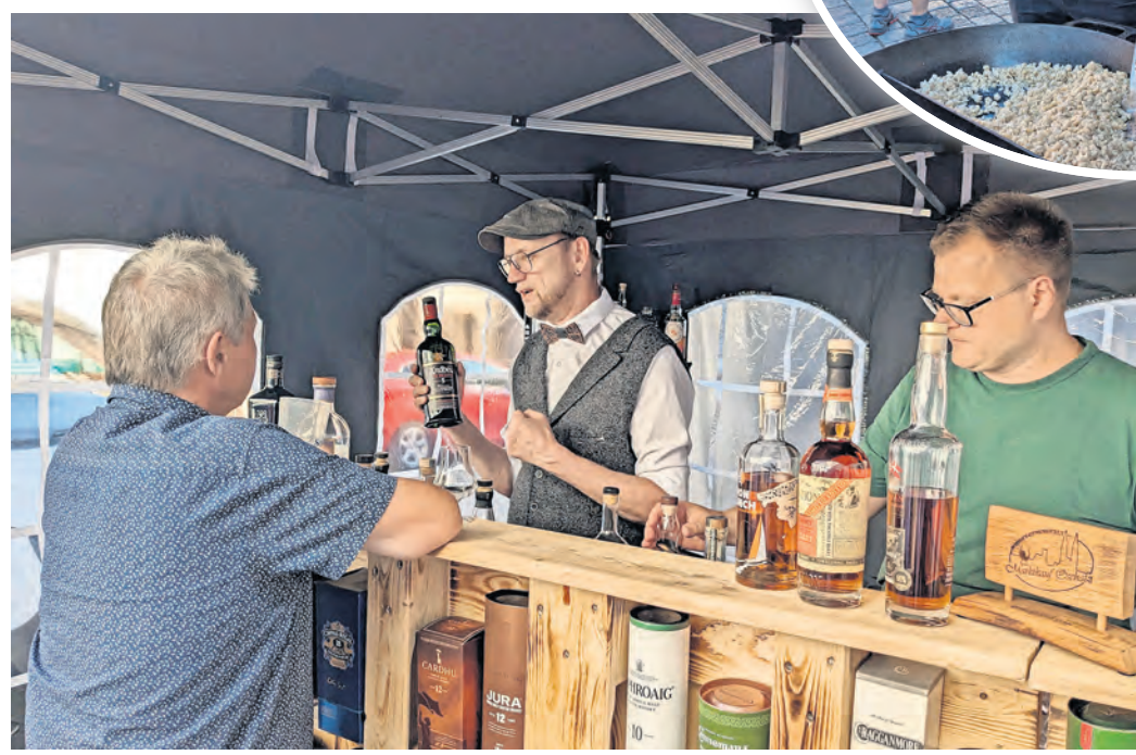
Eine anspruchsvolle Kulinarik ist ein Markenzeichen des Torgauer Abendmarktes. Am 7. Juni können Rum-Spezialitäten verkostet werden.