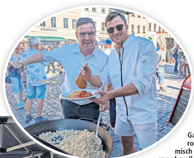
Gastronomisch anspruchsvoll, ob Speis oder Trank, darauf wird beim Abendmarkt in Torgau Wert gelegt.

der Torgauer Abendmärkte macht am 7. Juni das vielversprechende Motto: „Süffiges und Köstliches dRUMherum“, wobei es neben der Verkostung von Rum-Spezialitäten ausschließlich um leckere Speisen von der Waffelzauberei aus Taucha oder Langos aus Dresden geht. Nach dem Erfolg im Vorjahr mit der Verkostung von Whisky- und Weinspezialitäten werden die Experten vom Marktkauf Oschatz diesmal