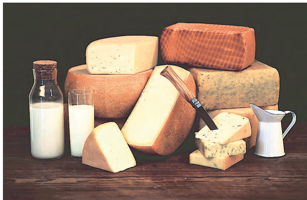
Leckeres aus dem Rohstoff Milch entsteht mit Wissen und Können in der Hofmolkerei Bennewitz.

newitz gebührend gefeiert werden. Dabei sind viele regionale Partner involviert. Beispielsweise sorgen die Kameraden der Freiwilligen Feuerwehr Bennewitz für Grilltes und kühle Getränke. Neben Kaffee und Kuchen, wird es Honig und Quark mit Erdbeeren geben. An zwei Verkaufsstellen können die Pro-