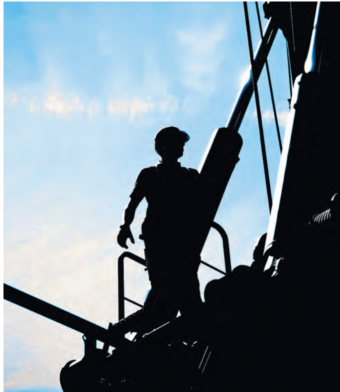
Das Arbeiten unter freiem Himmel ist gerade im Sommer eine unterschätzte Gefahr.