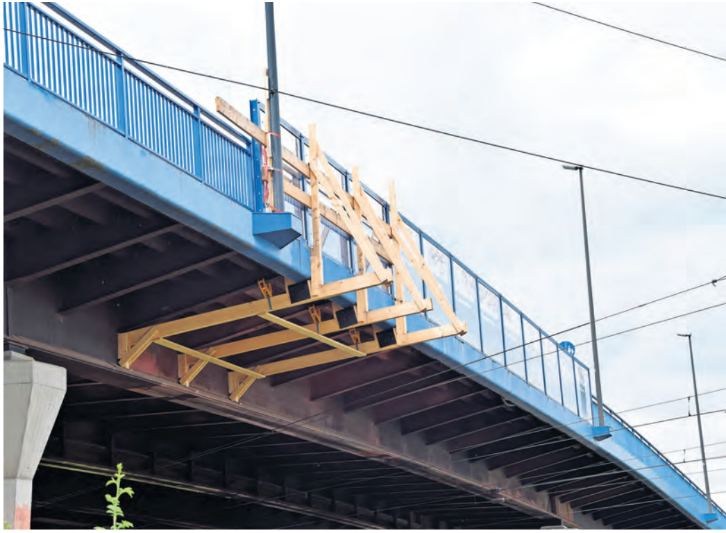
In der vergangenen Woche liefen die Bauarbeiten am Brückengeländer auf der Überführung Warschauer Straße in Torgau planmäßig, sodass die Einschränkungen bald der Geschichte angehören.

Bauarbeiten auf der ÜBERFÜHRUNG WARSCHAUER STRABE schreiten voran