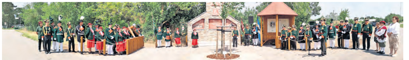
Der Schützenverein Schildau bittet: Auf zum Schützenfest vom 14. bis 16. Juni in Schildau!

WÜRDIGUNG DES GROßEN SOHNS der Stadt Schildau