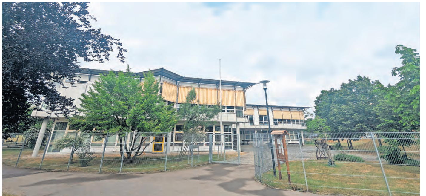
Die Grundschule am Rodelberg feiert am 13. Juni das 30-jährige Bestehen.

Aktuell lernen im Schnitt jährlich rund 230 Kinder von der ersten bis zur vierten Klasse in der Grundschule am Rodelberg. Unterrichtet und