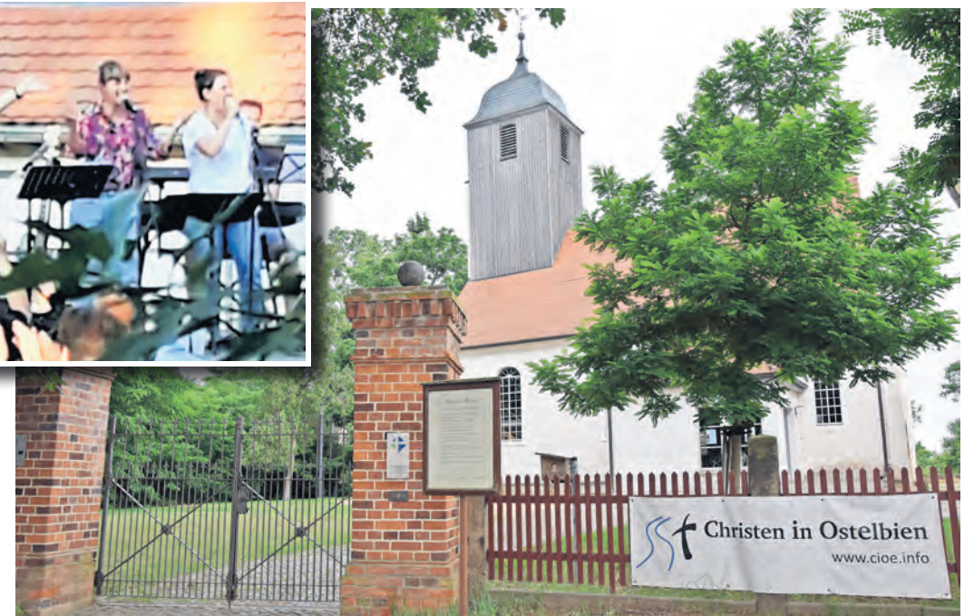
Das Regionale Gemeindezentrum Heilandskirche befindet sich in der Ernst-Thälmann-Straße in Beilrode.

BEILRODE. Der Heimatverein Beilrode und die Evangelische Kirchengemeinde laden zu einem Sommerfest am Samstag, 22. Juni, ab 14 Uhr an das Regionale Gemeindezentrum Heilandskirche Beilrode. Los geht es mit einer Andacht, dem sich die Kaffeetafel anschließt. Ab 17.30 Uhr spielt zur Grillparty die Band „underwater fish“ aus Finsterwalde Pop- und Soulballaden an einem hoffentlich lauen Sommerabend. Neben