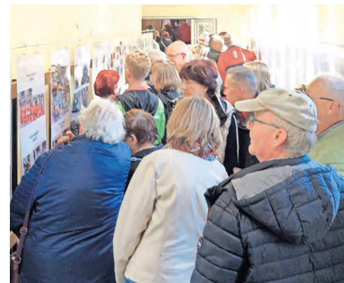
Eine Foto-Ausstellung zu „50 Jahre Grundschule Weidenhain“ wird anlässlich des Feuerwehrfestes gezeigt.

WEIDENHAIN. Am Wochenende, 29. und 30. Juni, wird in Weidenhain das Feuerwehrfest ausgetragen. Los geht es am Samstag, 14 Uhr, mit dem 32. Pokallauf zur Bärensäule, ab 19 Uhr lockt eine Disco mit DJ Tropi und einer kleinen Überraschung. Am Sonntag steht von 11 bis 14 Uhr der Frühschoppen mit den Hohenburger Musikanten im Mittelpunkt, ab 12 Uhr gibt es Erbsen aus der Feldküche, ab 14 Uhr Kaffee und Kuchen. An beiden Tagen lockt eine liebevoll gestaltete Fotoausstellung „50 Jahre Grundschule Weidenhain“ in der Turnhalle mit ganz viel Erinnerungspotenzial, eine Hüpfburg und die Kegelbahn. Die Foto-Ausstellung kann am Samstag von 14 bis 18 Uhr sowie am Sonntag von 11 bis 15 Uhr besichtigt werden. SWB