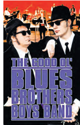
Wer kennt ihn nicht den Kultfilm über die atemberaubende Musik der Blues-Brothers?

SOMMER-OPEN-AIRS an der Torgauer Kulturbastion