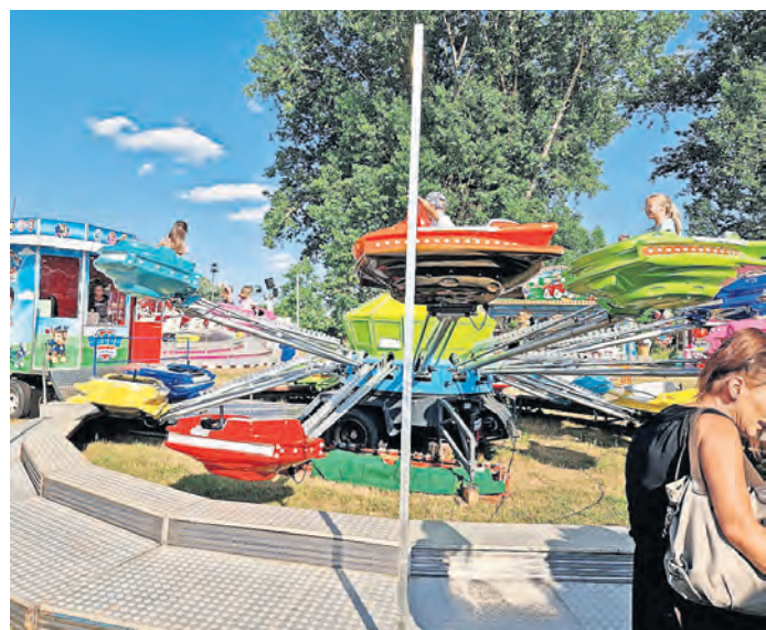
Auf der Festwiese am Auweg hat Schausteller Schmidt seine Fahrgeschäfte aufgebaut.

zum Gänsebrunnensfest schminken lassen. Die mobile Märchenbühne aus Döbrichau wird bis 15 Uhr alle Gäste mit ihren Workshops zum Thema „Mittelmärchen und kleine Kräuterkunde“ in ihren Banen ziehen. Im Festzelt ist mit den Auftritten der Rock'n'Roll-Gruppe „Dancing Shoes“, der Rad Artistik-Gruppe „Cornellus“ und dem Wettbewerb um die Gänsemagd und den Hüte-