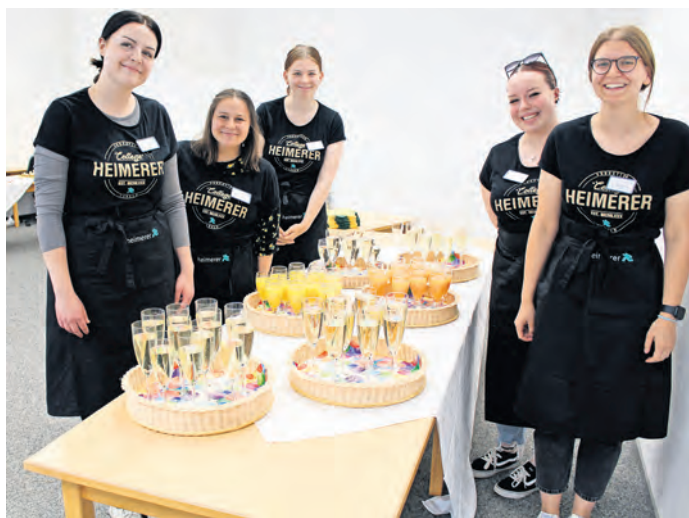
Schülerinnen der Ergo-Klasse 44 bereiteten alles für den Sektempfang vor.