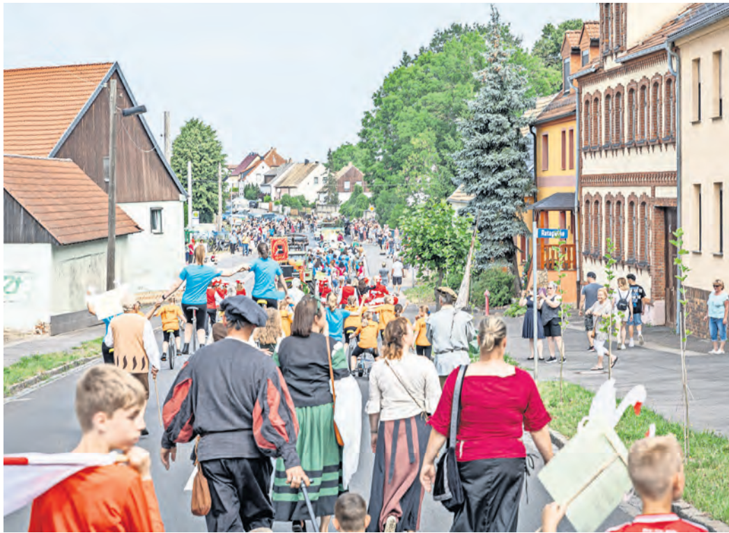
Herzstück des Gänsebrunnensfestes in Dommitzsch ist der traditionelle Weckumzug am Sonntagmorgen, 10 Uhr.

39. GÄNSEBRUNNENFEST lockt vom 28. bis 30. Juni nach Dommitzsch