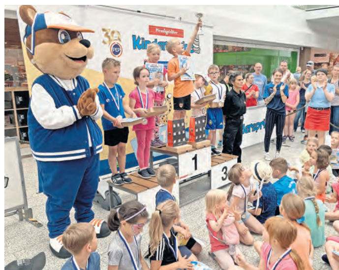
So sehen Sieger aus!