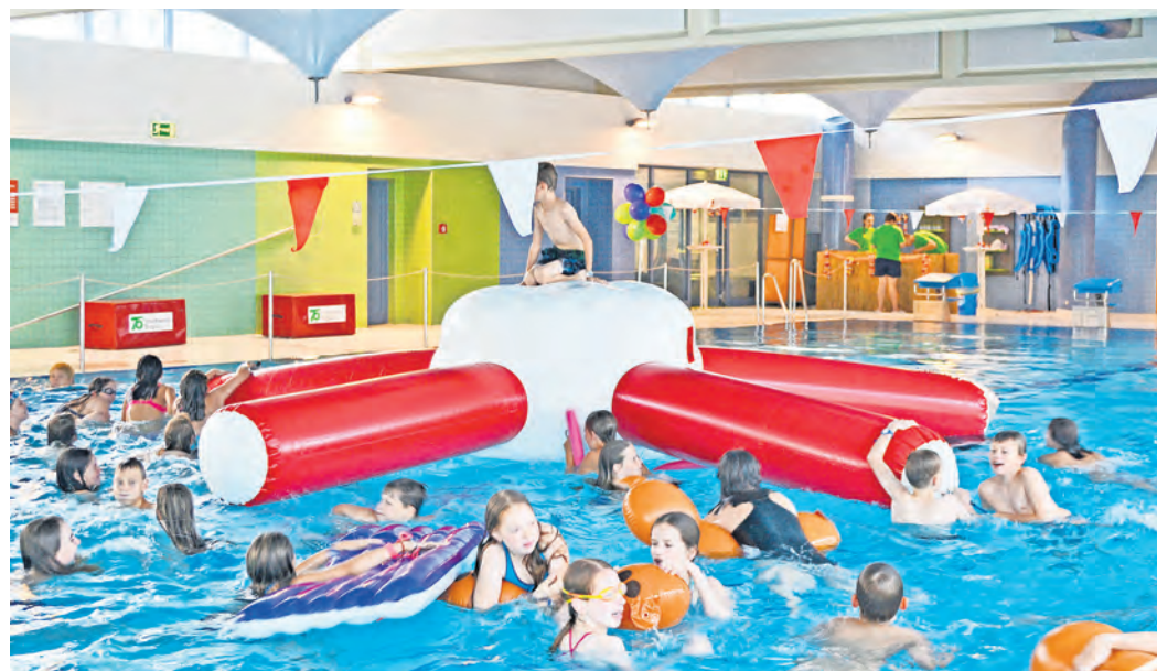
Wenn der Seestern zu Wasser gelassen ist, kommt Freude bei Klein und Groß auf.

Montag, 24. Juni, 10 - 11.30 Uhr: Springe durch die Stadtgeschichte – eine kleine Führung mit großem Spaß im Museum Torgau, Wintergrüne 5, Telefon 03421 70336, 10 - 12 Uhr Schatzsuche in der Bastion 7 in der Kleinen Feldstraße 7, Anmeldung per Telefon 03421 7762230 Dienstag, 25. Juni, 14.30 – 16 Uhr: FAIRYTALES. Geschichten aus dem Märchenschloss im Schloss Hartenfels, Anmeldung per Telefon 03421 758 1099, 13 – 15 Uhr Töpfern in der Bastion 7 in der Kleinen Feldstraße 7, Anmeldung per Telefon 03421 7762230 Mittwoch, 26. Juni, 10 – 12 Uhr und 13 - 15 Uhr: Keramik-Doppelkurs, Teil 1 Modellieren in der Kleinen Galerie Torgau in der