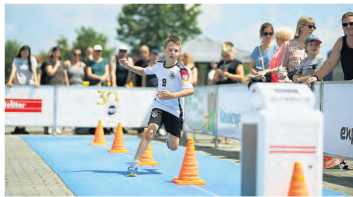
Geschicklichkeit und Schnelligkeit waren gefragt.

TORGAU. Vor wenigen Tagen war der PEP Torgau zum zweiten Mal Veranstalter des Kindersprint-Finales. Im Vorfeld des Sport-Events fanden neun Projektstage an sechs Grundschulen an der Promenade, Torgau-Nordwest, Am Rodelberg, Schildau, Arzberg und Beilrode. Beim großen Finale im PEP konnten 186 Kinder und über 500 Zuschauer begrüßt werden. Selbst der „Wettergott“ hatte ein Einsehen, dazu kam eine super Stimmung. Beim Kindersprint-Finale werden die schnellsten und geschicktesten Grundschüler gesucht. Die Teilnahme hat sich schließlich für alle Kinder gelohnt, denn es gab für alle Medaillen, die besten Mädchen und Jungen der Klassenstufen 1 bis 4 erhielten einen Pokal. Für die Plätze 1 bis 3 gab es Gutscheine und Spiele. Für das leibliche Wohl sorgte die Fleischerei Bachmann mit Leckerem vom Grill, zum Abkühlen gab es Softeis vom Eiscafé Piccolo. Die Grundschule An der Promenade hat den Titel „Sportlichste Grundschule“ im Kindersprint verteidigt, zum zweiten Mal hat die Schule die Sportmaterialkiste gewonnen. SWB