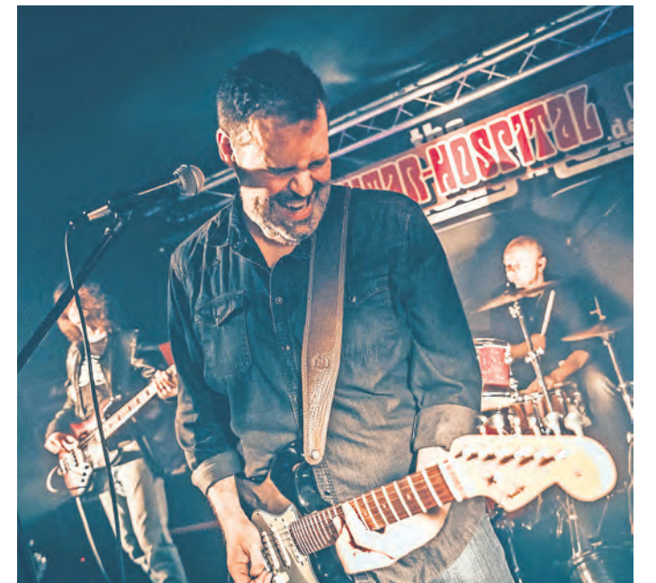
Bands of Friends zelebrieren das Gesamtwerk von Rock-Ikone Rory Gallagher.

Tickets in der Kulturbastion, bei reservix und eventim sowie an der Abendkasse