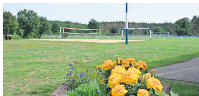
In Blumberg versteht man es zu feiern. Die Mischung aus Sport, Kultur und Unterhaltung sowie Genuss kommt gut an – auch bei Auswärtigen.

SÜPTITZ. Der Heimat- & Kulturverein „Süptitzer Höhen“ lädt am Samstag, 6. Juli, ab 16 Uhr zum Sommerfest an das Vereinsheim im Mühlenweg 25 in Süptitz ein. Neben Gegrilltem und kühlen Getränken spielen die Röcknitzer Blasmusikanten auf. Der Eintritt ist frei. SWB