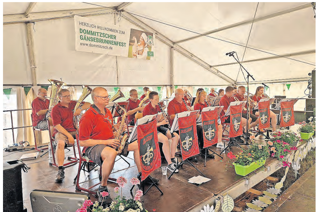
Das Gänsebrunnenfest zeigt sich von seiner vielfältigen Seite – mit Musik, Genuss und Unterhaltung.