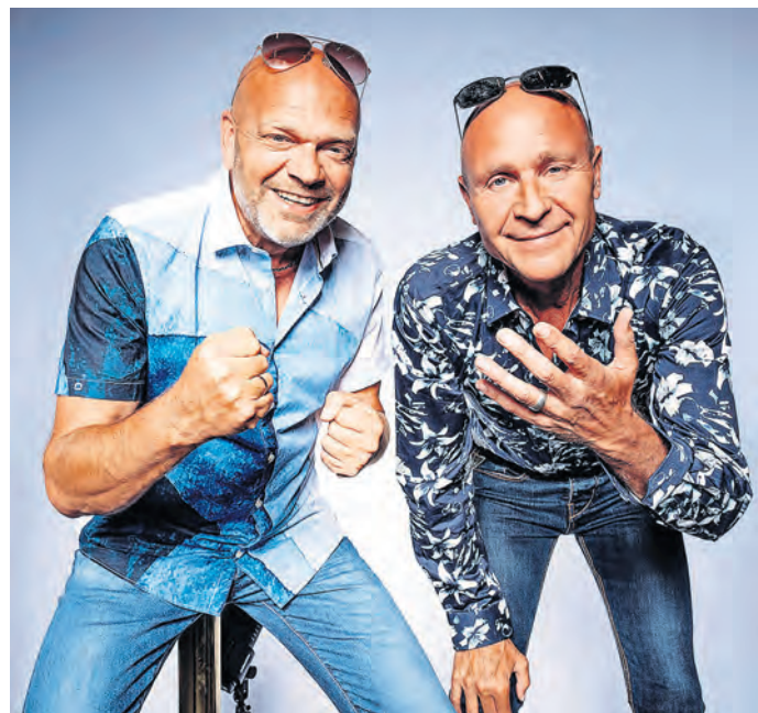
Die Feisten kommen mit ihrem neuen Programm, Familienfest, nach Torgau an die Kulturbastion.

TORGAU. Am Samstag, 6. Juli, gastieren ab 20 Uhr DIE FEISTEN mit ihrem neuem Programm „FAMILIENFEST“ an der Torgauer Kulturbastion. Wenn die Feisten das tun, was sie am liebsten tun, purzeln jede Menge neue Lieder aus ihrer Songschreibmaschine: eins für die zwangverschifften, unfreiwilligen Konzertgäste, die eigentlich lieber beim Fußball oder einem Heavy Metal Gig wären. Ein Weiteres über unser aller Mindesthaltbarkeitsdatum: „Mein Körper und ich“ zeigt, wie man über den eigenen Verfall lachen kann. Das wird lustig. Die ganzen neuen Geschichten in guter Gesellschaft der feisten Hits. Seid dabei! Wir kommen garantiert. SWB