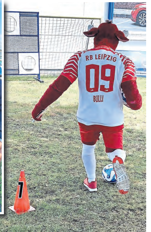
Bulli, das Maskottchen von RB Leipzig, zeigte an der Torwand sein Können, schrieb fleißig Autogramme und war der „heimliche“ Star im Auto-Center Torgau.