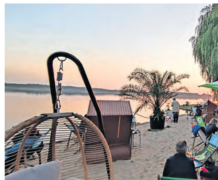
Am Stadtstrand kann man von Donnerstag bis Sonntag, jeweils von 14 bis 22 Uhr, relaxen und kühle Getränke genießen.

Übersicht über die Sommerferienangebote in Torgau vom 1. BIS 14. JULI