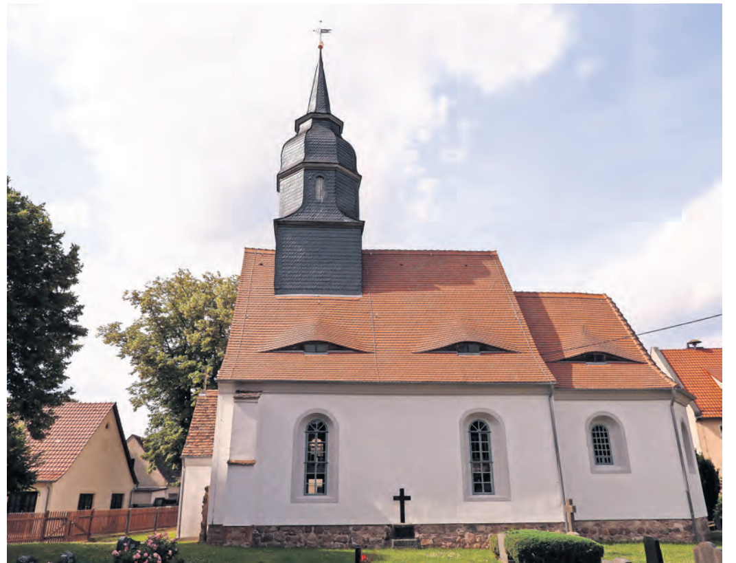
Auf eine bewegende und bewegte Geschichte blickt die Kirche zu Neiden.