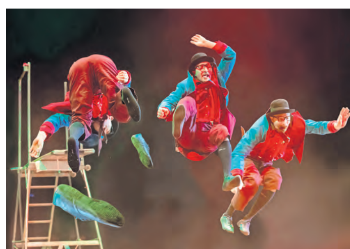
Weltklasse-Artistik und Comedy wird unter der Zirkuszeltkuppel gezeigt.

Überraschendes, Tierdressuren und spektakuläre Stunts werden geboten. Also, Manage frei auf der Neuen Festwiese in Torgau.