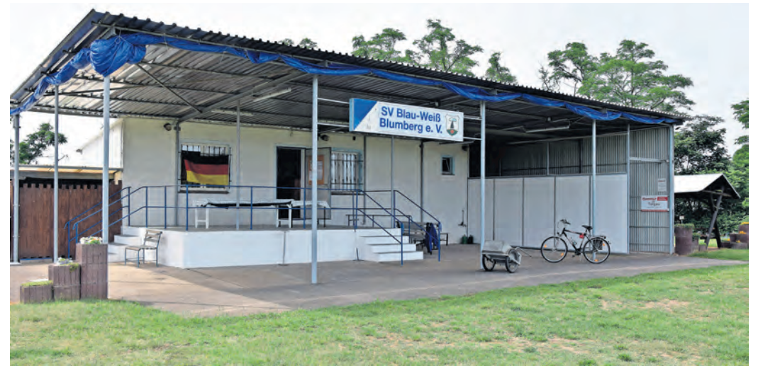
Noch sind der Sportplatz und das Vereinshaus des SV Blau-Weiß Blumberg e.V. verwaist. Das wird sich anlässlich des 30. Vereinsfestes vom 5. bis 7. Juli grundlegend ändern.

BLUMBERG. Die Vorbereitungen für das 30. Vereinssportfest in Blumberg vom 5. bis 7. Juli sind in vollem Gange. Anlässlich dieses Jubiläums wird das Fest zu einem ganz besonderen Ereignis für die Gemeinde. Die Organisatoren haben entschieden, das Fest auf drei Tage auszudehnen – eine Hommage an die traditionellen Veranstaltungen früherer Jahre. Seit Monaten sind engagierte Vereinsmitglieder unermüdlich mit den Vorbereitungen beschäftigt. Der festliche Auftakt ist für Freitag, 5. Juli, ab 18 Uhr geplant, wenn sich ein Umzug durch Blumberg, begleitet von der Schalmekapelle Fichtenberg, in Bewegung setzt. Im Anschluss findet ab 19 Uhr ein aufregendes Fußball-Legendspiel statt, gefolgt von Live-Musik des Duos „Accord B“ aus Rosenfeld ab 20 Uhr, das die Stimmung zum Kochen bringen wird. Der Samstag, 6. Juli , ist ein Tag voller sportlicher und unterhaltsamer Aktivitäten. Früh am Morgen, 8.30 Uhr , start-