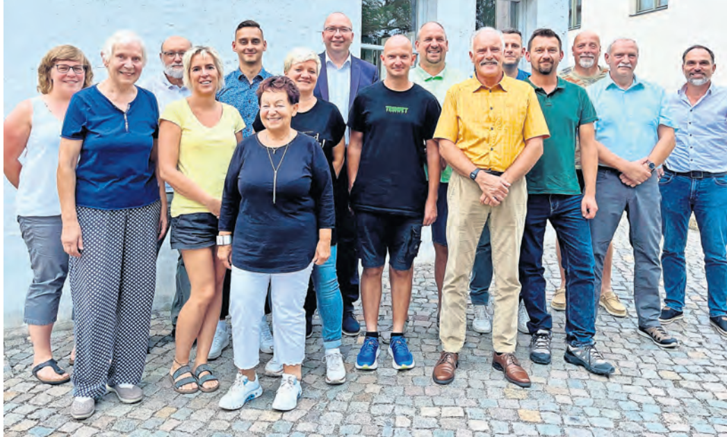
Der neue Gemeinderat in Beilrode hat dieses Aussehen.

NEUER BEILRODER GEMEINDERAT KONSTITUIERTE SICH / Vielfältige Themen zur ersten Ratssitzung