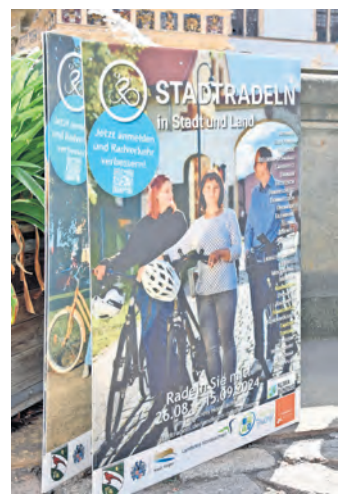
Am vergangenen Montag wurde der Internationale Wettbewerb Stadtradeln gestartet. Eine App zeichnet die gefahrenen Kilometer auf.

Blick, wo das Team und die Kommune stehen. Mitmachen lohnt sich, denn es winken attraktive Preise und Auszeichnungen. Teilnehmen können alle Bürgerinnen und Bürger des Landkreises bzw. der Kommunen, insbesondere auch Kommunalpolitiker, sowie alle Personen, die in Nordsachsen arbeiten, in einem Verein aktiv sind oder eine Schule besuchen. SWB