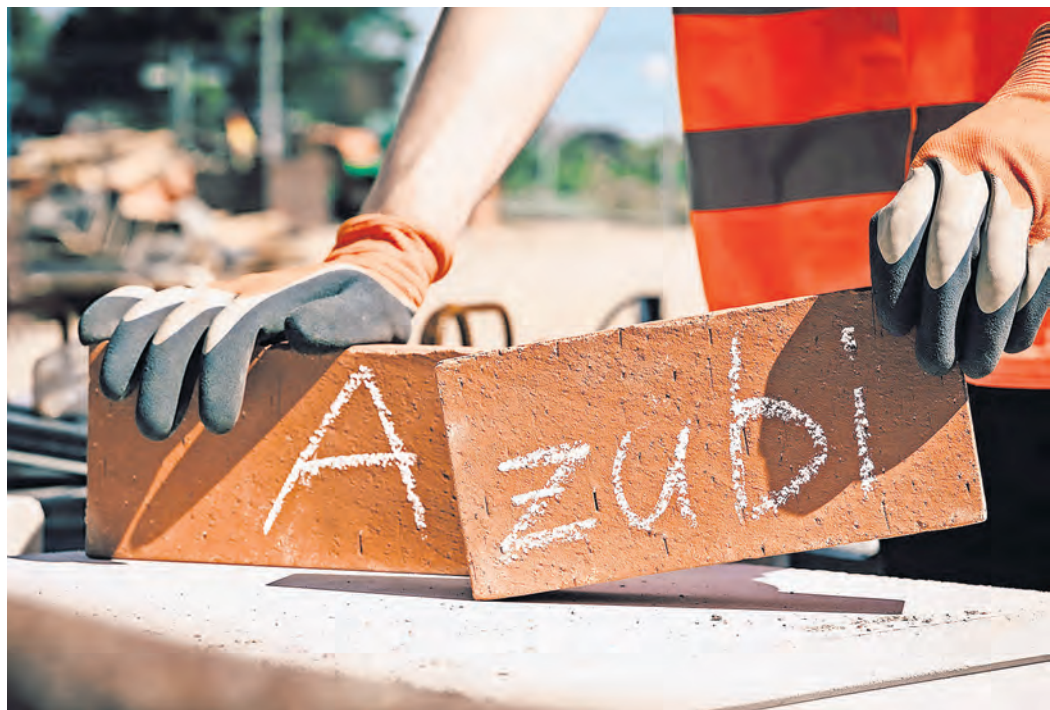
Noch sind im Landkreis Nordsachsen nicht alle Ausbildungsstellen vergeben.

„SPÄTSTARTER“ KÖNNEN SICH im Landkreis Nordsachsen NOCH BEWERBEN