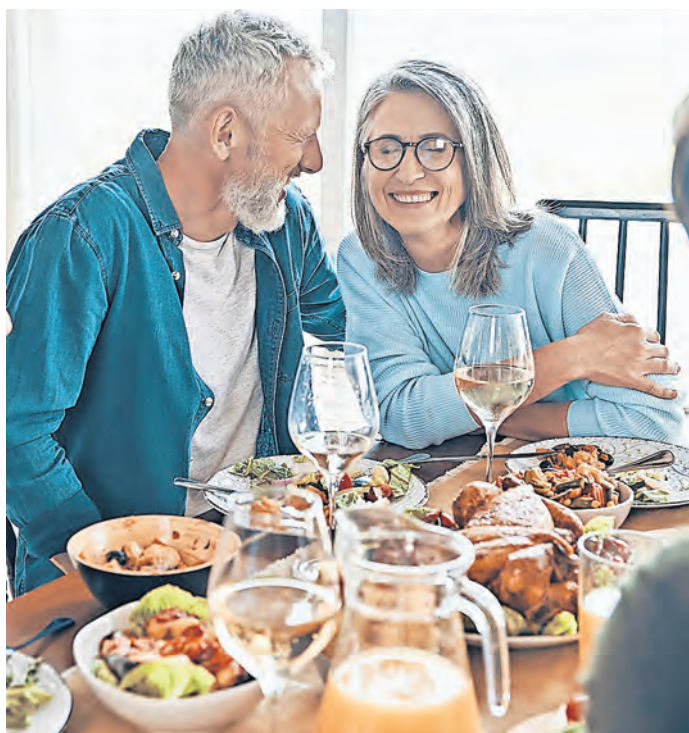
Zu viel, zu schnell, zu fett. Wenn das leckere Essen zu Magen-Darm-Beschwerden führt, helfen spezielle Magentropfen mit bitterstoffhaltigen Heilpflanzen.

REGION. Unsere Verdauung ist sensibel. Zu viel oder zu spät gegessen, im Urlaub Ungewohntes auf den Tisch bekommen – und schon drückt der Magen, mehr oder weniger starke Übelkeit verdirbt den Genuss. Gut, wenn jetzt zu Hause oder in der Reiseapotheke helfende Bitterstoffe warten. Denn in der Tat können Magentropfen mit bitterstoffhaltigen Arzneipflanzen in solchen Fällen eine schnelle und umfassende Linderung bringen.