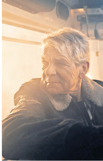
Im Vorjahr waren die Fans begeistert, und in diesem Jahr sind die Aussichten alles andere als trüb: Am 9. August gibt es ein Wiedersehen mit Schlagerstar Matthias Reim in Wermisdorf.

WERMSDORF. Mit „Verdammt, ich lieb dich“ landete Matthias Reim 1990 einen Megahit. Nach Jahrzehnten des beruflichen und privaten Auf und Abs ist „Matze“, wie ihn seine Freunde nennen, längst zurück im Leben und auf der Bühne. War schon das Wermisdorfer Konzert im vergangenen Jahr eines der Höhepunkte der Open-Air-Saison in der Region, so erwartet die Fans des rockigen Schlagers auch in diesem August ein außergewöhnliches Konzert-Highlight vor der einzigartigen Kulisse von Schloss Hubertusburg. Am Freitag, dem 9. August, kommt Matthias Reim auf seiner „Live 2024!“-Tour nach Wermisdorf. Einlass ist um 19 Uhr, Konzertbeginn um 21 Uhr. Noch sind Karten ab 59,90 Uhr gegebenenfalls zuzüglicher Gebühren im Vorverkauf erhältlich.