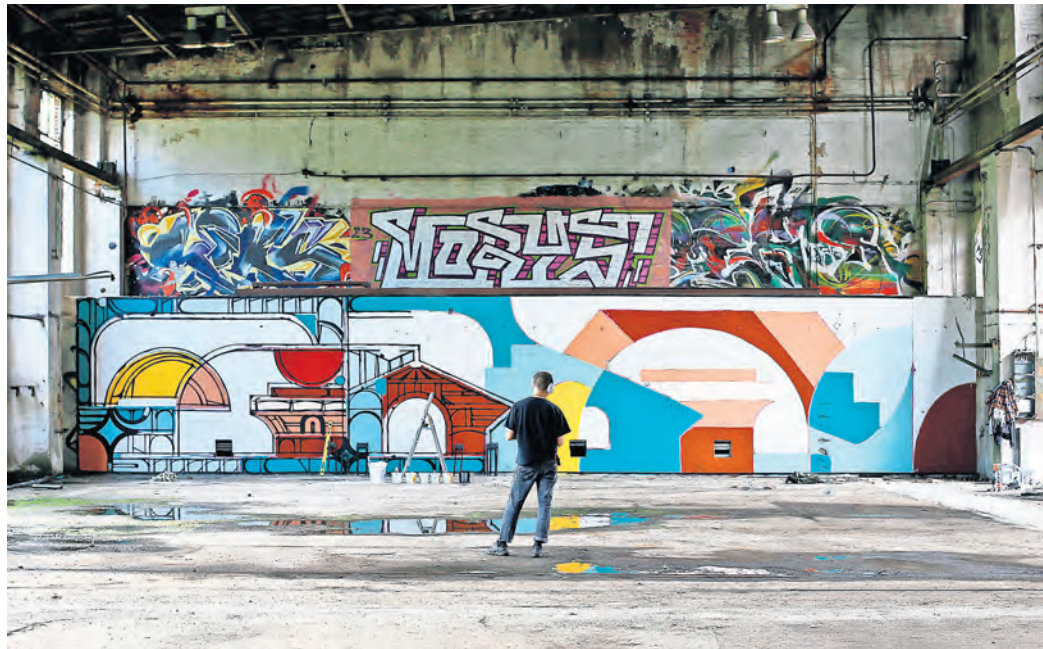
Kreative aus aller Welt bringen im Rahmen des ibug-Festivals Farbe ins Grau von Industriebrachen – diesmal in den einstigen Muskator-Werken in Riesa.

RIESA. Die Industriebrachengestaltung – kurz ibug – findet in diesem Jahr zum 19. Mal statt. Austragungsort des Festivals für urbane Kunst ist 2024 die sächsische Stadt Riesa. Ab dem 9. August werden die ehemaligen Muskator-Werke direkt an der Elbe zur Bühne für Kreativität aus aller Welt, die sowohl Innenräume als auch Außenbereiche mit einer Vielzahl von Kunstwerken zwischen Malerei und Graffiti, Installationen, Skulpturen, Textilkunst, Fotografie und Multimedia gestalten. Vom 30. August bis zum 1. September und vom 6. bis 9. September hat das Publikum dann die Möglichkeit, eine einzigartige Kunstausstellung zu erleben. Neben den faszinierenden Kunstwerken gibt es ein vielfältiges Festivalprogramm. Auf junge Besucher und Besucherinnen warten während der Bildungswoche spezielle Angebote, um ihre Leidenschaft für Kunst zu wecken und zu fördern.