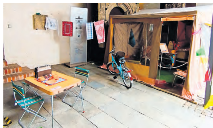
Geschichte und Genuss lassen sich kombinieren - im Museum Torgau am 31. August zur Kellernacht.

TORGAU. Das Museum Torgau lädt am Samstag, 31. August, um 19 Uhr zu einem Abend voller Erinnerungen ein. Auf Grund der hohen Nachfrage an Kellerführungen wird es an diesem Abend eine Kombination von Führungen durch die historischen Kelleranlagen und Führungen durch die Ausstellung „Urlaub in der DDR – von Ferienfreuden im In- und Ausland“ geben. Damit Geschichte nicht ganz so trocken daherkommt, werden neben den unterhaltsamen Führungen auch kleine Verkostungen gereicht. Wer kennt