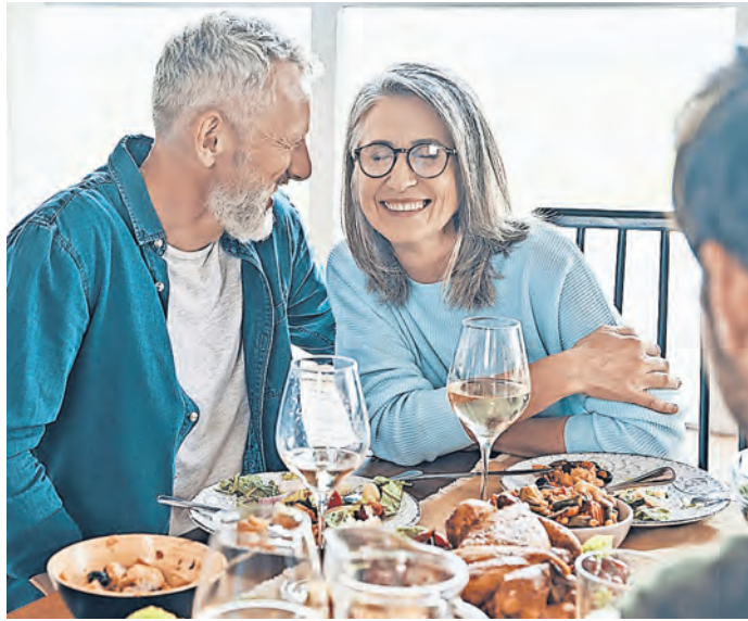
Zu viel, zu schnell, zu fett. Wenn das leckere Essen zu Magen-Darm-Beschwerden führt, helfen spezielle Magentropfen mit bitterstoffhaltigen Heilpflanzen.

REGION. Unsere Verdauung ist sensibel. Zu viel oder zu spät gegessen, im Urlaub Ungewohntes auf den Tisch bekommen – und schon drückt der Magen, mehr oder weniger starke Übelkeit verdirbt den Genuss. Gut, wenn jetzt zu Hause oder in der Reiseapotheke helfende Bitterstoffe warten. Denn in der Tat können Magentropfen mit bitterstoffhaltigen Arzneipflanzen in solchen Fällen eine schnelle und umfassende Linderung bringen.