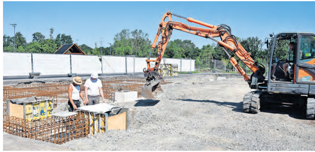
Die Fachleute der Matthias Tröppen Bauunternehmung GmbH aus Roitzsch kommen gut voran.

BIS MAI 2025 soll das Projekt auf dem ehemaligen LAGA-Gelände umgesetzt sein