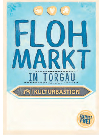
Grafik: NIWI Design

TORGAU. Am Sonntag, 11. August, beginnt um 11 Uhr wieder ein FLOHMARKT – es ist wieder