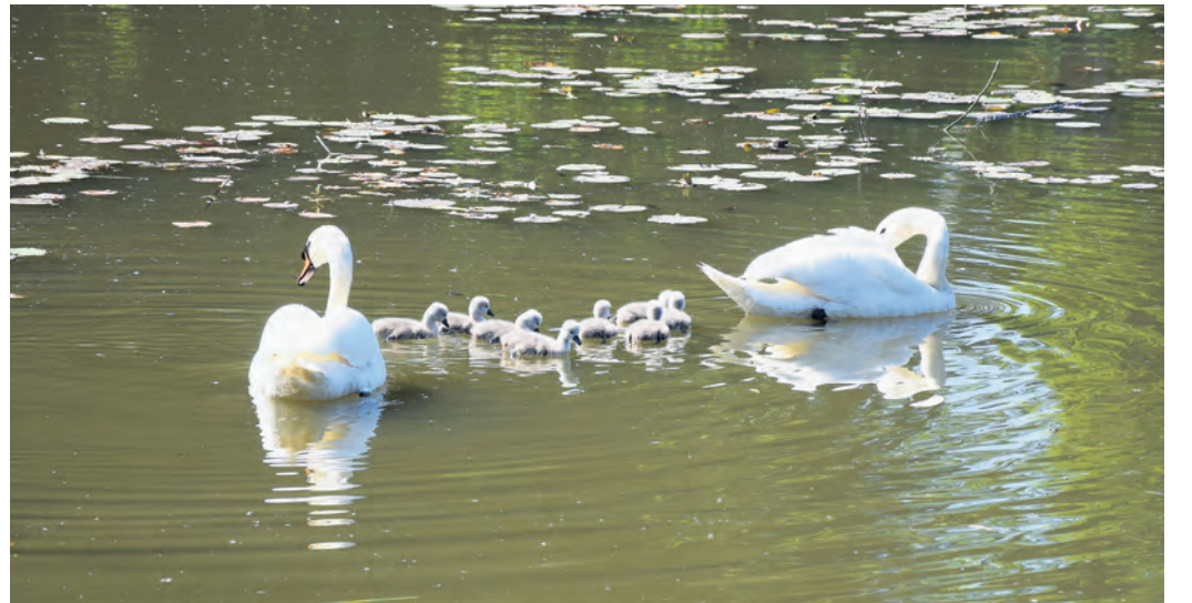
Anfang Mai präsentierte sich Familie Schwan mit ihren acht Jungschwänen.

Vier von ursprünglich acht JUNGSCHWÄNEN haben überlebt