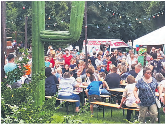
Das Countryfest in Dahlenberg mobilisiert die Massen.

Programm-Vielfalt AM 17. AUGUST auf dem Festplatz des Ortes