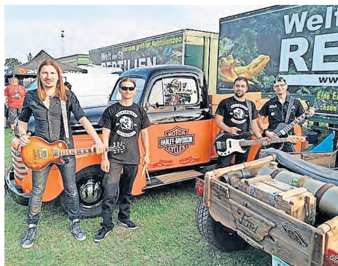
Das Harley- und US Car-Treffen Döbrichau ist eine Mischung aus Technik-Begeisterung, Unterhaltung und Foodmeile. Natürlich spielen auch Bands der Szene.