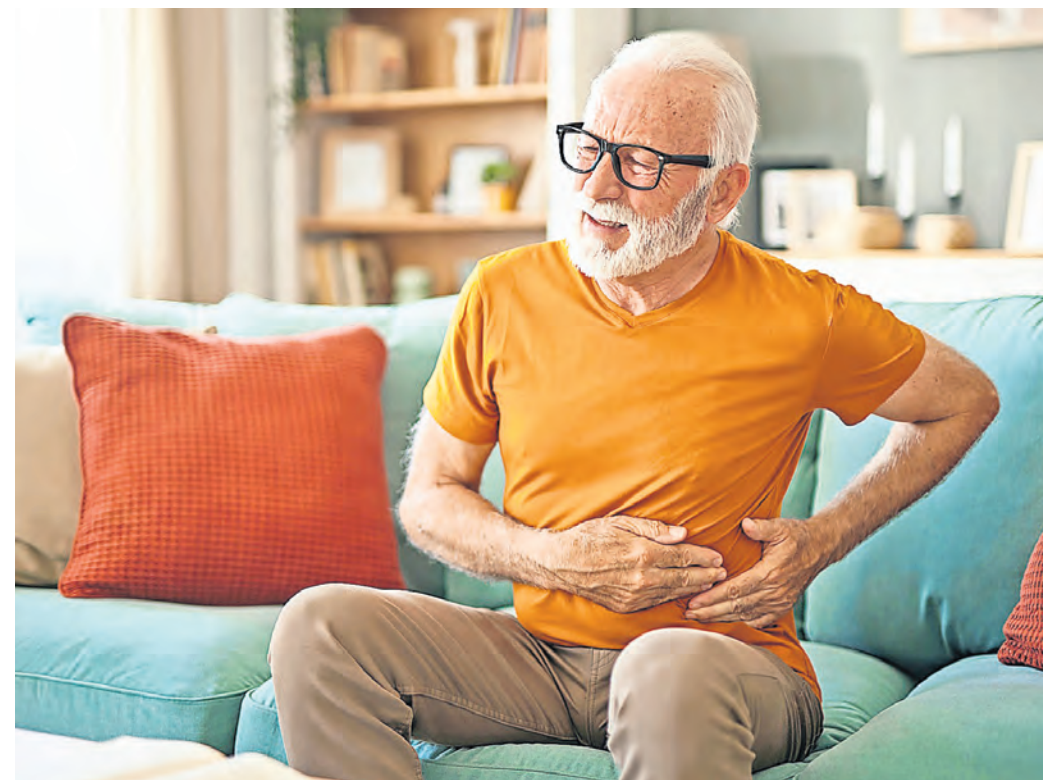
Wiederkehrende Schmerzen in linken Unterbauch können Anzeichen einer Divertikelkrankheit sein.

Die Divertikelkrankheit kann verschiedene Formen annehmen, weshalb Ärzte sie in verschiedene „Typen“ einteilen. Werden im Darm Divertikel zufällig gefunden, es sind aber keine Beschwerden vorhanden,