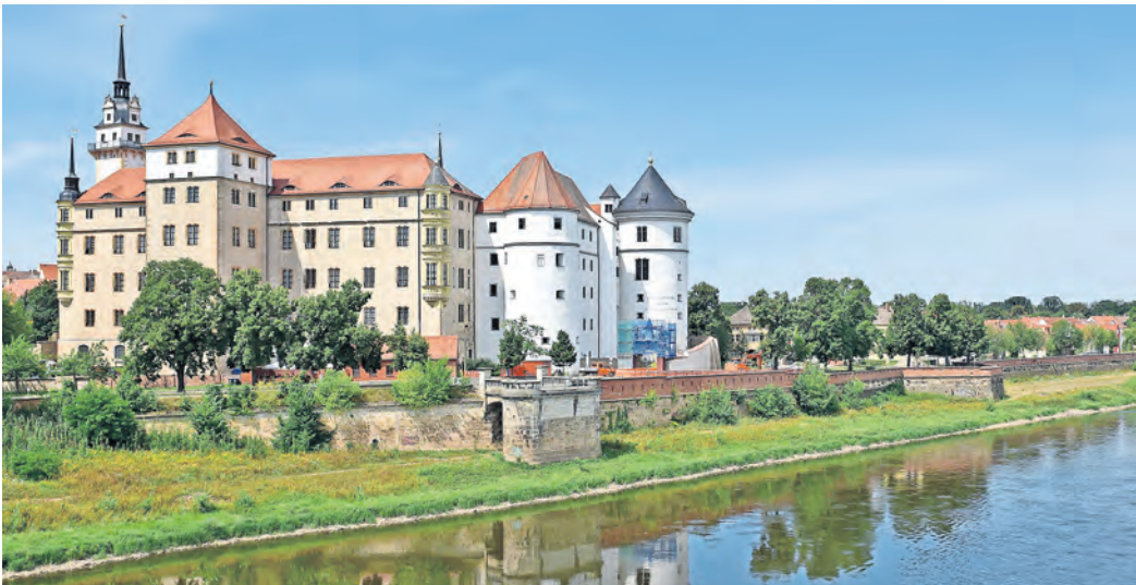
Nach der Restaurierung der beiden Eckerker auf der Elbseite des Schlosses kann nun auch die dazwischenliegende Fassade saniert werden. Um dies finanzieren zu können, bekommt der Landkreis Nordsachsen Fördermittel des Landes Sachsen in Höhe von 1,38 Millionen Euro. Der Landkreis steuert selbst 778.000 Euro bei.

FÖRDERMITTELBESCHIED ERMÖGLICHT SANIERUNG der Elbfassade / Die weithin sichtbare Fassade soll bald in neuem Glanz erstrahlen