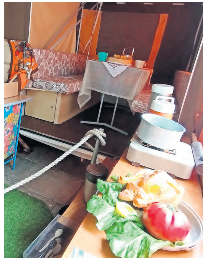
Ein Abend voller Erinnerungen wird am 31. August im Museum Torgau geboten. SWB

TORGAU. Vom Keller bis zum Zeltplatz - Ein Abend voller Erinnerung mit Genuss und Geschichte heißt es im Museum Torgau am Samstag, 31. August, um 19 Uhr. Aufgrund der hohen Nachfrage an Kellerführungen wird es an diesem Abend eine Kombination von Führungen durch die historischen Kelleranlagen und Führungen durch die Ausstellung „Urlaub in der DDR- von Ferienfreuden im In- und Ausland“ geben. Damit Geschichte nicht ganz so trocken daherkommt, werden neben den unterhaltsamen Führungen auch kleine Verkostungen gereicht. Wer kennt noch Kalten Hund, Grüne Wiese oder Knusperflocken? Ihre Gaumen werden sich ganz sicher auch an diese Geschmacksexplosionen erinnern. An frühere Zeltplatz-Disco oder Tanzabende wird das kleine Konzert mit Accord B. im Anschluss an die Führungen erinnern. Museumsleiterin Cornelia König: „Freuen Sie sich mit uns auf einen Abend voller Genuss für Auge, Ohr und Gaumen.“ Karten können ab sofort an der Museumskasse erworben werden. SWB