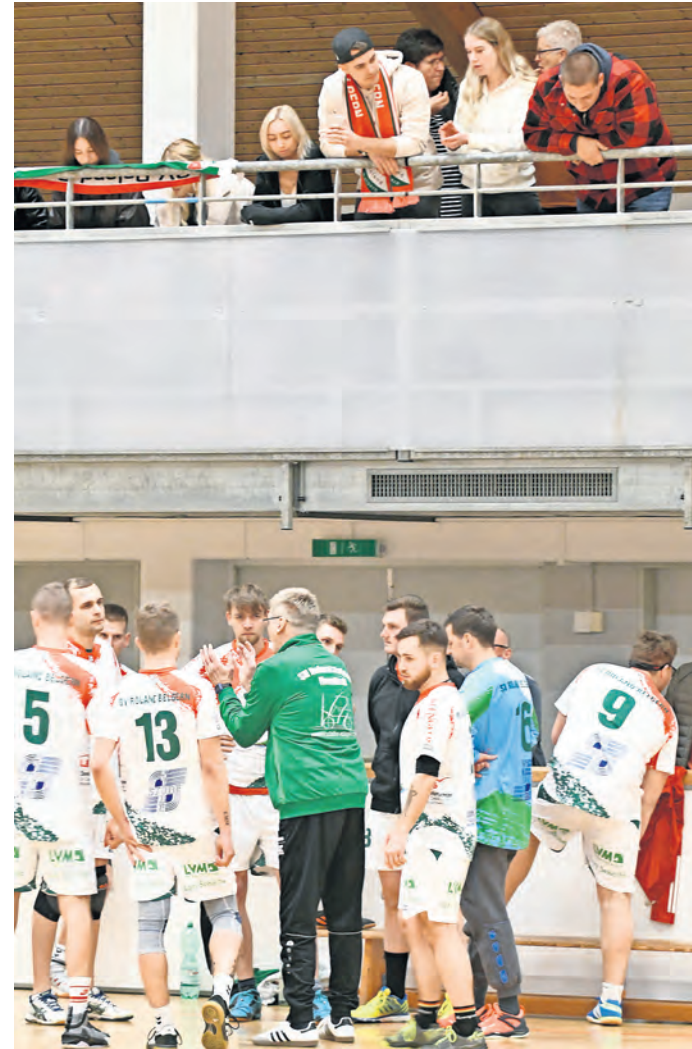
Der Handballsport in Belgern blickt auf eine bewegte und bewegende Geschichte. Am 31. August wird das 100-jährige Jubiläum des Bestehens gefeiert.

BELGERN. Die Abteilung Handball des SV Roland Belgern e.V. feiert in diesem Jahr ihr 100-jähriges Bestehen. Handball-Belgern blickt auf eine bewegte Geschichte und viele Geschichten rund um den Handball.