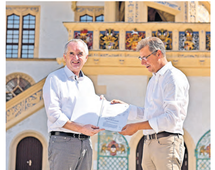
Staatsminister Thomas Schmidt (links) und Landrat Kai Emanuel bei der Übergabe des Fördermittelbescheids auf Schloss Hartenfels in Torgau.

Dazu wird die etwa 3.300 Quadratmeter große Gebäudefläche im Jahr 2025 komplett eingerüstet. Die restauratorischen Herausforderungen bei der dann noch offenen Sanierung der gartenseitigen Fassade werden als weniger anspruchsvoll eingeschätzt. Fördermittel bei Bund und Land sind bereits beantragt. SWB