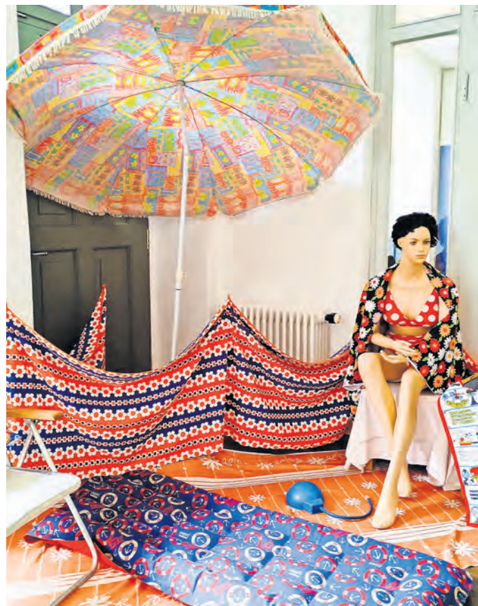
Im Museum Torgau werden mit der Sonderausstellung „Urlaub in der DDR“ Erinnerungen geweckt.

EIN ABEND VOLLER ERINNERUNGEN vom Keller bis zum Zeltplatz im Museum Torgau