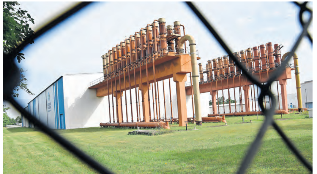
Anlässlich eines Tages der offenen Tür im Wasserwerk Weßnig kann am Samstag, 24. August, von 10 bis 14 Uhr der Weg des Wassers nachvollzogen werden.

komme, das FEO die Brisanz des Themas Ressourcenschutz stärker in die Öffentlichkeit und mithilfe von Partnern im Bereich Natur- und Artenschutz auch anschaulich präsentieren wolle. „Verschiedene Wissensinseln im und ums Werk werden den Weg des Wassers aus der Aue, durch unsere Aufbereitungsstrecke bis in die Fernwasserleitung mit nützlichen und kuriosen Infos, spannenden Experimenten und kleinen Mitmachaktionen nachzeichnen. Wir freuen uns sehr, dafür auch Vereine aus Weßnig und Torgau mit entsprechendem fachlichen Hintergrund und Spaß an der guten Sache als Unterstützer gewonnen zu haben.“ So gebe es für Familien mit Kindern Sport- und Spielangebote mit und ohne Bezug zum kühlen Nass und zu den tierischen Wasserfreunden in der Region sowie ganz viel Potenzial, als kleiner Wissenschaftler den Heimweg anzutreten. Außerdem wird sich FEO als Ausbildungsbetrieb und Arbeitgeber vorstellen, wenn die Trink-