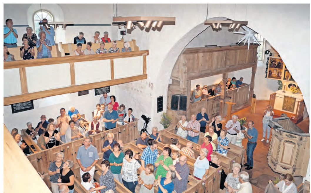
Bis auf den letzten Platz gefüllt war die Dorfkirche Lausa.

verse Werke von Bach, Bartholdy und Mozart brachte er mit großer Leidenschaft zu Gehör. Die Orgel wurde auch schon lange nicht mehr mit solch Inbrunst gespielt. Fazit des Abends: nach einer herrlichen Zugabe verließen begeisterte Zuhörer das kleine Haus mit Musik im Herzen. Es war mal wieder ein Beweis, dass es auch möglich ist, Kunst auf dem Land zu erleben. DENISE MICKAN