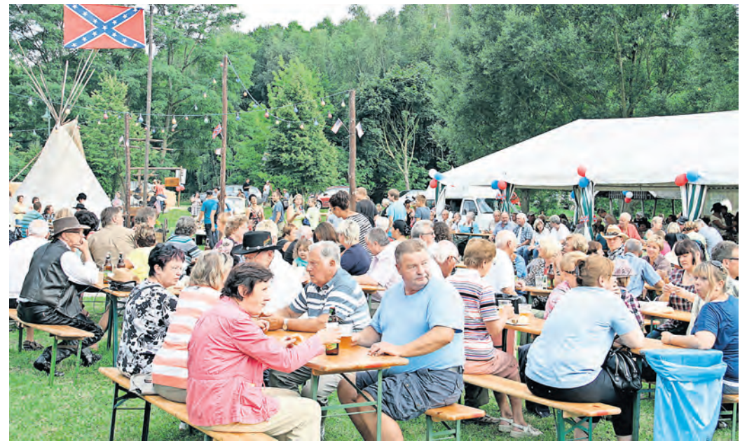
Country-Fest in Dahlenberg: Indianer und Cowboys, aber auch jeder Besucher feiert auf dem Festplatz Dahlenberg ausgelassen.

DAHLENBERG. Das kleine Dahlenberg kommt groß raus, lädt ein zum 6. Kinder-, Dorf- und Countryfest am Samstag, 17. August. Los geht es um 9 Uhr am Dorfteich mit dem Kinder-Angeln. Ab 14 Uhr geht es auf dem Festplatz an der Freiwilligen Feuerwehr Dahlenberg weiter. Neben Darts, Büchsenwerfen, Ponyreiten, Indianerspielen, Hüpfburg, Kinderschminken mit Fotobox, Nagelholz, Kinderkarussell, startet 15.30 Uhr eine Piratenshow. Später erhält das Fest den typischen Country-Charakter mit Line Dance, Bierglasschieben und der Country Band „Partygang“. Außerdem wird gegen 22 Uhr, wenn es das Wetter zulässt, ein Feuerwerk gezündet. Für die musikalische Umrahmung sorgt DJ Fränki. Hunger und Durst können zu jeder Zeit gestillt werden.