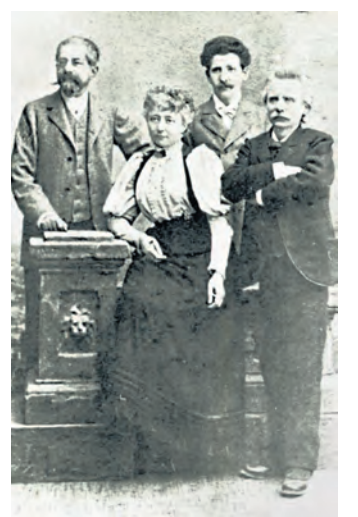
Norwegens Nationalkomponist Edvard Grieg (re. im Bild) mit Ehefrau und seinen Leipziger Verlegern.