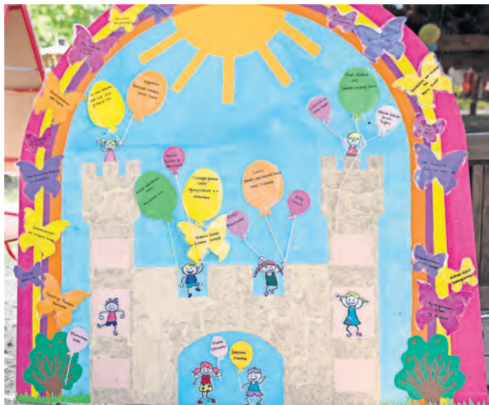
Sponsoren sind wichtig und werden verewigt.

LANGENREICHENBACH. Vom 30. August bis 1. September richtet die Freiwillige Feuerwehr Langenreichenbach auf dem Festplatz das 32. Feuerwehrfest mit einem breiten Programmangebot aus. Los geht es am Freitagabend, 20 Uhr, mit einem Fackelumzug, ab 21 Uhr erklingen LA-Beats mit DJ Tobi und Justin Prince. Der Samstag beginnt 14 Uhr mit dem 32. Heidelbergpokal der Feuerwehren auf dem Sportplatz. Ab 15 Uhr ist die Minifeuerwehr in Aktion, ab 20 Uhr startet der große Feuerwehrball mit DJ Tobi. Der Sonntag steht ab 10 Uhr im Zeichen des Volleyballs. Die Schalmemusikanten gestalten ab 11 Uhr einen Frühschoppen, es schließen sich das Menschenklickerturnier und der Fußballdartwettbewerb an. Für das leibliche Wohl wird gesorgt, zudem sorgen Schausteller auf dem Festplatz für Unterhaltung. SWB