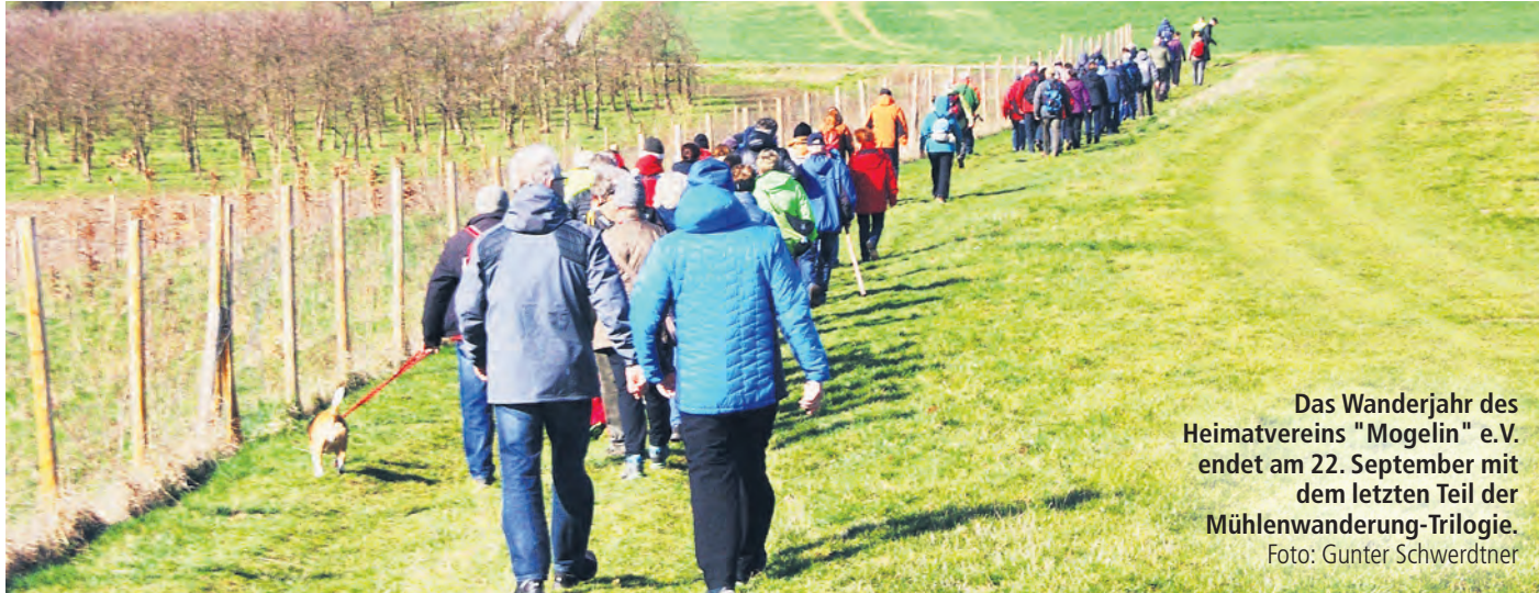
Das Wanderjahr des Heimatvereins "Mogelin" e.V. endet am 22. September mit dem letzten Teil der Mühlenwanderung-Trilogie.

HEIMATVEREIN „MOGELIN“ E.V. freut sich auf rege Beteiligung am 22. September