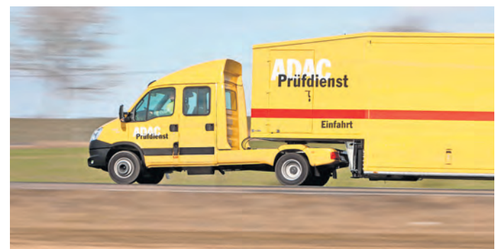
Das Autocheck-Mobil des ADAC steuert Mügeln an. Vor Ort können Kraftfahrer an zwei Tagen Bremsen, Stoßdämpfer oder Ladezustand der Batterie ihres Fahrzeugs kostenlos prüfen lassen.

Kraftfahrer können am 19. UND 21. SEPTEMBER IN MÜGELN ihr Fahrzeug überprüfen lassen