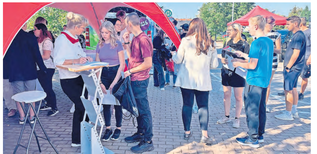
Zur 28. Ausbildungsmesse "Chance" in Oschatz werden am kommenden Samstag – wie schon im Vorjahr – viele interessierte junge Menschen erwartet, die sich über ihre beruflichen Perspektiven informieren möchten.

OSCHATZ. Am Samstag, dem 21. September, findet die jährliche Ausbildungsmesse „Chance“ in Oschatz statt. Erstmals wandert die Ausbildungsmesse ins Zentrum der Döllnitzstadt – konkret in das Thomas-Müntzer-Haus. Dort wurde, inklusive Außenbereich, die Kapazitätsgrenze von 74 teilnehmenden Unternehmen längst erreicht. Es ist bereits die 28. Auflage dieser Messe.