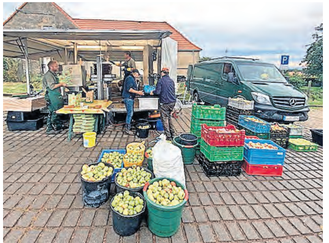
Obwohl der Spätfrost die Obsternte diesmal stark beeinträchtigte, hofft der Heimatverein Bergtreue Collm e.V. dennoch, dass - wie in den vorangegangenen Jahren - eine erfreuliche Menge an zu pressendem Obst zusammenkommt.