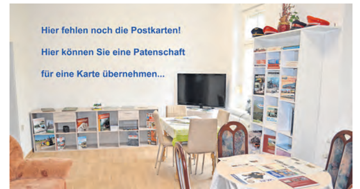
An diesem Samstag, dem 21. September, wird der neue Lese- und Ausstellungsraum im Museum seiner Bestimmung übergeben. Für Postkarten, die an der noch freien Wand künftig zu bestaunen sind, können Interessierte gern Patenschaften zur Unterstützung des Museums übernehmen.

OSCHATZ. In Deutschland haben das Bundesverkehrsministerium und die Bahnbranche, koordiniert von der Allianz pro Schiene, den Tag der Schiene im Jahr 2022 ins Leben gerufen. Seitdem dreht sich jedes Jahr an drei aufeinanderfolgenden Tagen im September an vielen Orten in ganz Deutschland alles um die Schiene.