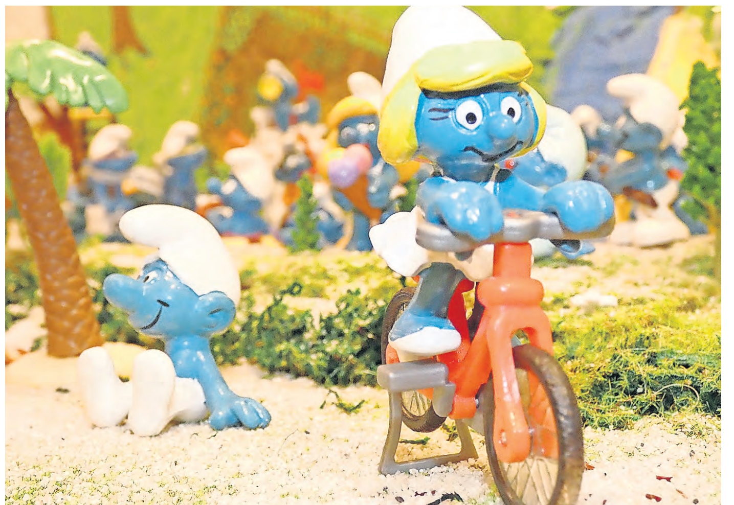
Die bunte Sonderausstellung zum Thema Schlümpfe lockt auch in den Herbstferien ins Stadt- und Waagenmuseum Oschatz.

Doch es sind nicht nur die Figuren zu sehen, die viele aus ihrer Kindheit kennen: Auch aktuelle Figuren aus dem Ü-Ei oder aus McDonalds-Serien las-