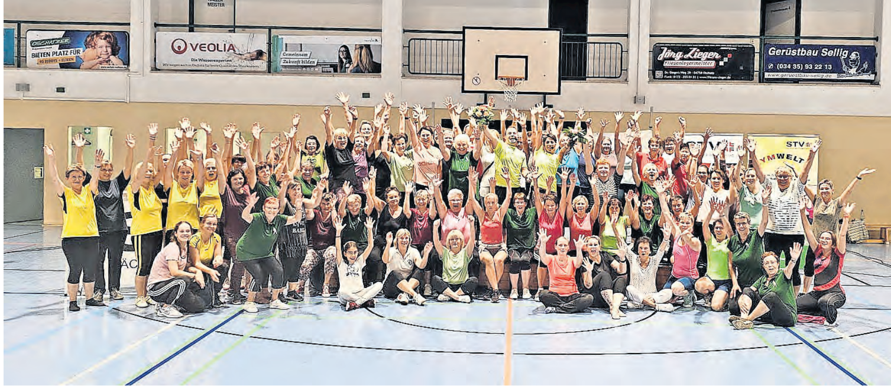
Rund 90 Interessierte lockt die achte Auflage vom Oschatzer Gymwelt-Abend zum Sporttreiben.

Ein Rückblick auf den OSCHATZER GYMWELT-SPORTABEND