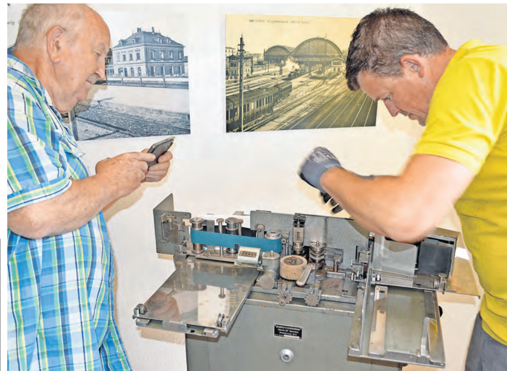
Die Sammlung wird ständig erweitert. Eines der neueren Exponate ist diese Briefstempelmaschine.

EISENBAHN-POSTKARTEN-MUSEUM beteiligt sich an diesem Wochenende an bundesweiter Aktion