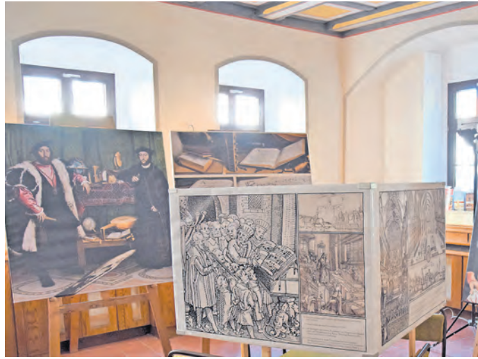
Die Ausstellung im Kentmann-Haus.