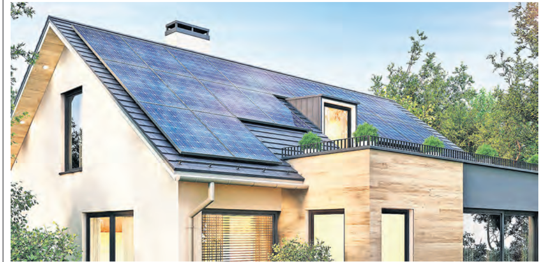
Eine Solaranlage für Ihr Dach? Kein Problem mit den Stadtwerken Torgau.