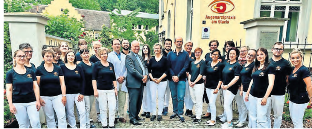
Das Team der Augenarztpraxis am Glacis in Torgau.

TEAM DER AUGENARZTPRAXIS AM GLACIS bietet neueste Methode der Linsen Chirurgie