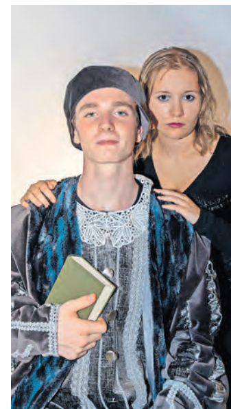
Das Johann-Walter-Gymnasium lädt seine Gäste zu einer geschichtlichen Reise rund um ihren Namensgeber ein.