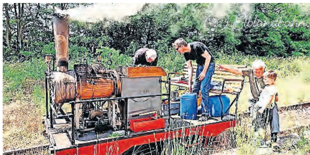
Dampfdraisinen-Pendelfahrten gibt es am Samstag und Sonntag 5. und 6. Oktober, jeweils von 10 – 17 Uhr zwischen den Haltepunkten Neiden (bevorzugter Einstieg) und Vogelgesang.

ELBLANDBAHN LÄDT am 5. und 6. Oktober ZU PENDELFahrTEN VON NEIDEN NACH VOGELGESANG