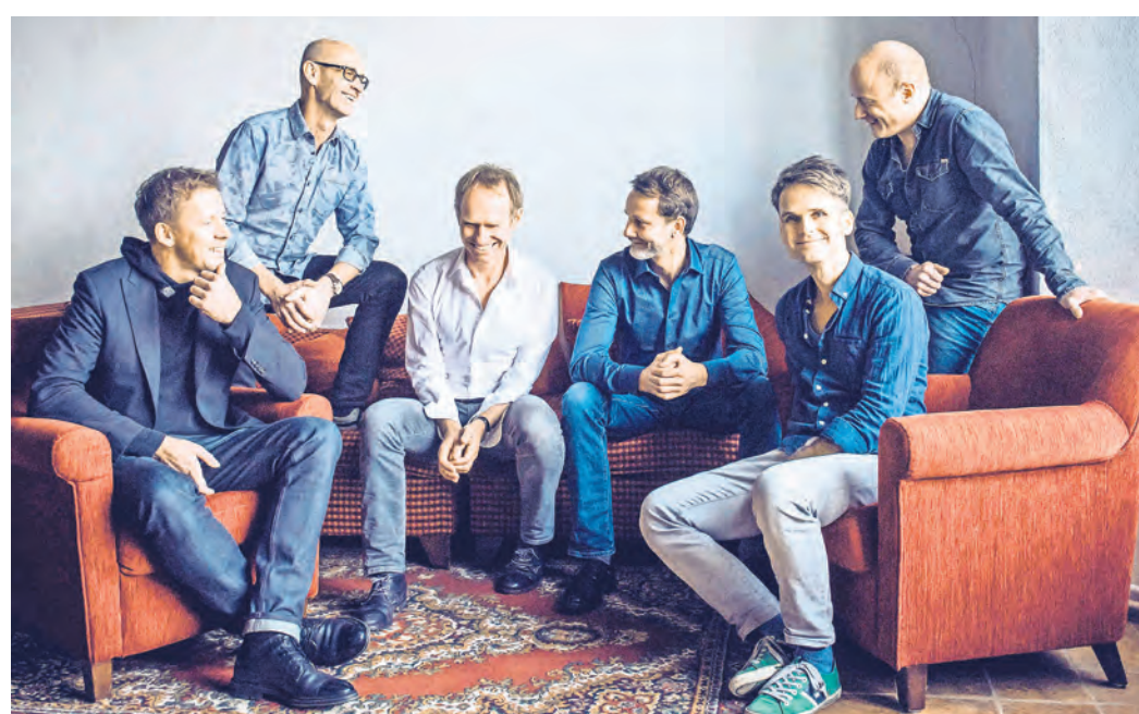
Seit 40 Jahren stehen Keimzeit auf der Bühne, am 11. Oktober zum wiederholten Male in Torgau in der Kulturbastion. Keimzeit sind fast schon als Stammgäste zu bezeichnen.

ÜBER EINEN VERSCHWUNDENEN JUGENDCLUB und das Fernweh