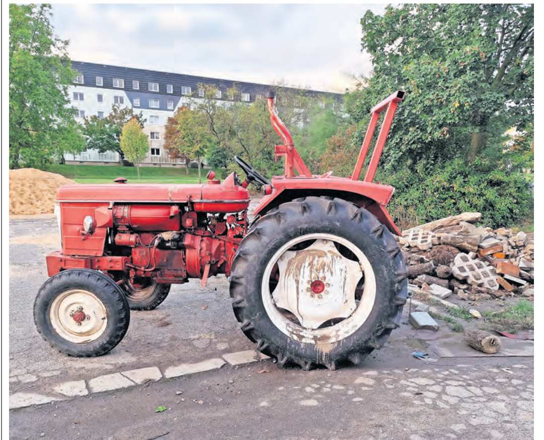
Oldtimer-Fans dürften ihre Freude haben, aber aktuell ist der Traktor ein Schandfleck.

OLDTIMER-GEFÄHRT STEHT SEIT WOCHEN in Torgau-Nordwest