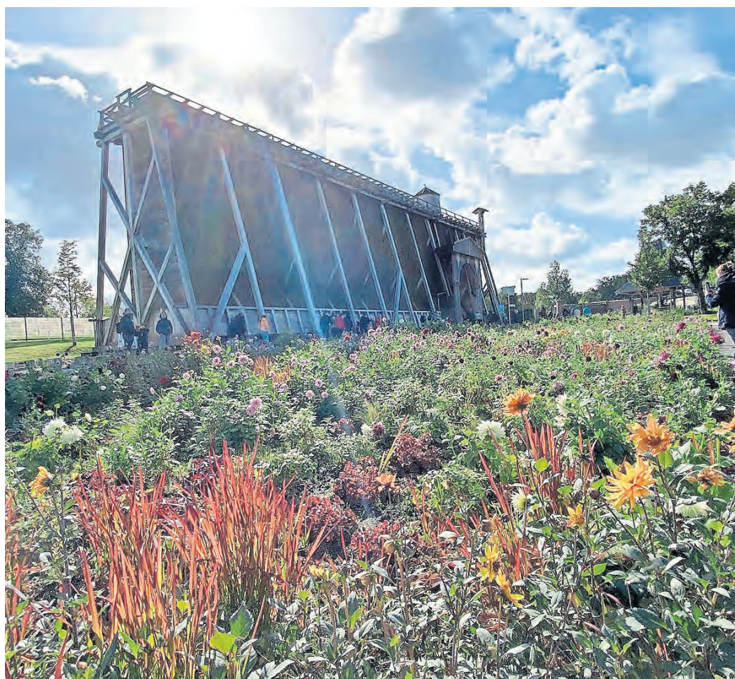
Mittelpunkt der Landesgartenschau in Bad Dürrenberg ist das Grenadierwerk im historischen Kurpark. Kleine Details sorgen für Hingucker.

➔ Mehr Infos auf: www.laga-badduerrenberg.de