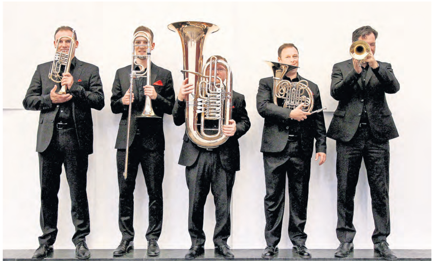
Fünf Mal Blech und trotzdem alles Gold. Das Blechbläserquintett der Sächsischen Bläserphilharmonie bittet musikalisch zum Tanz. Am 11. Oktober gestalten sie ein Rathauskonzert in Torgau.

Karten gibt es im Vorverkauf zu je 13 Euro im Torgau-Informations-Center (TIC) Markt 1, Telefon: 03421 7014-0, E-Mail: info@tic-torgau.de. Restkarten gibt es am Veranstaltungstag ab 13.30 Uhr an der Abendkasse zu je 15 Euro.