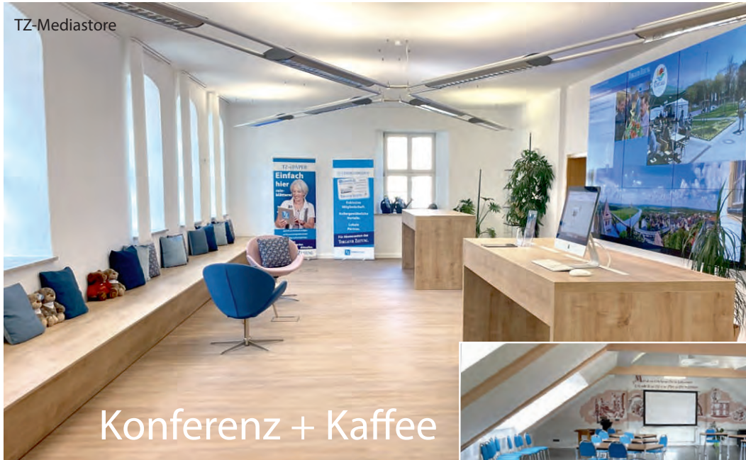
Konferenz + Kaffee

Moderne Atmosphäre: Die TZ bietet Unternehmen zwei Räume, die jeweils eigenständig oder aber im Zusammenspiel flexibel genutzt werden können.