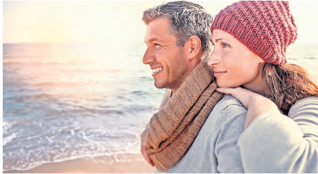
Schnell wieder raus in die Natur! Denn dank einer bewährten Naturarznei mit Melisse sowie 12 weiteren Heilpflanzen gehen Erkältungen häufig schneller vorbei.

STUDIEN ZEIGEN IMMUNSTIMULIERENDE WIRKUNG