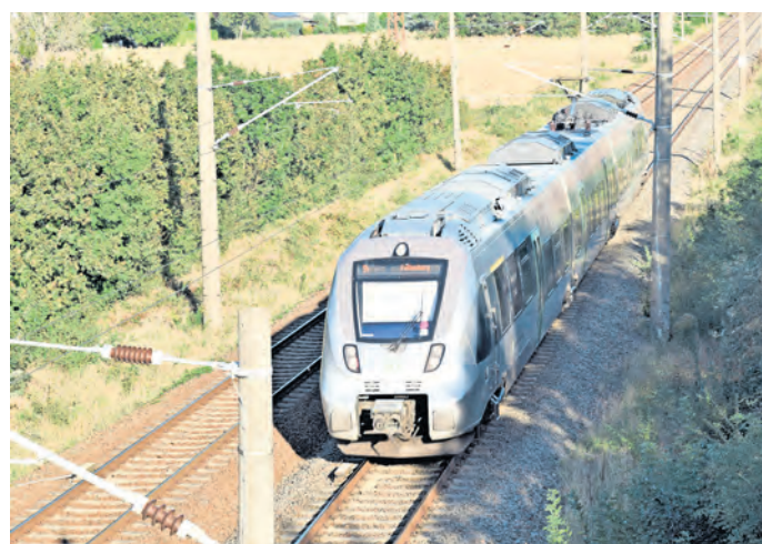
Ein Gewinn ist die S-Bahn der Linie S 4, die auch Beilrode anfährt, für Ostelbien allemal. Nun ziehen dunkle Wolken auf. Foto: SWB/HL

beim Gemeinde-Oberhaupt gewichen waren, kündigte Vetter an, um die S-Bahn kämpfen zu wollen. Zu viel hänge daran. Der erst vor wenigen Jahren errichtete Park & Ride-Platz, der Berufs-Pendlern die Fahrt zur Arbeit erleichtert, der geplante Umbau des Bahnhofgebäudes mit Arztpraxis zähle auf alle Fälle dazu, um jungen Familien eine Perspektive im ländlichen Raum bieten zu können. Vetter kündigte Gespräche mit allen Beteiligten an, um das drohende Unheil abzuwenden. Eine Frage sei an dieser Stelle erlaubt: Sieht so die viel beschworene Verkehrswende für den ländlichen Raum aus? SWB/HL