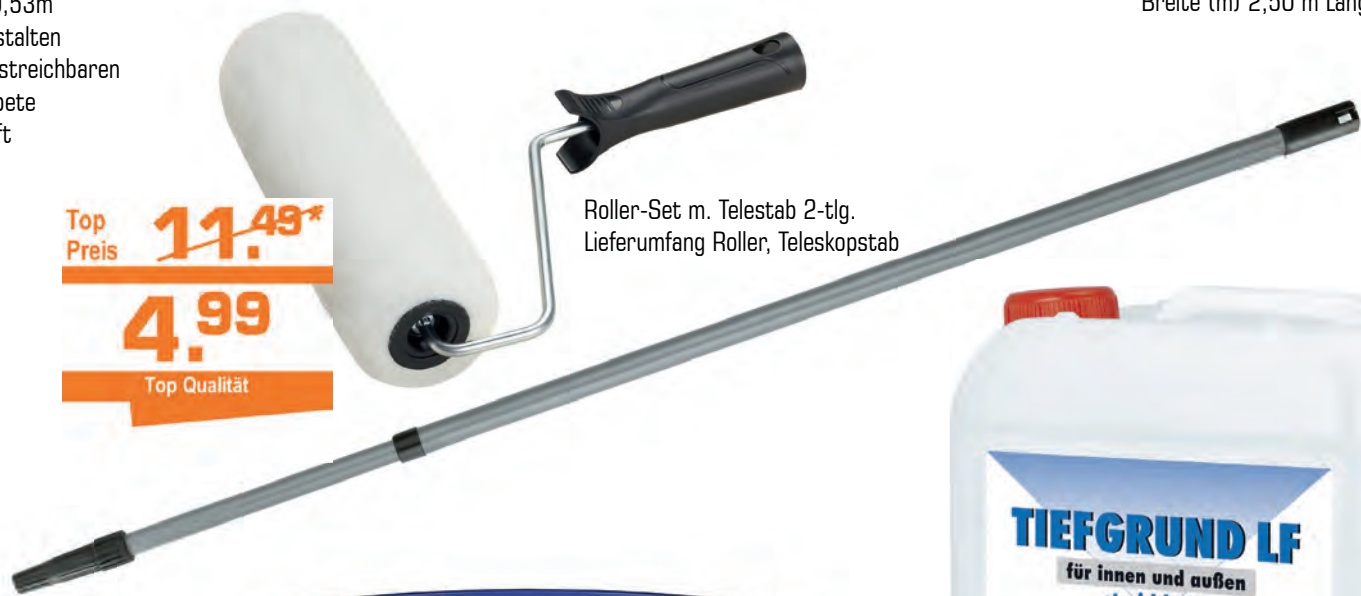
Roller-Set m. Teleskop 2-tlg. Lieferumfang Roller, Teleskopstab