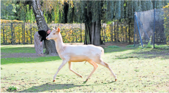
Der O-Schatz-Park hat jetzt einen weißen Damwildhirsch.