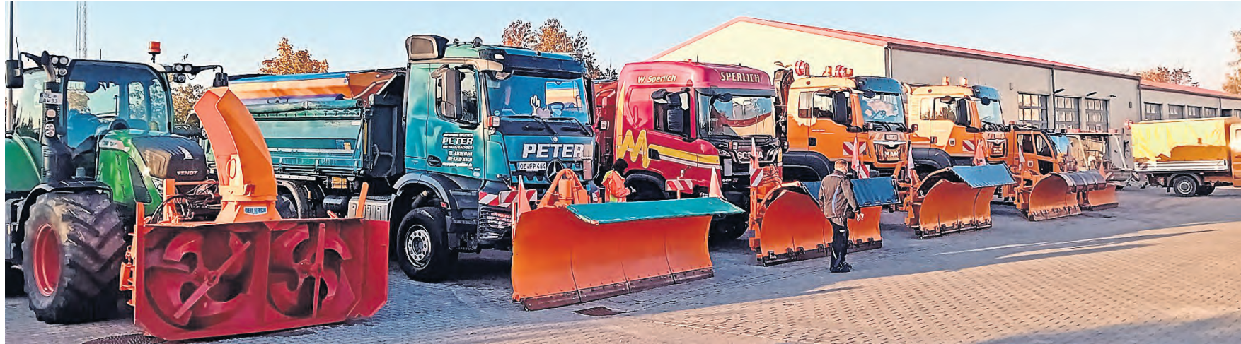
Nordsachsens Winterdienst ist starkklar.