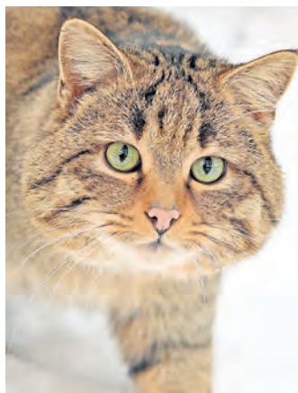
Kommt die Wildkatze zurück in die Dahleener Heide?