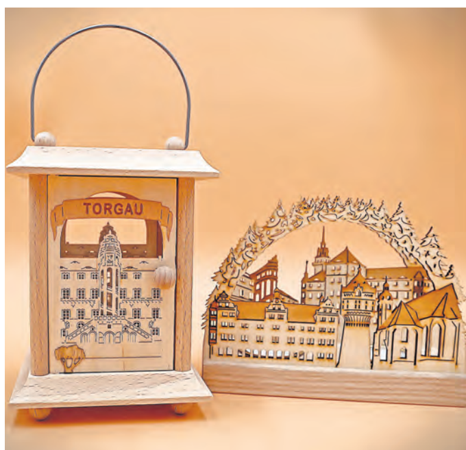
Holzlaterne und Schwibbogen mit Alleinstellungs-Merkmal, typisch Torgau.