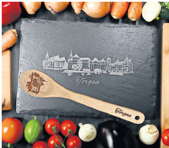
Brettchen mit Torgau-Motiv.

Der Torgau Shop im Rathaus ist montags bis freitags von 10 bis 18 Uhr, am Wochenende von 10 bis 16 Uhr geöffnet. Das Team freut sich auf Ihren Besuch – wann schauen Sie vorbei?