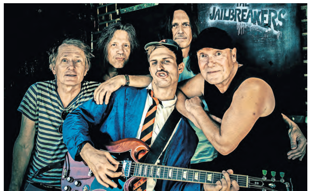
The Jailbreakers spielen die Lieder von AC/DC aus der Ära von Bon Scott.

TORGAU. Am Freitag, 22. November, gastieren ab 20 Uhr R-ZIEHER in der Torgauer Kulturbastion. In seinem Programm „Best of R-zieher“ wechselt er in der Kürze eines Liedschlags von tiefgreifenden Pointen über musikalische Einlagen bis zu leidenschaftlich gespielten und punktgenau karikierten Parodien seiner Mitmenschen. Yves Macak ist seit über 20 Jahren staatlich geprüfter R-zieher und öffnet für Sie die Tür in die Welt der unbesungenen Helden und Heldinnen unserer Zeit, die sich jeden Tag aufs Neue einem Kampf gegen Erdnussallergie, Laktoseintoleranz und den immer größer werdenden Erwartungen der Helikoptereltern stellen müssen. Mit vollem Stimm- und vor allem Körpereinsatz berichtet er mitreißend und pointiert über den langen Weg vom Menschen zum R-zieher und lässt Sie mit Lachtränen in den Augen hautnah nachereben, wie sich der Berufsalltag in Kitas, Schulen und Jugendfreizeitheimen wirklich anfühlt. Am Samstag, 23. November, spielen ab 20 Uhr THE JAILBREAKERS – ein Tribute to AC/DC. Man kann seinen Augen