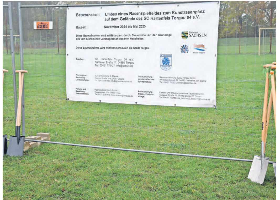
Es war ein langer Weg von den ersten Ideen bis zur Umsetzung: Nun ist der Kunstrasenplatz im Hartenfelsstadion bald Realität.

NEUER KUNSTRASENPLATZ für den SC Hartenfels Torgau 04 im Hartenfelsstadion