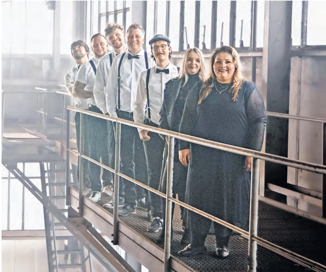
Die Band Major-C aus Döbeln bringt den altherwürdigen Saal des Kulturhauses Torgau in der Silvesternacht zum Beben.

Jetzt Tickets für den JAHRESWECHSEL MIT BUFFET im Kulturhaus Torgau sichern