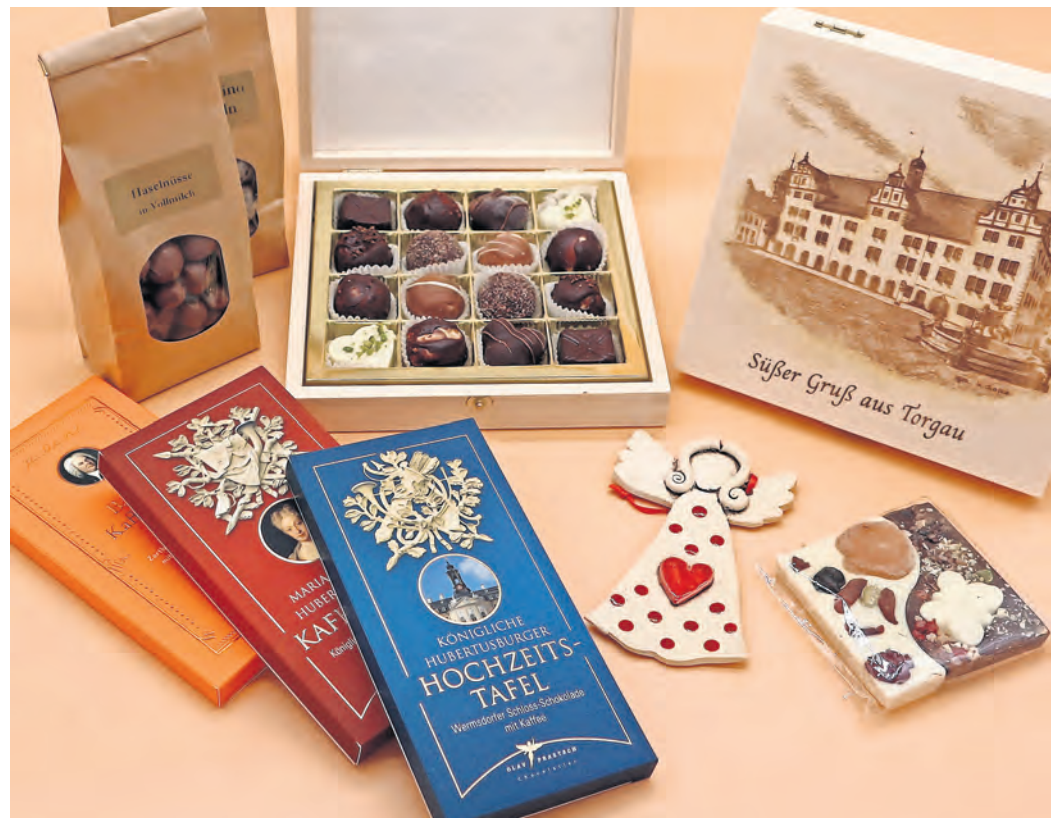
Edle Schokolade in verschiedenen Variationen gehört auf den Gabentisch.

Regionale Produkte aus dem TORGAU SHOP vereinfacht die Suche nach den passenden Geschenken