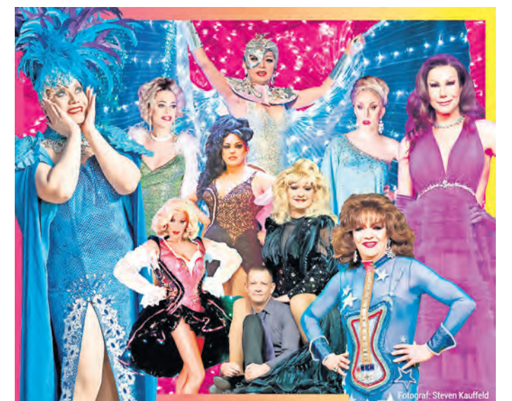
Verführen in eine Welt aus Illusionen und perfekter Täuschung: die Stars der atemberaubenden Revue „Zauber der Travestie – das Original“.

Ob es sich bei den hinreißenden Damen wirklich nur um Männer handelt, das bleibt das wohlgehütete Geheimnis dieser schillernden Show voller Paradiesvögel. Am Samstag, dem 1. März 2025, lautet das Motto für alle Gäste im Kulturhaus Torgau: Einfach zurücklehnen und genießen!