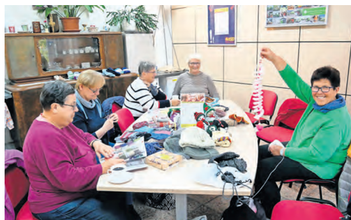
Unterschiedliche Generationen finden einen Anlaufpunkt, da machen die verschiedenen Handarbeiten gleich doppelt Spaß.