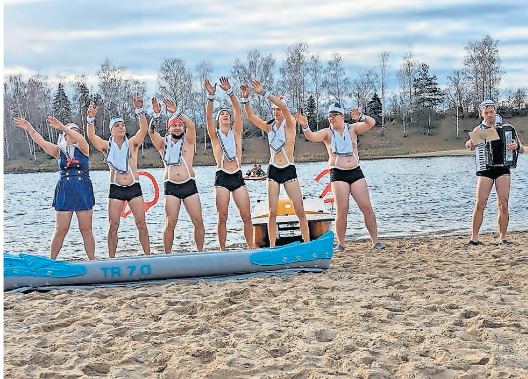
Wie Anfang dieses Jahres können sich die Zuschauer auch am 1. Januar 2025 auf so manche erfrischende Darbietung ab 14 Uhr im Naturbad Luppaa freuen.

RECHTZEITIGES ERSCHEINEN sichert die besten Plätze