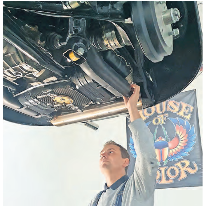
Dieser VW Käfer Cabrio aus dem Jahr 1975 hat seine „Wiedergeburt“ bereits geschafft. Vollständig aufgearbeitet wird er noch einmal final überprüft.

Wer nicht das Glück hat, Fahrzeuggarantien zu erben oder schon zu besitzen, dem hilft der Oschatzer auch gerne bei der Suche nach dem gewünschten Gefährt und berät seine Kunden, damit diese den richtigen Oldtimer finden.