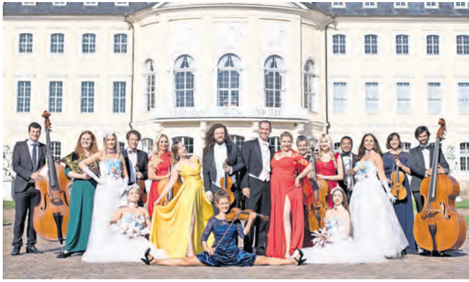
Beschwingter Jahresauftakt: „Die große Johann Strauss Revue“ ist am 4. Januar 2025 im Kulturhaus Torgau zu erleben.

Es erklingen mitreißende, berausende Klänge weltberühmter Walzer, Märsche und Polkas, die unter der virtuos geleiteten Leitung des charismatischen Dirigenten und Stehgeigers