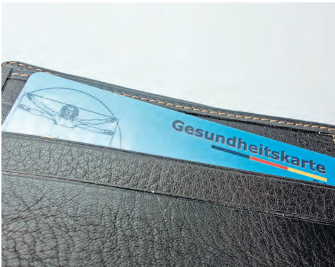
Gilt ab 1. Januar 2025: Sich privat krankenversichern können sich jene, die mehr als 73 800 Euro im Jahr verdienen.

Vom kommenden Jahr an haben Verbraucher einen besseren Überblick über ihre Alterseinkünfte. Bis Ende 2024 müssen bestimmte Altersvorsorgeein-