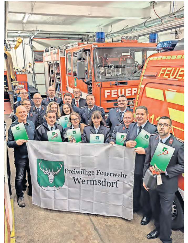
Die Wermisdorfer Wehrleiter konnten zur Jahreshauptversammlung mehrere Freiwillige auszeichnen und befördern.

Dennoch werde es immer schwieriger, den Teil der Gesellschaft anzusprechen, in dem ein nachhaltiger Gewinn für die Feuerwehr sichtbar wird und man neue Mitglieder gewinnen könne. Das habe er deutlich gespürt,