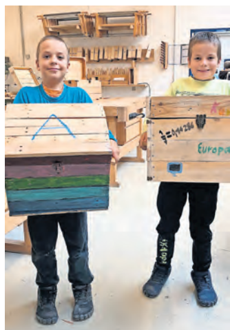
Handwerk live erleben: Innerhalb vorangegangener Schnuppertage wurde in der Offenen Werkstatt in Riesa eine Schatzkiste aus Holz gebastelt.

Er erinnerte daran, dass dieses Ehrenamt für die Gemeinschaft auch von den Angehörigen der Aktiven viel fordert: „Immer wenn wir bei der Feuerwehr sind, bleiben Aufgaben zu Hause liegen.“ Jenetzky dankte deshalb ausdrücklich den Familien, die den Helfern den Rücken freihalten. Genauso dankbar sei er über die Zusammenarbeit mit der Gemeinde, die die Wehren unterstütze und stets für konstruktive Kritik offen sei. Und der Wehrleiter nutzte den Rahmen, um mehrere Kameraden auszuzeichnen und zu befördern. JB