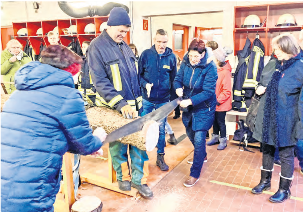
Das Neujahrsbaumsägen ist inzwischen eine schöne Tradition, die großen Zuspruch bei den Dahlenern findet.

KAMERADEN LADEN am 4. Januar ans Feuerwehrgerätehaus