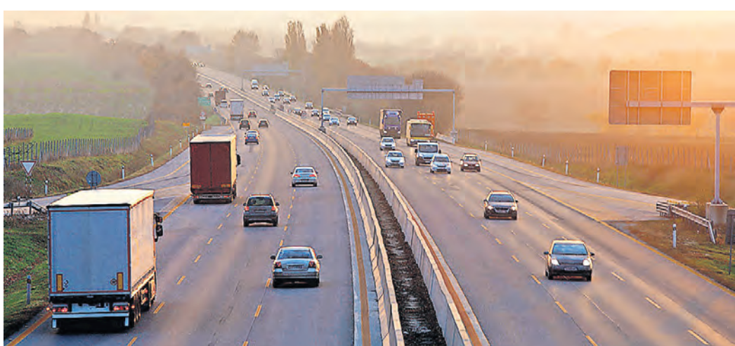
2025 stehen Autofahrern einige wichtige Neuerungen bevor.