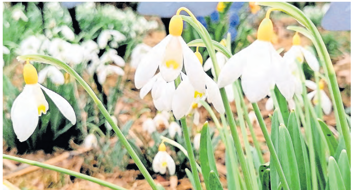
Am 1. und 2. März blüht Torgau auf. Wo? Im Proviantmagazin in der Kurstraße 15 anlässlich der Frühblüher-Ausstellung.

Frühblüher-Ausstellung & Pflanzenverkauf lockt am 1. UND 2. MÄRZ nach Torgau