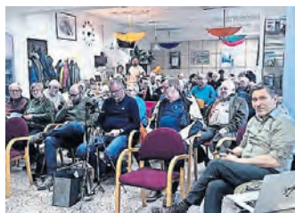
Die Infoveranstaltung war gut besucht.