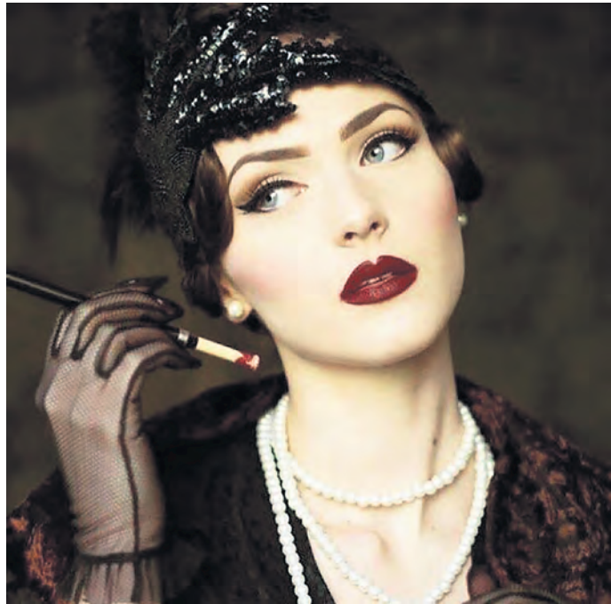
Genuss und Geschichte – Wein, Weib und Wonne heißt es am Frauentag im Stadtmuseum Torgau.

Karten sind an der Museumskasse zu erwerben. Gruppenanmeldungen für zusätzliche Führungen werden vom Museum Torgau separat telefonisch entgegengenommen.