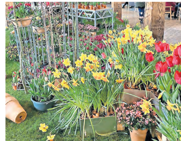
Torgau blüht auf – zumindest am kommenden Wochenende im historischen Proviantmagazin.