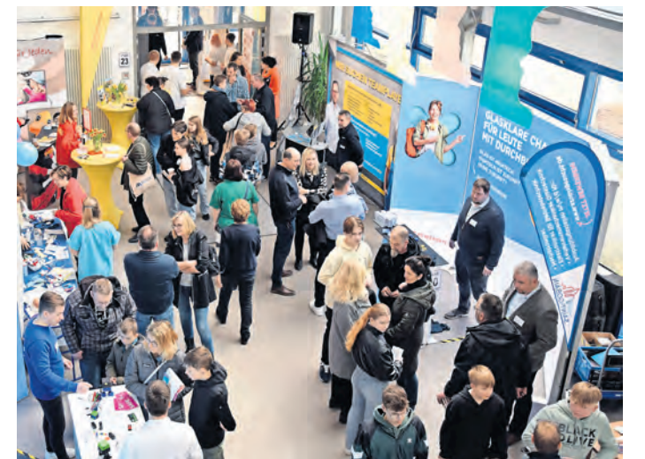
44 Unternehmen aus drei Bundesländern präsentieren ihre Ausbildungs-Möglichkeiten.

Die Arbeitgeber aus unterschiedlichsten Branchen, da-