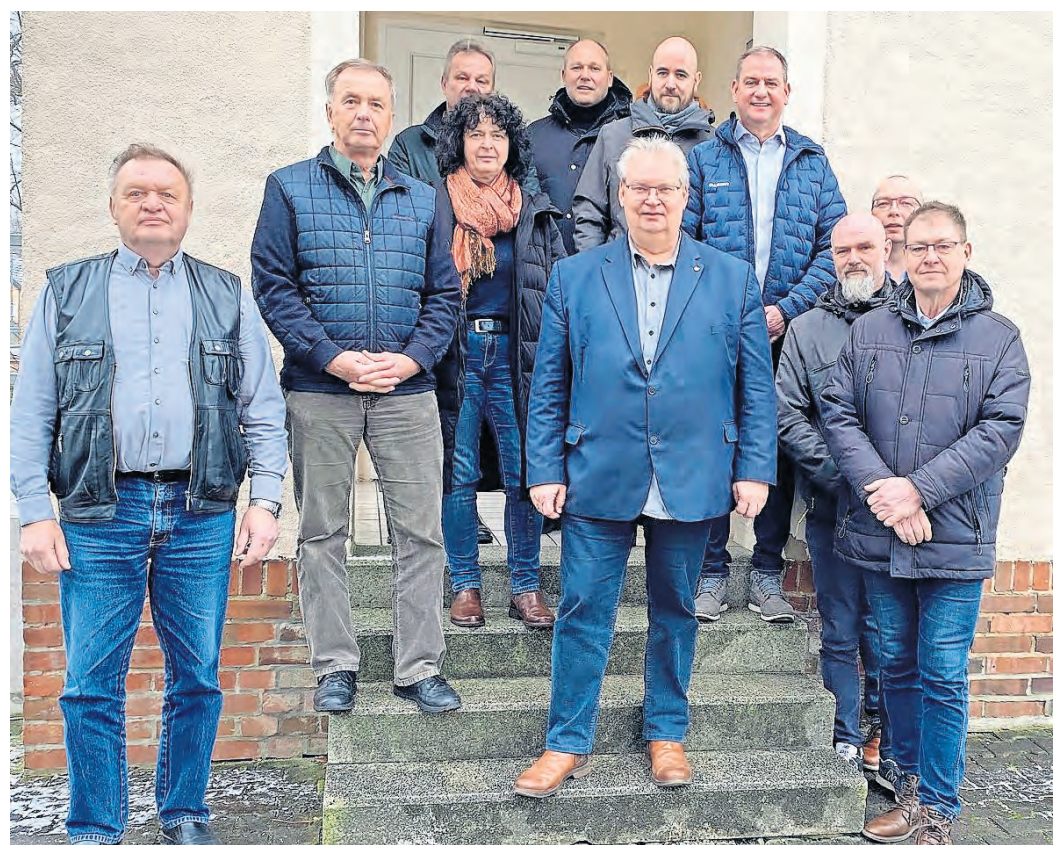
Die Torgauer Elbe-Heide-Land-Bürgermeister mit den DSK-Kollegen Böttcher und Dunger (hinten, rechts) vorm Trossiner Gemeindeamt.