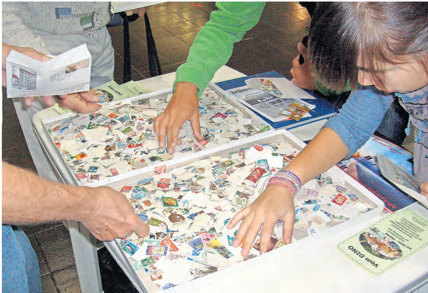
Die Wühlkiste kommt gerade bei jungen Sammlern gut an.

Gute „Tauschgeschäfte“ sind auf Grund der Vorab-Information in der philatelistischen Fach-