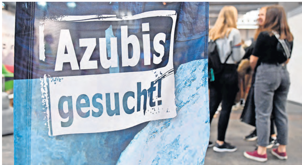
Viele Betriebe suchen Azubis, nicht überall ist die Bezahlung attraktiv.

der Begegnung, der Orientierung und des Austauschs. Ein Gewinnspiel lockt mit wertvollen Preisen, dazu gibt es vier Bewerbungsfotos gratis zum Mitnehmen. Der Eintritt ist frei. SWB