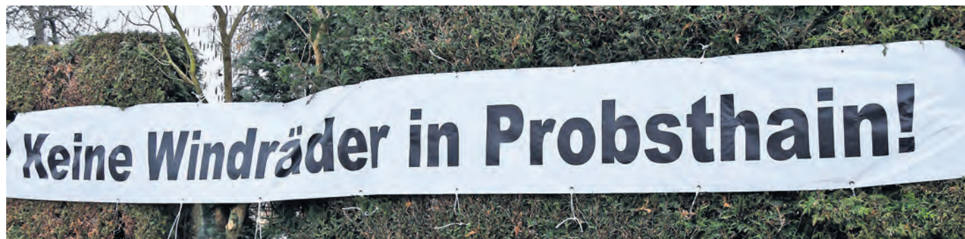
Am Ortseingang von Probsthain wird auf das Thema Windräder hingewiesen.

BEILRODE. Zum 3. Erwachsenen Flohmarkt wird am Sonntag, 6. April, in der Zeit von 9 bis 13 Uhr in die Aula der Grundschule Beilrode (gegenüber der Ostelbienhalle, Einfahrt Nordring) eingeladen. Neben Kleidung und Schuhen, werden Deko- und Haushalts-Artikel sowie Sportartikel, Bücher, DVD's, Schmuck und Handarbeiten angeboten. Auch alles rund ums Hobby finden Interessierte vor. Der Eintritt ist frei und für das leibliche Wohl ist gesorgt. SWB