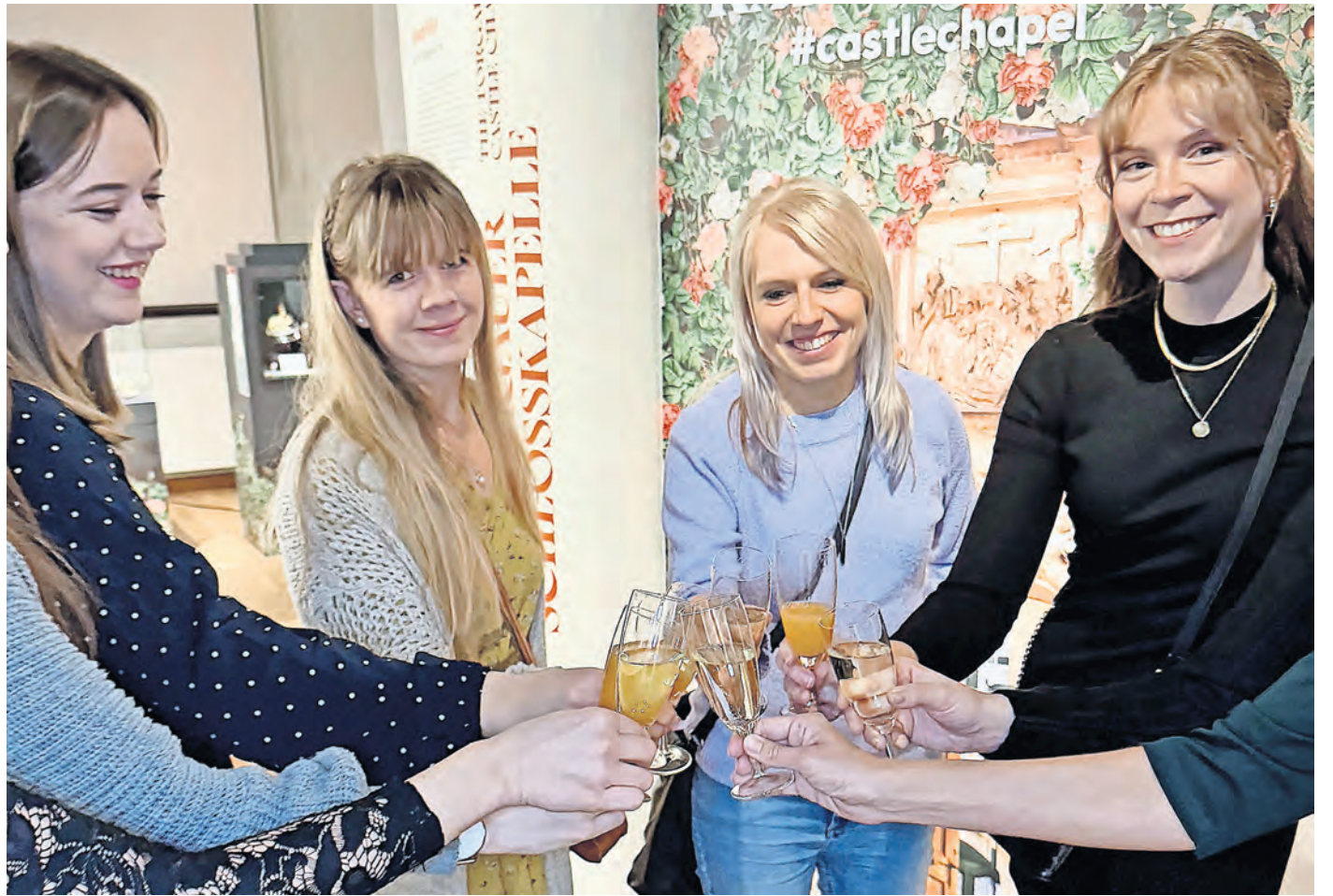
Anstoßen auf den Frauentag: Am 8. März lockt eine Schlossführung mit Sekt.

Eine Anmeldung unter www.schloss-hartenfels.de/veranstaltungen ist unbedingt erforderlich. Der Preis pro Person beträgt 7,50 Euro, ein Glas Sekt inklusive. Treffpunkt zu der einstündigen Führung ist an der Ausstellungskasse im Flügel D.