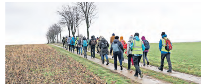
Nach der Lichtmess-Wanderung im Februar werden drei Tage nach Frühlingsanfang in Mügeln erneut die Wanderschuhe geschürft.

ressantes sowie eine Möglichkeit der Besichtigung bis hoch zum Glockenstuhl geben. Nächster Stopp ist an der Sornziger Martin-Luther-Kirche, wo ebenfalls eine Führung angeboten wird.