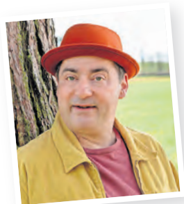
Paula möchte im Jahr 1919 Orgelbauerin werden. Wie sie dem Gegenwind trotzt, erzählt Martin Meyer in "Die Orgelbauerin".