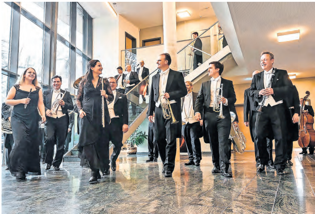
Mit "Opera Appassionata" ist das Konzertprogramm überschrieben, das die Sächsische Bläserphilharmonie am 30. März in Oschatz zu Gehör bringen wird.

SÄCHSISCHE BLÄSERPHILHARMONIE sorgt am 30. März für Gänsehautmomente