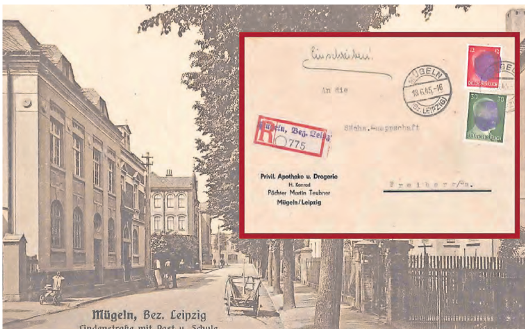
Not macht(e) erfinderisch: Weil es 1945 nach Kriegsende keine neuen Briefmarken gab, wurden die noch vorhandenen der alten Machthaber kurzerhand geschwärzt.