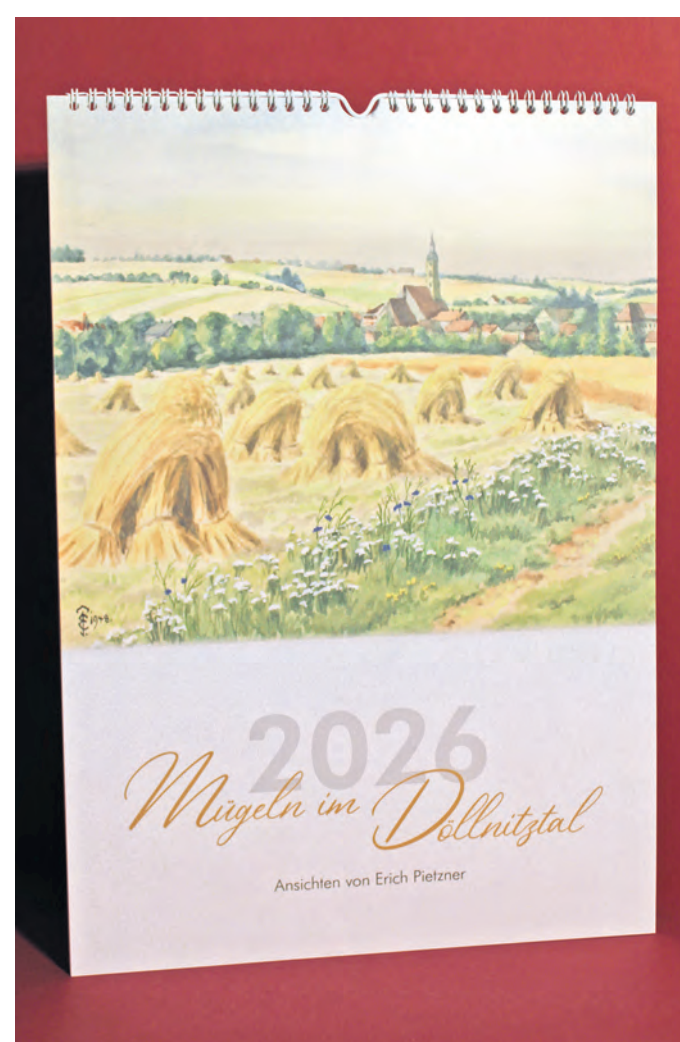
Der erste Kalender mit Motiven des Hobbymalers Erich Pietzner für das Kalenderjahr 2026 kann nach dem Heimat-Stammtisch erworben werden.

rausgesucht. Mit dem vorliegenden Exemplar beginnt somit eine kleine Galerie im A-3-Format, die sich jeder im Anschluss an den Heimat-Stammtisch für 15 Euro mit nach Hause nehmen kann. Außerdem ist es möglich, die Kalender direkt über die Heimatvereine Mügeln und Sorzig zu beziehen.