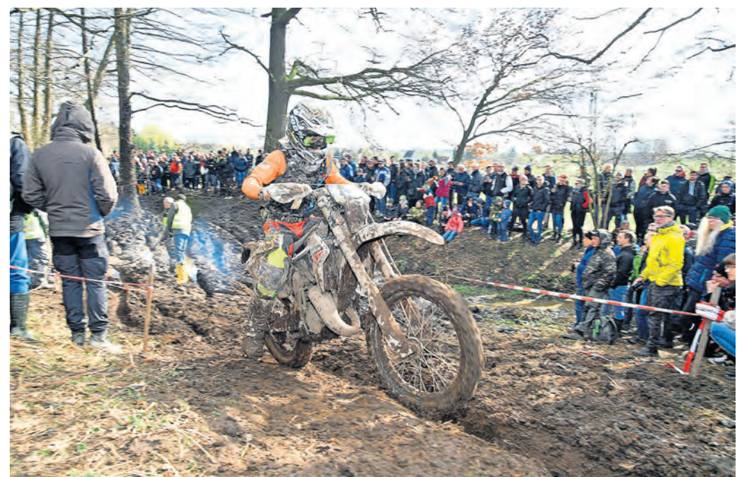
An diesem Wochenende gibt es in und um Dahlen jede Menge Rennaction.

Der Eintritt kostet pro Person 5 Euro, Kinder bis 14 Jahre sind davon ausgenommen. Der Preis für das Programmheft beträgt ebenfalls 5 Euro. Weitere Infos gibt es unter www.msc-dahlen.de .