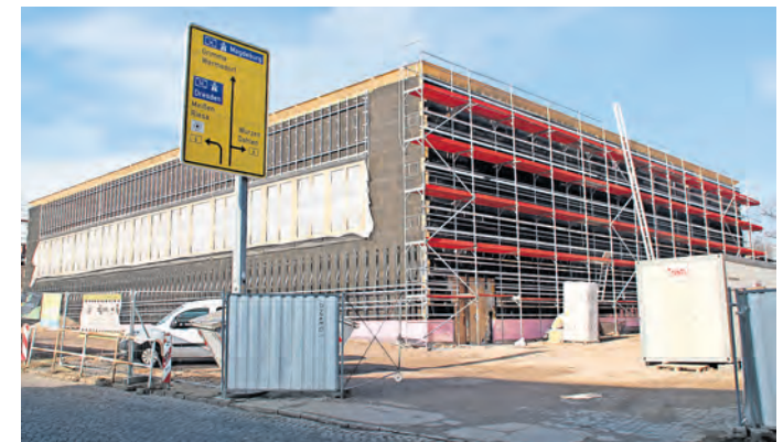
Der Bau der neuen Sporthalle in Oschatz macht Fortschritte, jüngst wurde die Außendämmung angebracht.

FRIST FÜR DIE ABGABE von Namensvorschlägen läuft Ende April aus