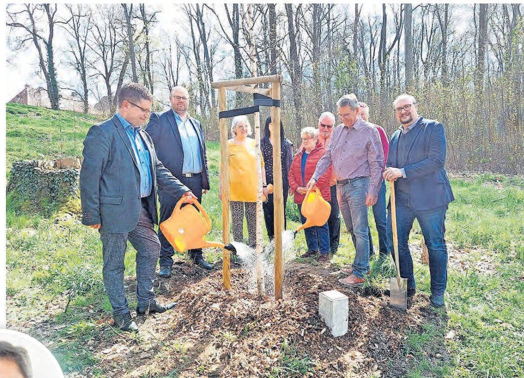
Jedes Jahr pflanzen die Mitglieder des Fördervereins Landesgartenschau Oschatz 2006 einen Baum des Jahres. Im vergangenen Jahr war dies eine Moorbirke, die seitdem im Stadtpark heranwächst. Ende April könnte sich eine Roteiche hinzugesellen. Allerdings ist die Standortfrage noch nicht abschließend geklärt.

Rosen sind besonders arbeitsintensiv und deshalb haben wir diese Aufgabe im O-Schatz-Park übernommen.