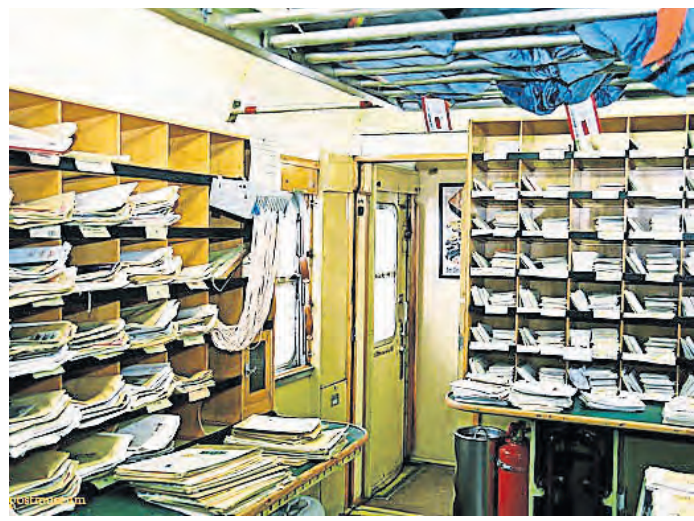
Blick in einen Bahnpostwagen.

Die Bahnpost in Deutschland trat an die Stelle der Beförderung