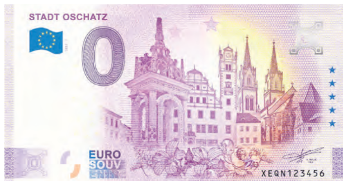
In der Oschatz-Information gibt es 0-Euro-Scheine als Mitbringsel zu kaufen.

Klingt erst mal nach einem schlechten Geschäft – zwei Euro für einen 0-Euro-Schein – das ist es aber nicht. Denn das Motiv des Scheines ist sein Geld wert: Für die Vorderseite wurde die Marktsilhouette mit Blick auf das Rathaus und die St.-Aegidien-Kirche gewählt. Und die Rückseite zieren, wie bei allen erhältlichen 0-Euro-Scheinen, sechs berühmte europäische Se-