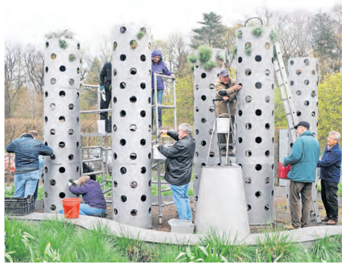
Die Bepflanzung des oberen Bereichs des Vertikalen Gartens erweist sich zunehmend als echte Herausforderung. Deshalb sollen die schwer erreichbaren Pflanzlöcher mit ausdauerndem Grün „bestückt“ werden

Es wird eine Roteiche sein, ein klimaresistenter Baum, der schon seit dem 17. Jahrhundert in Europa anzutreffen ist. Der Termin für die Pflanzung steht schon fest. Es ist der 25. April. Den künftigen Standort werden wir noch mit der Stadtgärtnerei absprechen. Im letzten Jahr haben wir im Stadtpark gegenüber der Collm-Klinik den Baum des Jahres gepflanzt. Da würde sicherlich auch die Roteiche gut hinpassen, zumal in der jüngeren Vergangenheit dort mehrere große Bäume entnommen werden mussten.