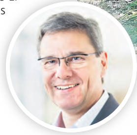
Frank Kupfer, Mitglied im Förderverein Landesgartenschau Oschatz 2006.

OSCHATZ. Anfang der 2000er-Jahre brachte ein großartiges Vorhaben Oschatzer Bürgerinnen und Bürger sowie Firmen zusammen: die Döllnitzstadt als Gastgeberin der Landesgartenschau 2006. Dieses Engagement trug ganz erheblich zum Gelingen der vierten derartigen Veranstaltung in Sachsen bei. Doch während die Tage des Blütenzaubers seinerzeit gezählt waren, trug der ehrenamtliche Elan auch noch darüber hinaus Früchte. Vereint im Förderverein Landesgartenschau 2006 sind die Garten- und Landschaftsbau-Enthusiasten in erheblichem Maße daran beteiligt, dass es bis in die Gegenwart westlich der Freiherr-vom-Stein-Promenade talaufwärts grünt und blüht und dort mit den „Kleinen Gartenschauen“ die Erinnerung an das Großereignis lebendig gehalten wird. Im nächsten Jahr soll es die vierte Auflage geben, wieder unter der Schirmherrschaft von Frank Kupfer, des ehemaligen sächsischen Landwirtschaftsministers, der an diesem Samstag, dem 29. März, gemeinsam mit seinen Vereinsfreunden und weiteren Freiwilligen traditionell den Rosen im O-Schatz-Park zu einem perfekten Start in die neue Blühsaison verhilft - für das SonntagsWochenblatt Anlass, einige Fragen an Frank Kupfer zu richten.