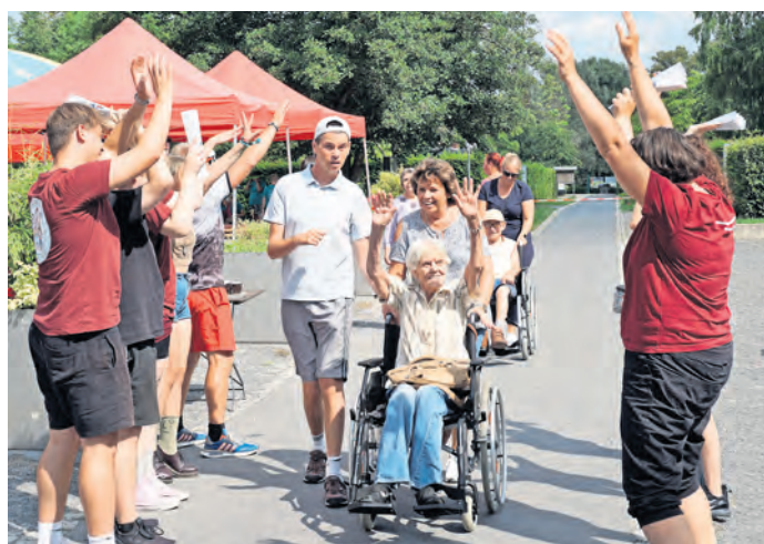
Ob zu Fuß oder im Rollstuhl – beim Inklusionslauf in Oschatz gehen die Teilnehmerinnen und Teilnehmer gemeinsam für die gute Sache auf die Strecke.

Im vergangenen Jahr legten die Teilnehmenden zusammen 5382 Runden zurück – das entspricht 3229 Kilometern. „Diese Zahlen stehen sinnbildlich für