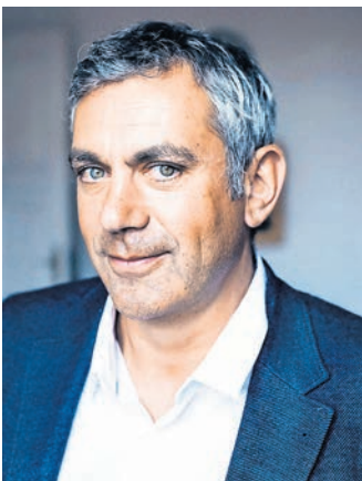
Der Berliner Schriftsteller Vladimir Kaminer.

Wenige schottische Bands hatten einen vergleichbaren Erfolg oder einen ähnlich einprägsamen Sound – und mehr erfolgreiche Alben und Single-Hits. „In a big country“, „Look away“, „Fields of Fire“, „Chance“,