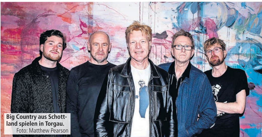
Big Country aus Schottland spielen in Torgau.

„Wonderland“ – um nur einige zu nennen haben sich in die Herzen Millionen von Fans eingebrannt. Natürlich schätzt man bei BIG COUNTRY die hymnischen Melodien und den kompakten Band-Sound, der heute immer noch von Gründungs-Gitarri Bruce Watson und seiner Band garantiert wird. Als Support treten PISTOL DAISYS auf. Am Samstag, 1. November, gastieren ab 20 Uhr GURU in Torgau. Die legendäre Band mit weit über 80 noch immer auf Tour – ein Wahnsinn für die ganze Familie. Ein weiterer Weg liegt hinter ihr: aus den tiefsten Tiefen des UNDER-