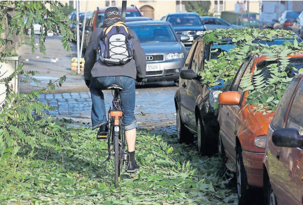
Fahrt durchs Gruene - Kontraste im Herbst: Entweder die Blätter besitzen ihre wunderschöne Färbung oder sie fallen durch ersten leichten Nacht- bzw. Morgenfroste grün von den Bäumen. Gesehen in der Hans-Poeche-Strasse. Rutschgefahr besteht fuer den Radfahrer.

Schlechte Sicht entsteht auch, wenn Autofahrer durch einen tiefen Sonnenstand und nasse Fahrbahnen geblendet werden. Experte Kubin rät: „Der tiefe Sonnenstand kann mitunter sehr blenden. Daher sollte die Frontscheibe von innen gereinigt werden, was die Blendwirkung der Sonne deutlich reduziert. Eingeschaltetes Abblendlicht erhöht die eigene Sicht und auch die Sichtbarkeit für andere Verkehrsteilnehmer. Generell ist die Herbstzeit die perfekte Gelegenheit, um alle Leuchten am Fahrzeug zu prüfen und auch um schmierende Wischerblätter auszutauschen. Freie Sicht ist einfach das A und O.“ SWB