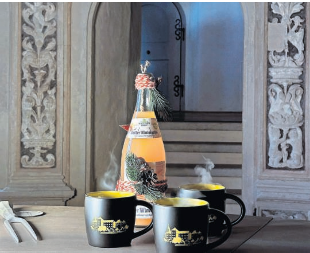
Für die Glühweinführungen steht auch eine alkoholfreie Punsch-Variante bereit.

☐ Die Öffnungszeiten des Schlossweihnachtsmarktes und das Begleitprogramm sind auf der Webseite der Stadt Torgau www.torgau.eu zu finden.