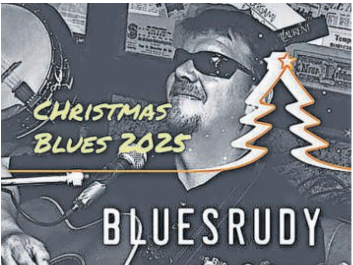
Blues Rudy ist einer der hochdekorierten Musiker.

Weihnachtskonzert am JOHANN-WALTER-GYMNASIUM TORGAU