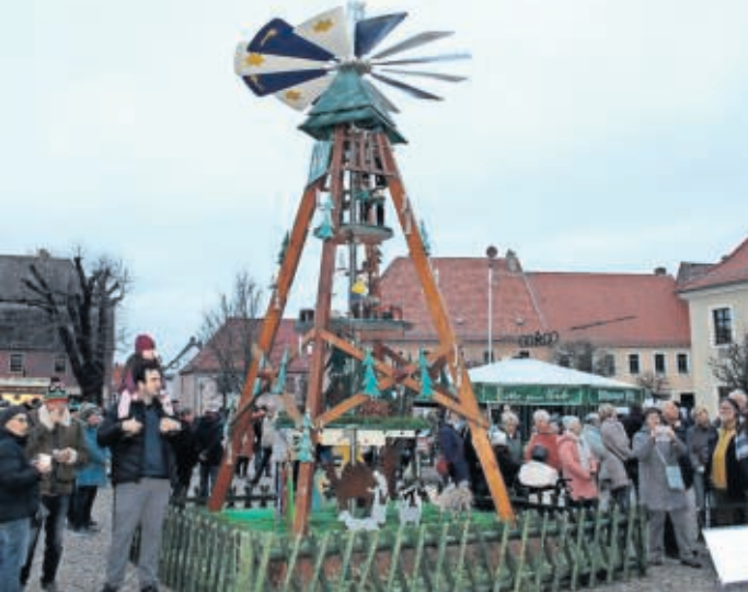
Zum 25. Mal wurde die Pyramide angeschoben.

BELGERN. Am Samstag der vergangenen Woche erlebte das kleine Belgern einen großen Ansturm: Die Veranstaltung Advent in den Höfen erwies sich erneut als ein Publikumsmagnet. Die Gäste aus Nah und Fern fluteten die Rolandstadt – Tausende wollten sich das weihnachtliche Flair der offenen Höfe und Institutionen nicht entgehen lassen. In gewohnter Manier war die Innenstadt mit natürlichen Materialien geschmückt, das gedämpfte Licht tat sein Übriges. Der SV Roland Belgern schon auf dem Marktplatz zum 25. Mal die Pyramide an. An diesem Samstag, 6. Dezember, lockt ab 14 Uhr der 33. Weihnachtsmarkt erneut nach Belgern. SWB