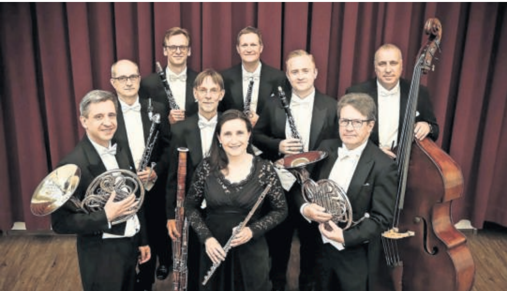
Die Serenadenbesetzung der Sächsischen Bläserphilharmonie spielt am 13. Dezember im Kulturhaus Torgau.

Musikalisch begleitet von der Serenadenbesetzung der Sächsischen Bläserphilharmonie wird die Geschichte von Fritz, Marie, dem gefährlichen Mäusekönig, den Zuckerkuchenfeen