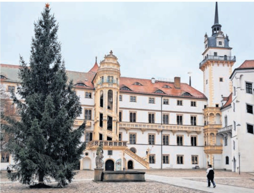
Noch ist der Hof von Schloss Hartenfels verwaist, das wird sich am kommenden Wochenende ändern. Die zwölf Meter hohe Fichte bringt weihnachtlichen Glanz auf Schlosshof, ist auf einem Privatgrundstück in Gräfendorf gewachsen und wird noch geschmückt.

Beide Märkte bestechen mit Vielfalt und ergänzen sich wunderbar. Los geht es am Freitag, 12. Dezember, ab 17 Uhr auf der historischen Kleinbühne mit dem Auftritt der Zauberkinder aus der Kita Kinderland Beckwitz. Höhepunkt ist um 19.30 Uhr das Weihnachtskonzert im Rahmen der Torgauer Rathauskonzerte in der Schlosskirche: Das Streichquartett Bulsara Strings lässt das altehrwürdige Gemäuer erklingen. Der Samstag beginnt um 14 Uhr mit weihnachtlichen Bläserklängen der Kreismusikschule „Heinrich Schütz“ am Großen Wendelstein. Weitere Höhepunkte mit Bläserklängen im Lapidarium, dem Cellotrio in der Schlosskirche, Kindertanzgruppen der Volkshochschule oder einer Taschenlampenführung für Kinder folgen. Ab 17 Uhr lädt der Chor der Johann-Walter-Kantorei zum Adventsingen in die Schlosskirche. Am Sonntag