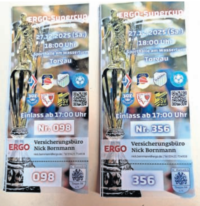
Die Tickets sind schon erhältlich.

Im fairen Wettstreit stehen sich der gastgebende SCH 04, Elbbaue Torgau, Stahl Riesa, TSV 1862 Schildau, Blau-Weiß Wermisdorf, Wacker Dahleu, FSV Beilrode 09 und Radefelders SV gegenüber. Karten gibt es im Vorverkauf im Versicherungsbüro Nick Bornmann (Leipziger Straße 42), in der Rechtswaldkanzlei Diana Krause & Koll (Scheffelstraße 6), bei Kopier Torgau (Spitalstraße 29) und auf der Geschäftsstelle des Hartenfeldstadions (Montag, Mittwoch, Freitag von 8 bis 12 Uhr) sowie zu den Heimspielen des SC Hartenfelds Torgau zu erwerben – natürlich auch an der Abendkasse. SWB