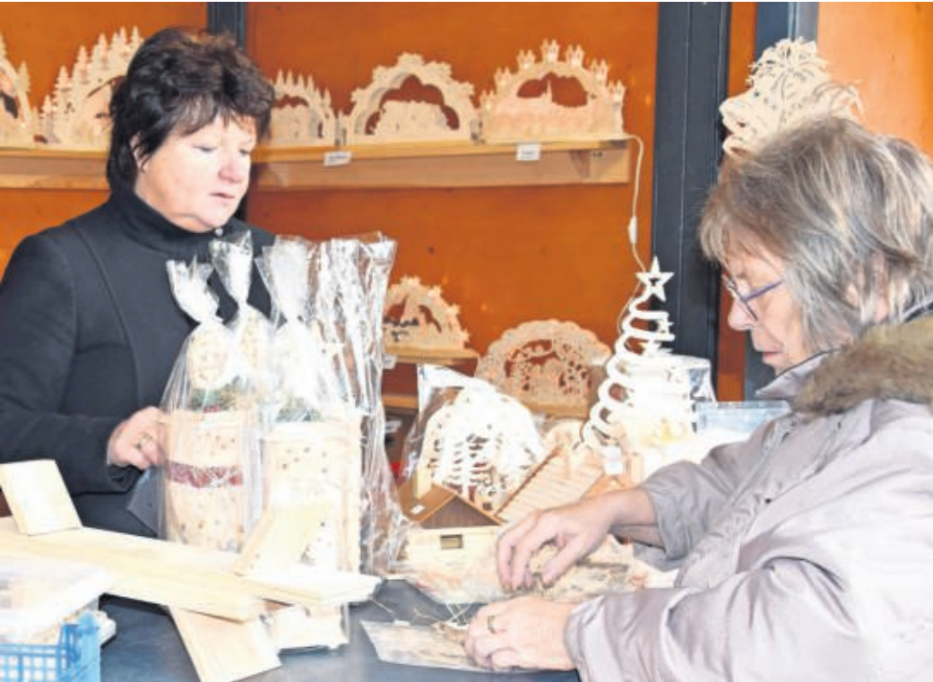
Gut besucht ist das Weihnachtsbüdchen an der JVA Torgau, letztmalig ist es am Donnerstag, 11. Dezember, von 14 bis 18 Uhr geöffnet.

Letztmalig öffnet das Weihnachtsbüdchen an der JVA Torgau übrigens am Donnerstag, 11. Dezember, in der Zeit von 14 bis 18 Uhr.