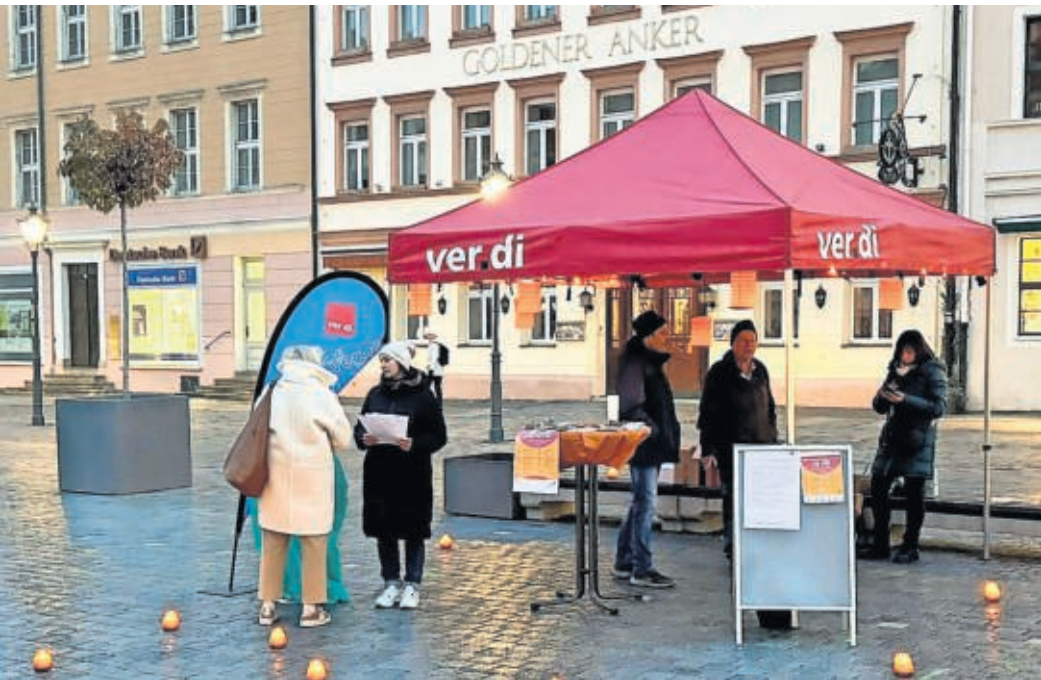
Die Ver.di Ortsgruppe Torgau wies auf den Orange Day 2025 hin.

Das Gewaltspektrum gegen Frauen und Mädchen reicht von Beleidigungen, häuslicher und sexualisierter Gewalt, digitaler Gewalt gegen Frauen bis hin zum Mord. Bei Delikten der häuslichen Gewalt sind die Opfer mit 70,4 Prozent überwiegend weiblich. Im Jahr 2024 wurden 187 128 Frauen als Opfer häuslicher Gewalt registriert, was einem Anstieg von 3,5 Prozent im Vergleich zum Vorjahr