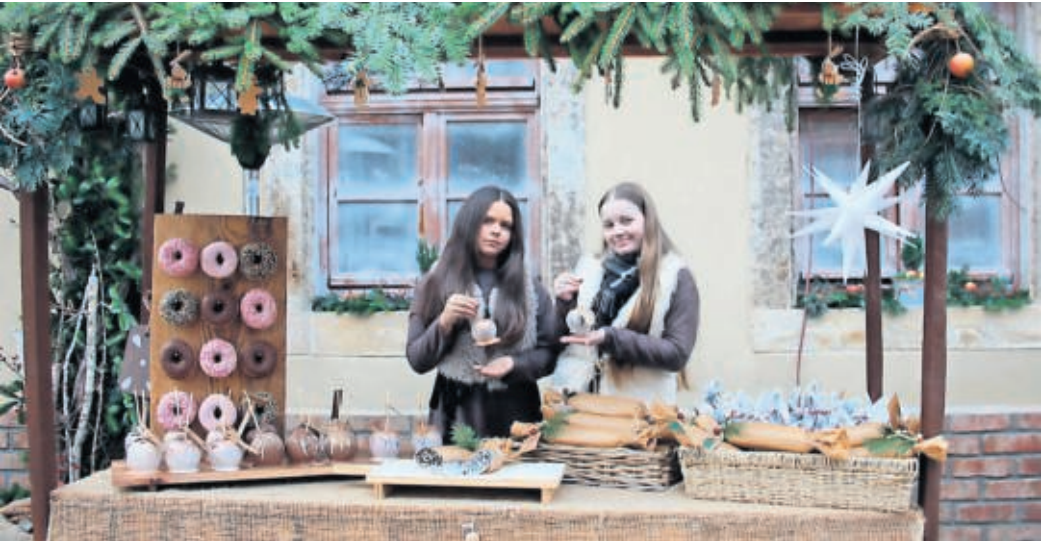
Die teilnehmenden Höfe hatten sich wieder eine Menge einfallen lassen, um die Besucherinnen und Besucher zu verwöhnen.

Zum 14. Mal lockte die Rolandstadt mit ADVENT IN DEN HÖFEN