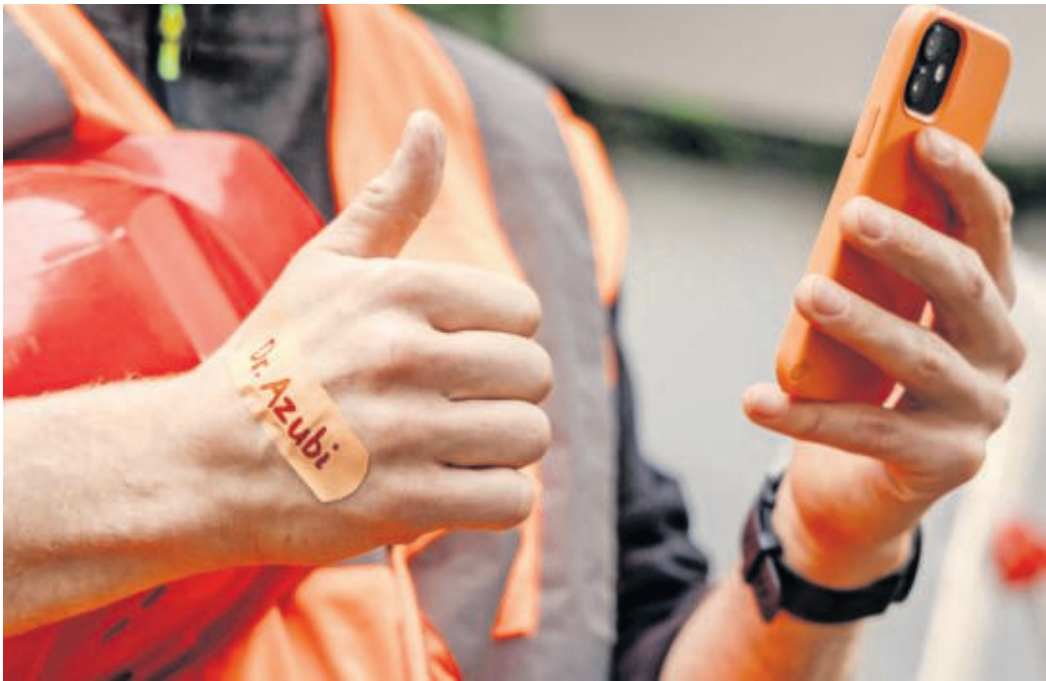
Klebt so manches „Azubi-Trostpflaster“: „Dr. Azubi“ gibt wichtige Tipps.

Der „Azubi-Service“ des Deutschen Gewerkschaftsbundes (DGB) bietet eine „24/7-Sprechstunde“ – egal, für welche Fragen: „Passt das Geld, das die Firma im Kreis Nordsachsen für die Ausbildung bezahlt? Was ist mit Überstunden und Urlaub? Was sollten Azubis machen,