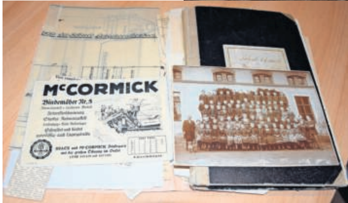
Neben den handschriftlichen Schilderungen enthält die Chronik auch Fotos, Zeitungsausschnitte und Werbung.

Für Detlef Bölke war die Übergabe der Chronik wie ein vorgezogenes Weihnachtsgeschenk. Bölke ging selbst noch acht Jahre, bis 1969, in Langenreichenbach zur Schule. Das ehemalige Rittergut Zech beherrschte bis 1975 die Schule, wo bis zu 120 Schüler in acht Klassen das Einmaleins und Lesen lernten. Nach der Schließung