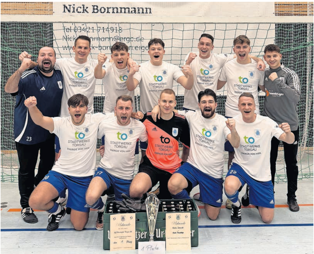
So sehen Sieger aus! Der gastgebende SC Hartenfels Torgau 04 bejubelte vor Jahresfrist den Gewinn des Supercups.