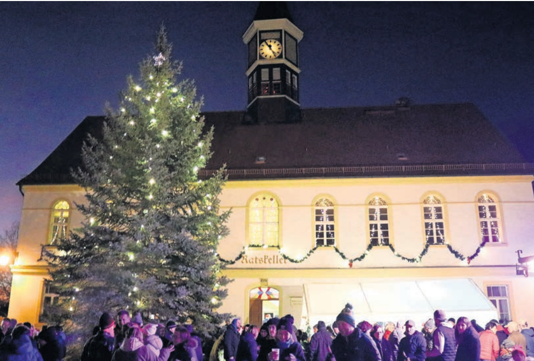
Prall gefüllt ist der Marktplatz in Schildau, wenn gemeinsam gesungen wird.

FASCHINGS-CLUB SCHILDAU hat die Stimmen gut „geölt“