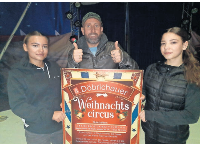
Fernando Richter ist Veranstalter.

Karten können per Telefon unter 0180 5009691, oder per E-Mail info@welt-der-reptilien-zoo.de und über die Ticketgalerie im Internet bestellt werden. Es wird eine Tageskasse geben.