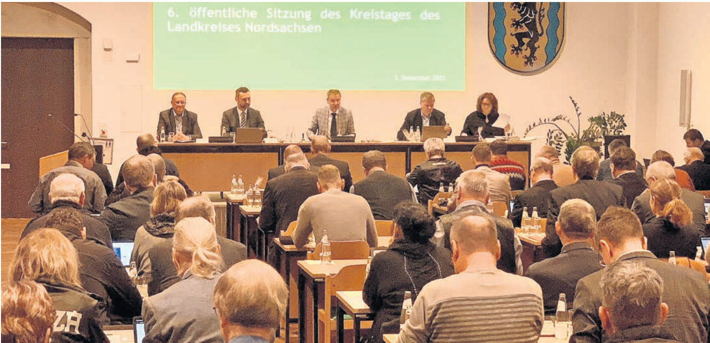
Ein Blick in die Kreistagssitzung am 3. Dezember 2025 auf Schloss Hartenfels in Torgau.

PLAN SOLL ÜBERARBEITET WERDEN und im März 2026 beschlossen werden