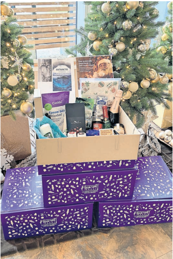
Blick in das Heimatpaket 2025 – das ist alles drin.

Reingeschaut: HEIMATPAKET vereint sächsische Genüsse und Handwerkskunst