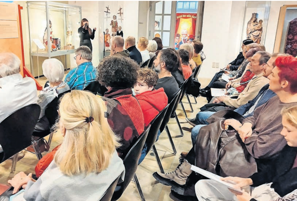
70 Interessenten kamen zur Eröffnung der neuen Sonderausstellung.

TORGAU. Mit viel Andrang und leuchtenden Augen wurde die neue Sonderausstellung „Tri tra trullala – Treffen der Kasperpuppen in Torgau“ im städtischen Museum eröffnet. Vier Puppenspieler, ein ehemaliger professioneller Puppengestalter und 80 junge Kreative aus Torgau prägen die Ausstellung, die bis Mitte April 2026 zu sehen sein wird. Neben der Vorstellung der Puppenspieler sind unterschiedliche Kasperpuppen aus mehreren Jahrzehnten und von verschiedenen Puppenbühnen zu bestaunen. Figuren aus dem tapferen Schneiderlein treffen