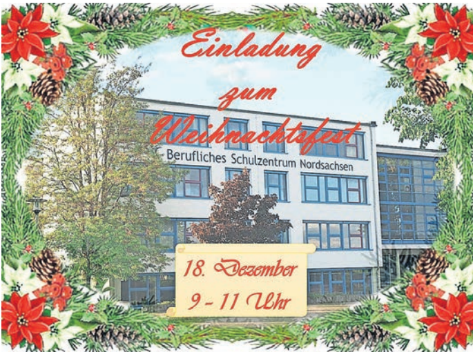
Weihnachtliche Leckereien und Mehr im BSZ.

WEIHNACHTSZAUBER am Beruflichen Schulzentrum Torgau AM 18. DEZEMBER