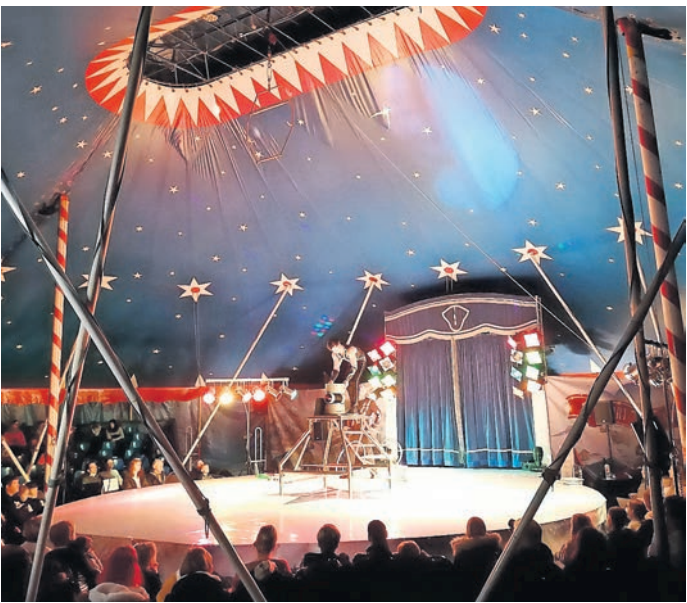
Akrobatik der Spitzenklasse in Döbrichau.