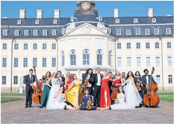
„Die Große Johann Strauss Revue“ möchte ihr Publikum in Torgau begeistern.

DIE GROßE JOHANN STRAUSS REVUE ist am 31. Januar 2026 im Kulturhaus Torgau zu erleben – Jetzt Karten sichern!