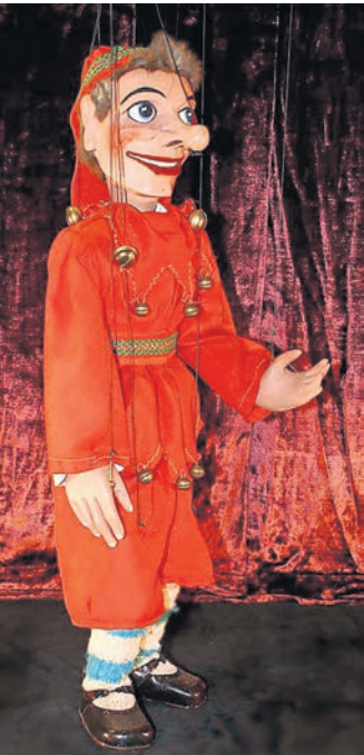
Natürlich sind Kasperpuppen Teil der Ausstellung.

Sonderausstellung „TRI TRA TRULLALA“ im Stadtmuseum Torgau