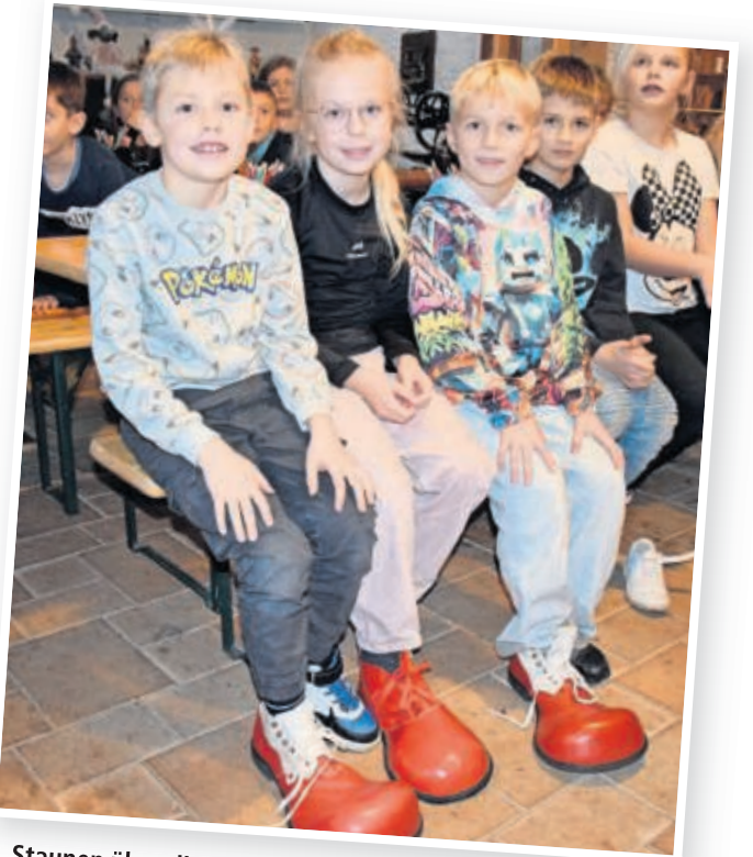
Staunen über die schiere Größe eines Clownschuhs.