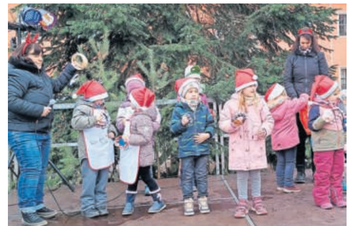
Die Kinder der örtlichen Einrichtungen gestalten maßgeblich das Programm mit.

BELGERN. Die Advents- und Weihnachtszeit hat in der Rolandstadt Belgern scheinbar eine große Bedeutung, wie liebevoll gestaltete Veranstaltungen belegen. Am Vorabend des ersten Advents lockte der alljährliche Hit schlechthin: Advent in den Höfen hieß es zum 14. Mal und Tausende Besucher strömten nach Belgern, um sich vom Weihnachtszauber einnehmen zu lassen. Am Nikolaustag zeigten die Teilnehmer die ganze Bandbreite der örtlichen Kultur und Kulinarik zur 33. Auflage des Weihnachtsmarktes – die Besucher dankten es mit zahlreichem Erscheinen.