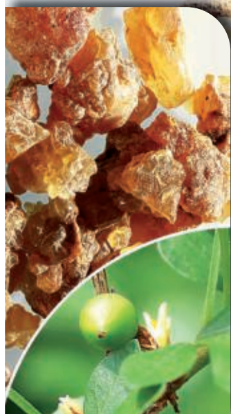
Myrrhe: bewährte Arzneipflanze gegen vielfältige Darmbeschwerden.

Von biblischer Mystik zu etabliertem Arzneimittel: heilendes Myrrhenharz (mit KI generiert)