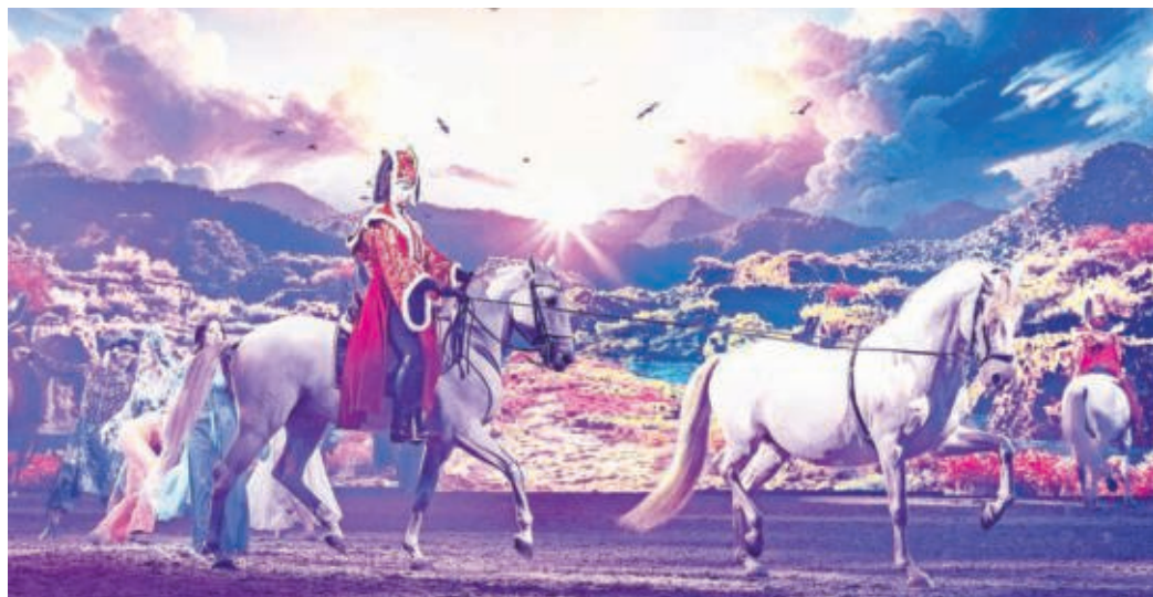
Pferdeshow „Cavalluna - Tor zur Anderswelt“ gastiert am 3. und 4. Januar 2026 in Leipzig.

gemeinsam mit einer hochkarätigen Tanzkompanie, emotionaler Musik und beeindruckenden Licht- und Spezialeffekten. Die Show ist ein Feuerwerk der Emotionen, das Groß und Klein fasziniert, berührt und zum Staunen bringt! Eine mystische Reise der Erkenntnis, die seit Oktober 2025 das Publikum in geheimnisvolle Welten eintauchen lässt und eine magisch-fantastische Geschichte erzählt. Die rund 500.000 Zuschauer, die auf der achtmonatigen Tour erwartet werden, dürfen sich auf grandiose Showeffekte, mitreißende Choreografien und vor allem 56 wunderschöne Pferde freuen. Jung und Alt werden für zwei Stunden von überirdischen Wesen und einem herzergreifenden Abenteuer verzaubert. Erzählt wird in „Tor zur Anderswelt“ die mystische Geschichte der jungen Zauberin Meerin, die über die magische Gabe verfügt, ihre