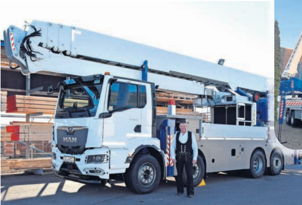
Dachdeckermeister Maik Pötzsch vor seiner neuesten Anschaffung.

Feuertaufe bestanden! Am vergangenen Mittwoch wurden an der Dautschener Kirche die Möglichkeiten probiert.