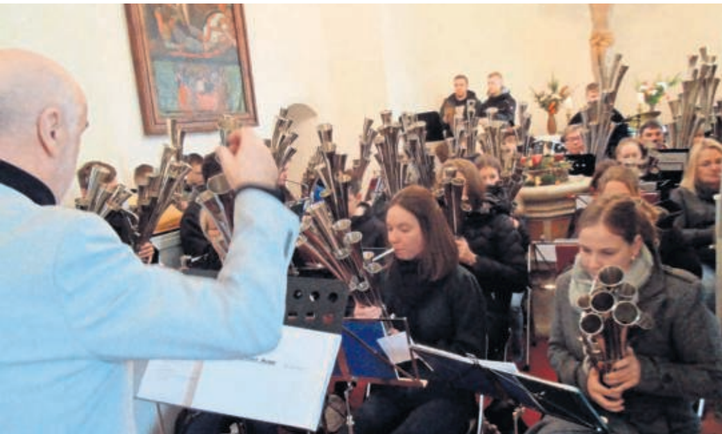
Die Schalmeynstrumentanten gestalten in Langenreichenbach einen Festgottesdienst anlässlich des Weihnachtsmarktes.

EHRENAMTLICHES ENGAGEMENT wird in Langenreichenbach gewürdigt