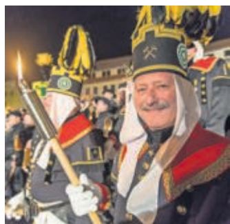
Bergparade auf dem Freiburger Christmarkt.

DEM BERGBAU VERDANKT DER FREISTAAT auch ein Unesco-Welterbe