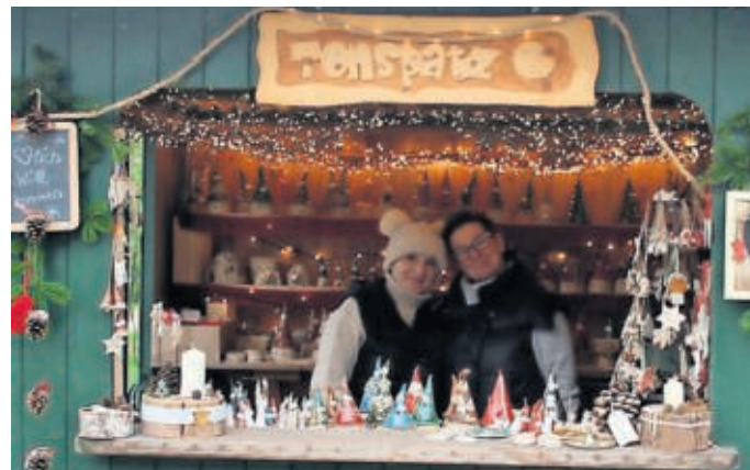
Advent in den Höfen lebt von den Belgeranern selbst, die ihre Höfe öffnen und sich etwas einfallen lassen.

Viele ziehen in Belgern an einem Strang, um zum Gelingen der Veranstaltungen beizutragen.