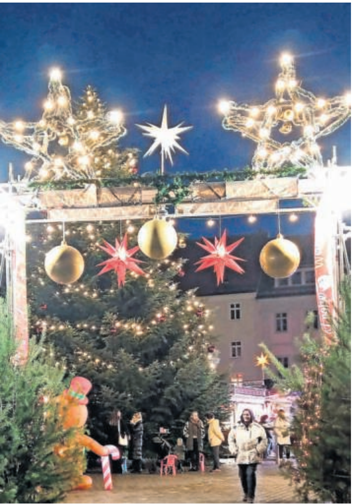
Ob Dornröschens Schlossweihnacht oder Torgauer Marktweihnacht: Das Wochenende vom 12. bis 14. Dezember bewies, wie sich beide Veranstaltungen ergänzen und bereichern.

Hat TORGAU in Sachen Weihnachtsmarkt den Stein der Weisen gefunden?