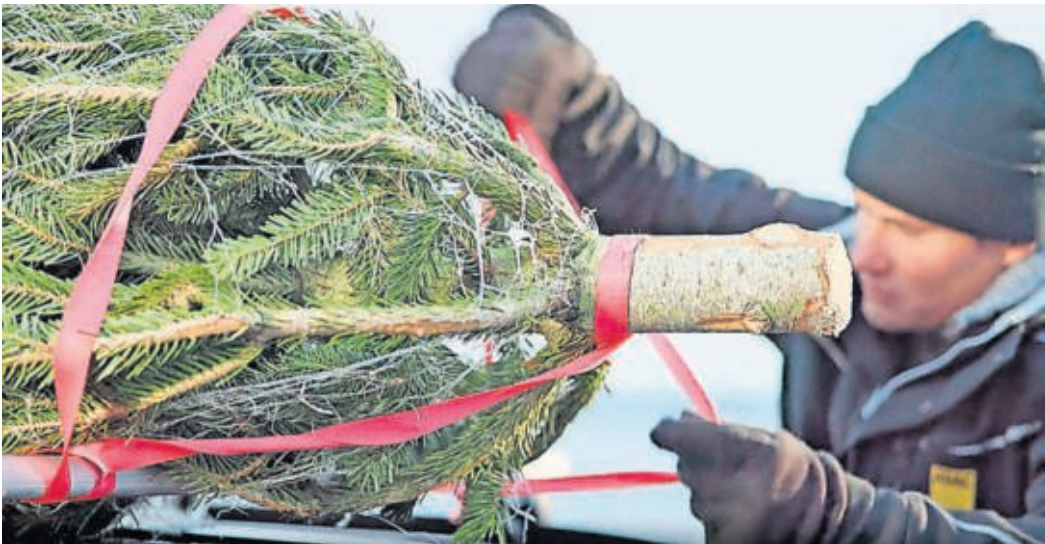
Das richtige Sichern des Baums auf dem Dachträger erspart Ärger und Kosten.

ADAC Sachsen gibt WERTVOLLE TIPPS und hilft Kratzer und Bußgelder zu vermeiden