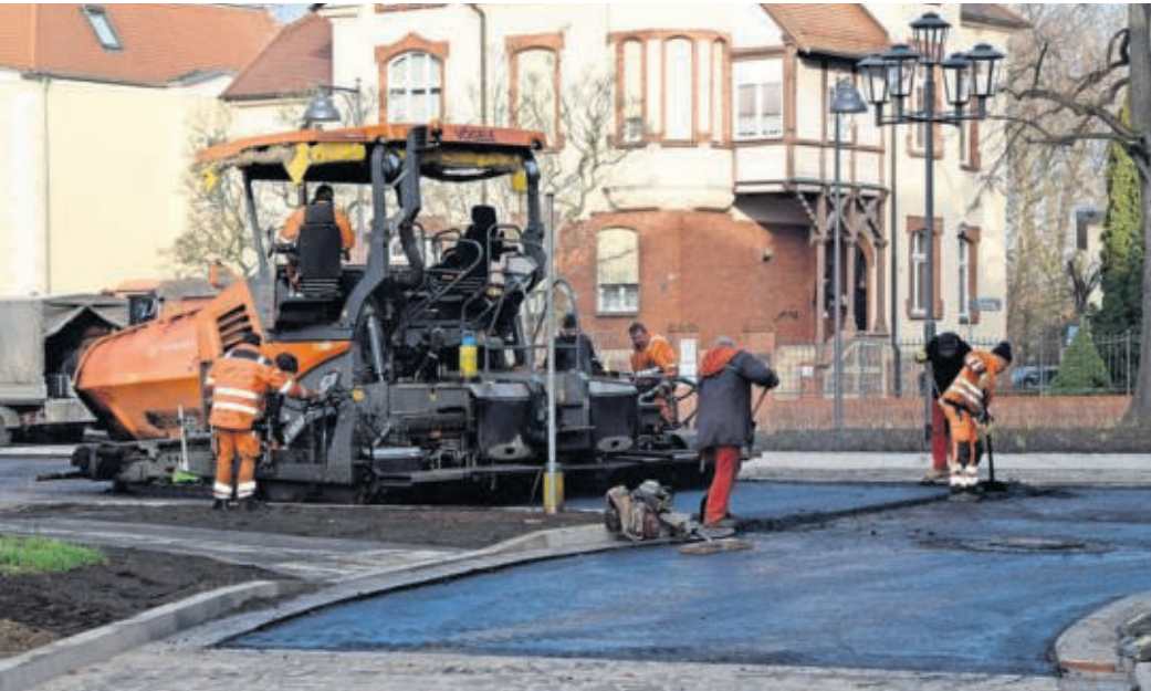
Der Kreisverkehr in der Torgauer Bahnhofstraße entschärft einen Unfall-Schwerpunkt. Mehrere Straßen treffen hier aufeinander.

KREISVERKEHR IN TORGAU wird am 19. Dezember übergeben