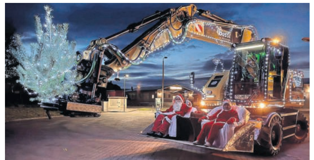
In Belgern gibt es den Weihnachtsmann im Doppelpack und auf einem nichtalltäglichen Gefährt.