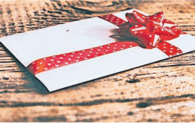
Gutscheine gewinnen als Geschenk mehr und mehr an Bedeutung.

Gutscheine sind nach deutschem Recht drei Jahre gültig. Dies regelt § 195 BGB. „Die Frist beginnt jedoch nicht ab dem Ausstellungsdatum selbst, sondern am Ende des Jahres, in dem