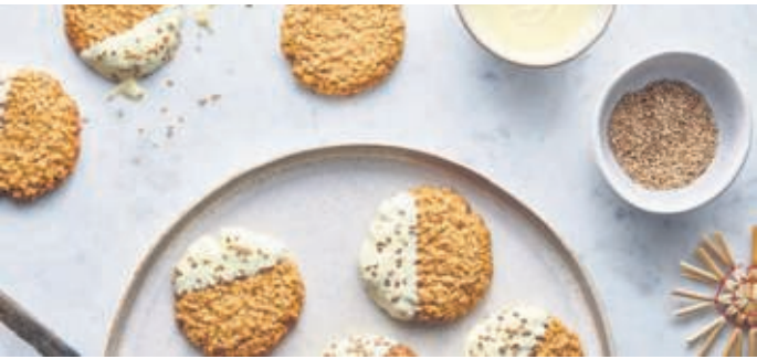
Haferflocken verleihen Weihnachtsgebäck einen gesunden Touch - wie hier den schwedischen Keksen mit Kardamom.

Haferflocken bestehen immer aus dem vollen Korn. Sie sind also ein empfehlenswertes Vollkornprodukt, das Plätzchen eine gesunde Note verleiht. Das Gute daran: Haferflocken schmecken nicht nur, sie liefern auch viele wichtige Nährstoffe für den Körper: hochwertige Proteine, Vitamine wie Vitamin K, Mineralstof-