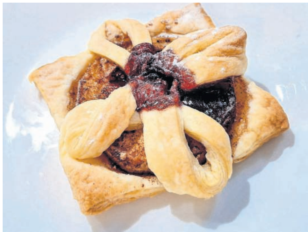
Apfelringe im Blätterteig.