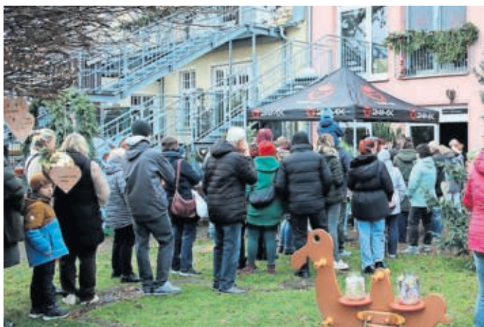
Schlange stehen gehört fast schon zum Ritual, zeigt aber, wie gut angenommen die Veranstaltung wird.