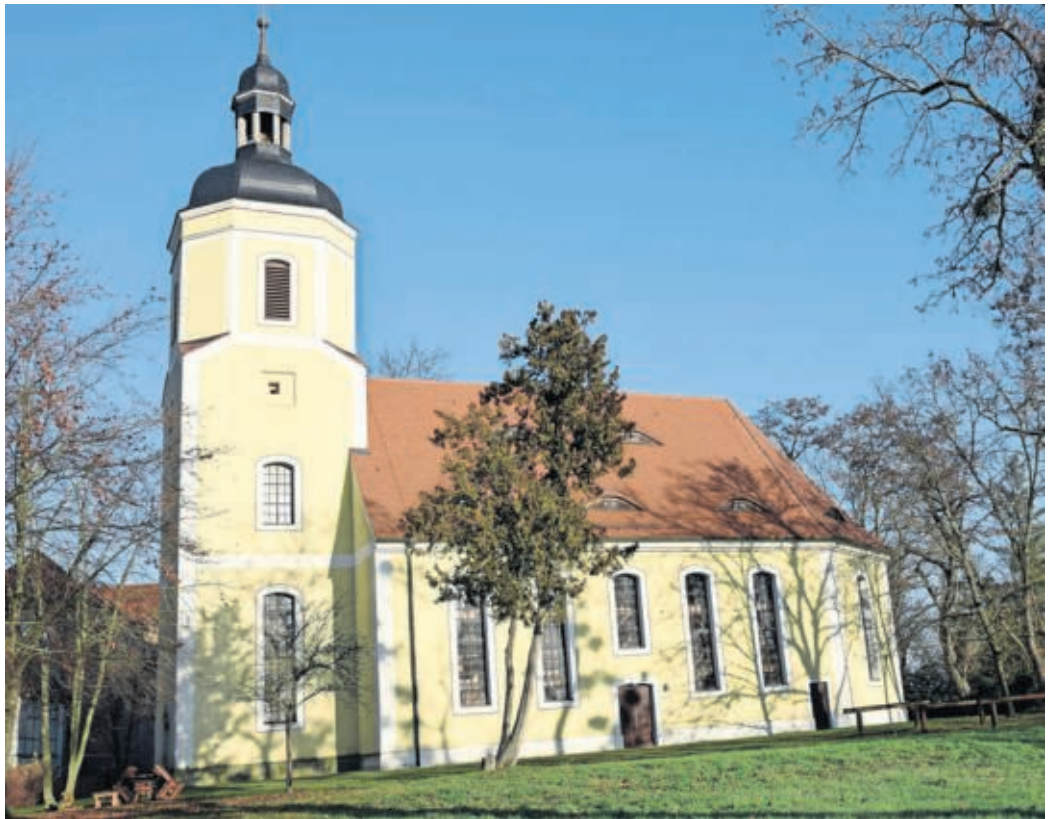
Auch in der 1. Deutschen Radfahrerkirche in Weßnig findet am Heiligen Abend ab 14 Uhr eine Christvesper statt.

mit Krippenspiel, BECKWITZ 15.30 Uhr Christvesper mit Krippenspiel, NIEDERAUDENHAIN 16 Uhr Christvesper mit Krippenspiel, LANGENREICHENBACH 16.30 Uhr Christvesper mit Krippenspiel, MOCKREHNA 17 Uhr Christvesper mit Krippenspiel, KLITZSCHEN 17 Uhr Christvesper mit Krippenspiel, STAUPITZ 17 Uhr Christvesper mit Krippenspiel, MELPITZ 17 Uhr Christvesper mit Krippenspiel, SITZENRODA 17 Uhr Christvesper mit Krippenspiel, SCHÖNA 17 Uhr Christvesper mit Krippenspiel, WILDSCHÜTZ 17 Uhr Christvesper mit Krippenspiel, TAURA 18 Uhr Christvesper mit Krippenspiel, SCHILDAU 21 Uhr Hirten-Nacht; LOBWIG 15 Uhr Christvesper mit Krippenspiel, TORGAU Schlosskirche 16 Uhr Christvesper mit Krippenspiel, WELSAU 16 Uhr Christvesper mit Krippenspiel, ZINNA 17.15 Uhr Christvesper mit Krippenspiel, TORGAU Stadtkirche 17.30 Uhr Christvesper mit Kantorei, KREISCHAU 15.30 Uhr Christvesper mit Krippenspiel, ZWETHAU 15.30 Uhr Christvesper, ROSENFELD 15 Uhr Christvesper mit Krippenspiel, DÖBRICHAU 15.30 Uhr Christvesper, BEILRODE 16.30 Uhr Christvesper mit Krippenspiel, TRIESTE WITZ 15.30 Uhr Christvesper, ARZBERG 17.15 Uhr Christvesper