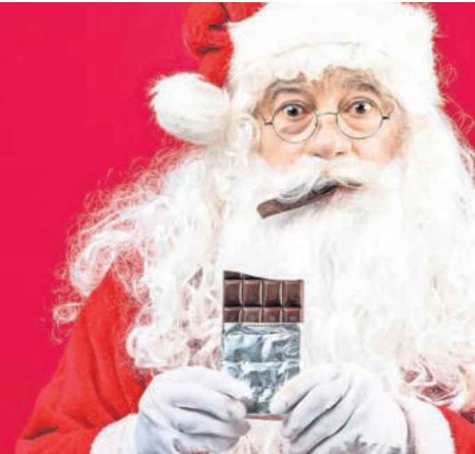
Schokolade und Weihnachten gehören zusammen.

Zurück zur Schokolade: Die industrielle Revolution machte die Leckerei schließlich einer breiten Bevölkerung zugänglich – zumindest als besonderes Präsent. Und als solches passte es