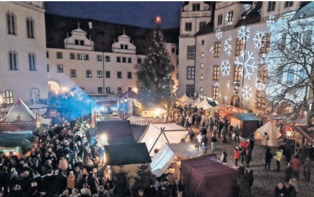
Das vergangene Wochenende zeigte: Torgau kann Weihnachtsmarkt! Auch wenn beide Veranstaltungen das Wort „Weihnachtsmarkt“ nicht mehr im Titel tragen.