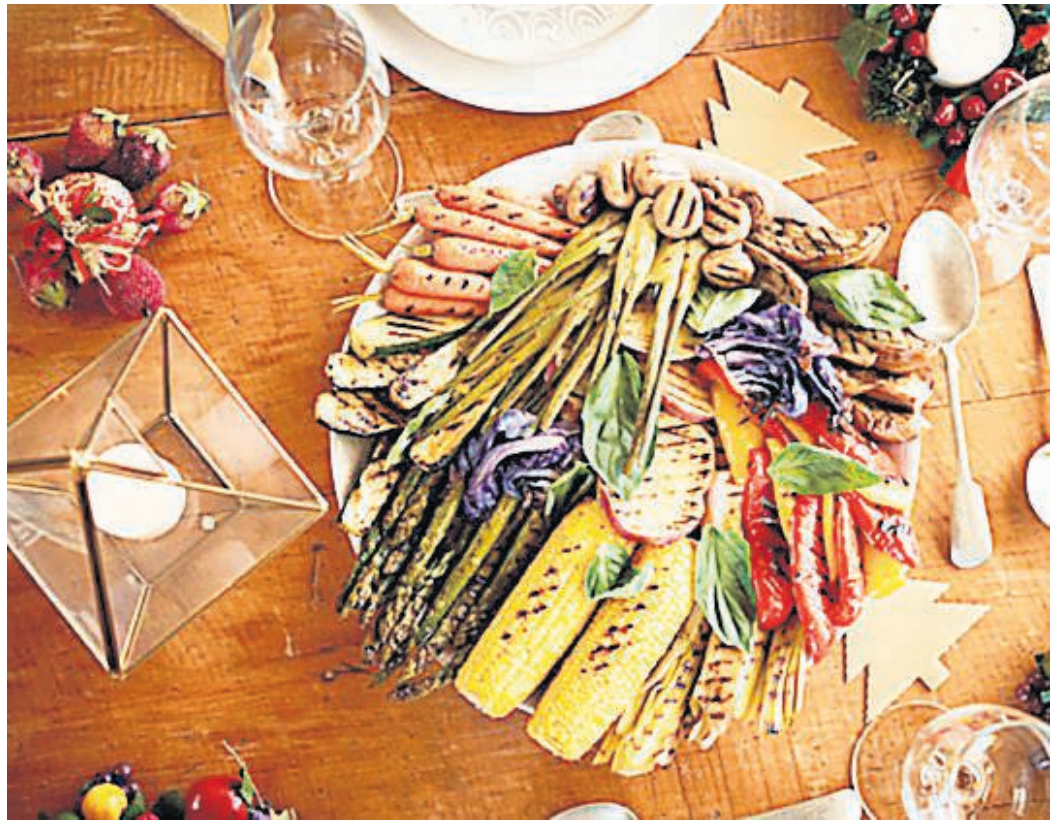
Gesunde Weihnachten sind möglich.