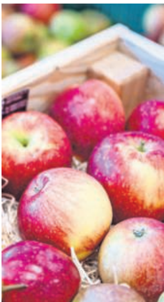
Äpfel sind zu jeder Zeit beliebt bei den Deutschen.