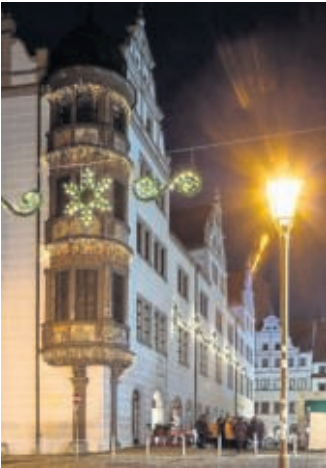
Heimelig ist es nicht nur zur Weihnachtszeit in der Torgauer Innenstadt. Bei speziellen Führungen lassen sich die Schönheiten entdecken.

TORGAU. Öffentliche Stadtführungen in Torgau werden am 26., 27. und 28. Dezember – jeweils von 14 bis 15 Uhr angeboten. Zwischen Braten und Kaffee bieten wir Geschichte und Bewegung. Überraschen Sie Ihre Liebsten, Ihren Besuch oder Entkommen Sie selbst für eine kurze Weile dem Weihnachtstrubel. Lauschen Sie dem Stadtführer, der Ihnen auf dem Weg durch schmale Gassen, vorbei an prächtigen Renaissancehäusern, hin zum Schloss Hartenfels Interessantes aus der über 1000-jährigen Geschichte Torgaus erzählt. SWB