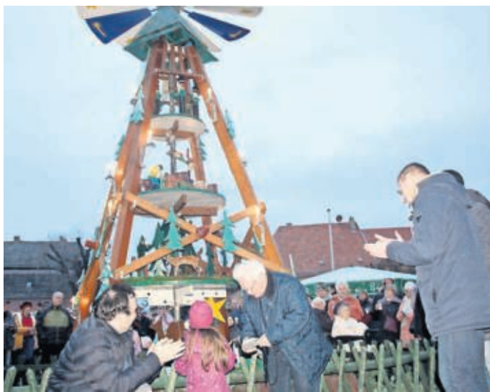
Bei der Veranstaltung Advent in den Höfen schieben Mitglieder des SV Roland Belgern die Pyramide auf dem Marktplatz an.