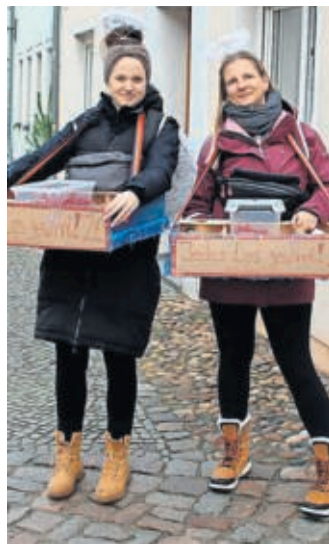
Engel in den Straßen Belgerns.

nen an einem Strang zu ziehen. Verdienter Lohn: Die Menschenmassen, die sich durch die Altstadt wälzen, sind erstaunlich. Die Organisatoren setzen in gewiss nicht einfachen Zeiten ein starkes Zeichen für Gemeinschaft und Kreativität. SWB