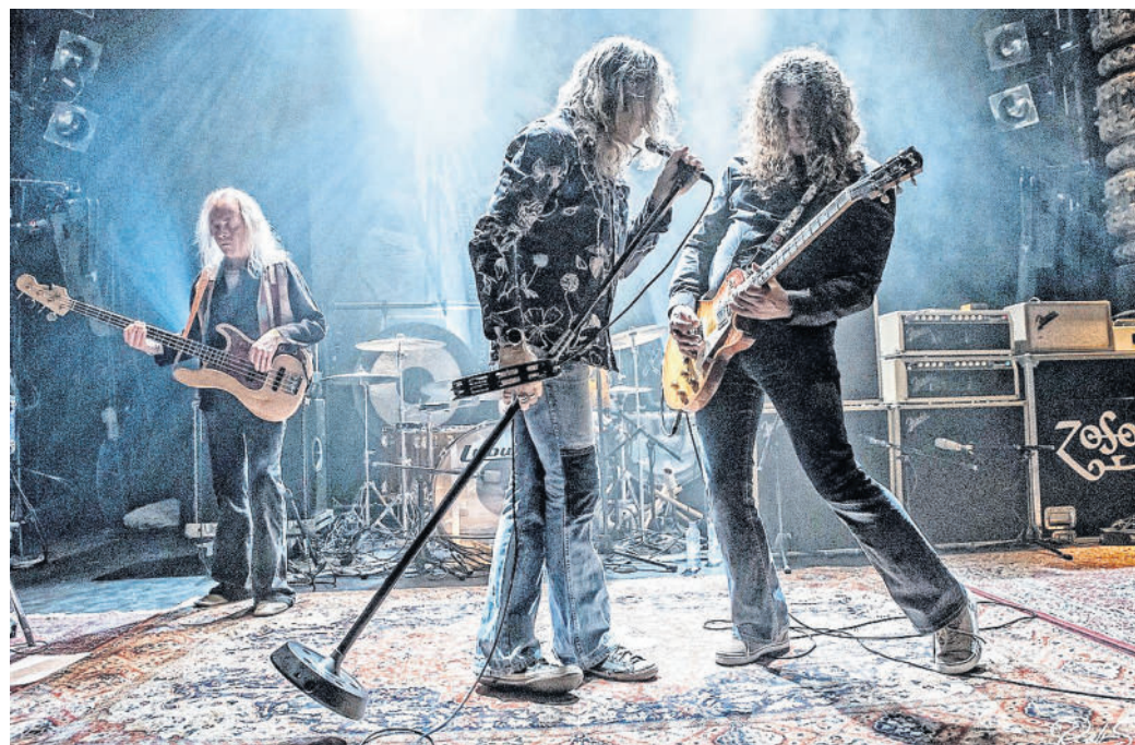
Physical Graffiti spielen die Lieder Led Zeppelins mit Wucht und Power.

PHYSICAL GRAFFITI spielen am 12. SEPTEMBER im Kulturhaus Torgau