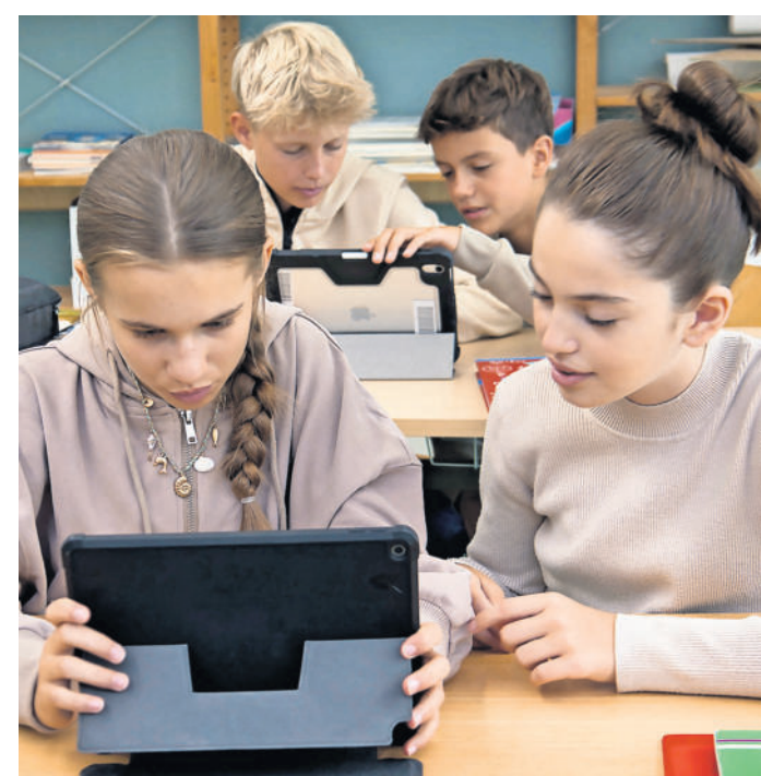
K Künstliche Intelligenz kann Lernen erleichtern, aber sie darf das eigene Denken nicht ersetzen.

Auf 28 Seiten zeigt der Ratgeber, wie künstliche Intelligenz in allen Phasen des Lernens unterstützen kann. Anhand konkreter Beispiele erfahren Schülerinnen und Schüler, wie sie KI nutzen können, um ihren Lernalltag besser zu organisieren - etwa beim Erstellen eines realistischen Lernplans, beim Strukturieren von Unterrichtsstoff oder beim Wiederholen vor Klassenarbeiten. KI kann beispielsweise helfen, Themenlisten zu erstellen, oder schwierige Inhalte gut verständlich erklären. Auch beim Üben kommt Künstliche Intelligenz zum Einsatz, indem sie individuelle Aufgaben erstellt, typische Fehler analysiert oder Probenprüfungen simuliert.