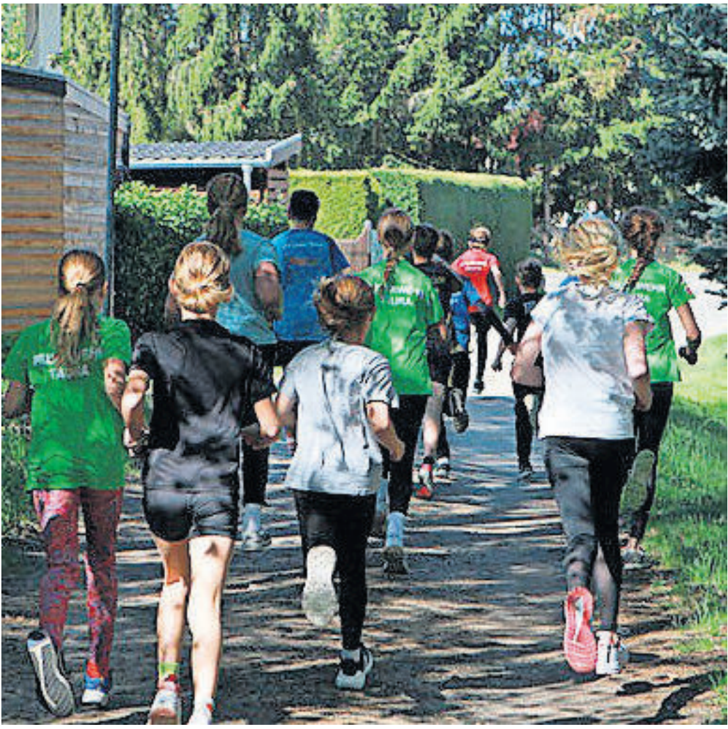
Am 19. April wird ab 10 Uhr der 7. Lauf in den Frühling in Taura gestartet.

TAURA. Der Kultur- und Sportverein Taura veranstaltet am Sonntag, 19. April, ab 10 Uhr die Auflage des Laufes in den Frühling. Start- und Zielbereich befinden sich „Am Tiergehege“, Zufahrt über die Neußener Straße nutzen. Zur Auswahl stehen unterschiedliche Streckenlängen für alle Generationen: von den Bambinis über 400 m (Hirschgehegerunde), über den Jugendlauf über 2 km (2 x 1 km Rundkurs), Kurzstrecke über 5 km (Dachsberggrunde) bis hin zur Langstrecke über 10 km (Vogelberggrunde). Im Vordergrund sollen der Spaß an der Bewegung und die nette Geselligkeit im Kreise Gleichgesinnter stehen. Für eine Versorgung wird der Veranstalter sorgen. Pokale, Medaillen und Urkunden gibt es für die Erstplatzierten der Läufe sowie Erinnerungsmedaillen für alle Bambinis und Schüler. Es werden Startgebühren erhoben. Achtung! Der Veranstalter übernimmt keine Haftung bei Personen- und Sachschäden sowie abhanden gekommenen Gegenständen SWB/HL