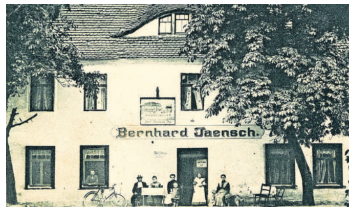
Zu einem vergnüglichen Streifzug durch die Genuss-Geschichte in mageren Zeiten und die Torgauer Kneipen-Geschichte wird im Stadtmuseum Torgau eingeladen.

☐ Karten sind ab sofort an der Museumskasse zu erwerben. Gruppenanmeldungen werden separat telefonisch entgegengenommen.