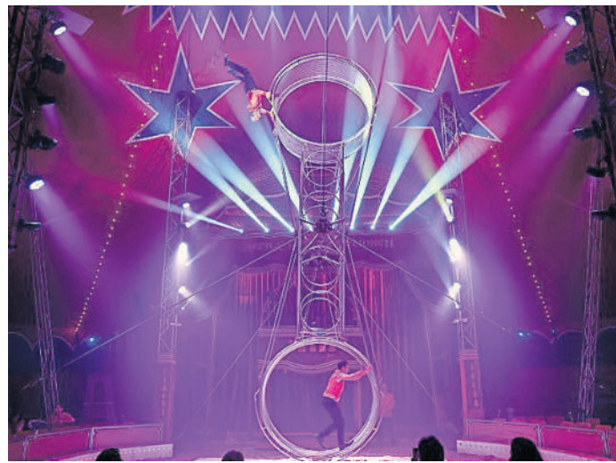
Tollkühne Artisten auf dem Todesrad.

Circus Arena gastiert vom 10. BIS 12. APRIL auf der neuen Festwiese in Torgau