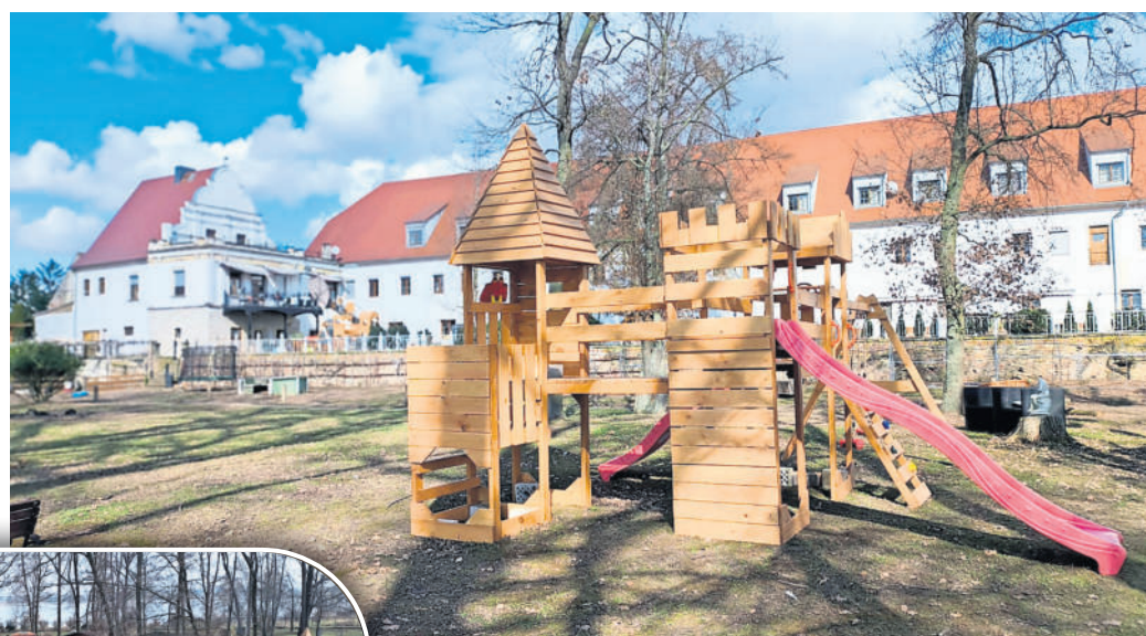
Die vielen Spielgeräte im Rittergut Dröschkau warten darauf, bespielt zu werden.

RIITTERGUT DRÖSCHKAU. Nach dem Erfolg des 1. Weihnachtsparks im Rittergut Dröschkau im Dezember 2025 hat Gerhard Schumann die nächste Idee. Mit dem Slogan: „Ostern einmal anders erleben“ wirbt er, an den Osterfeiertagen dem Rittergut Dröschkau einen Besuch abzustatten. Neben dem traditionellen Osterspaziergang in herrlicher Natur lässt sich dort im Park eine Menge entdecken. „Für kleine und große Kinder sind Spielgeräte aufgebaut. Die Strohballen zum Herumtoben werden der Renner“, weiß Schu-