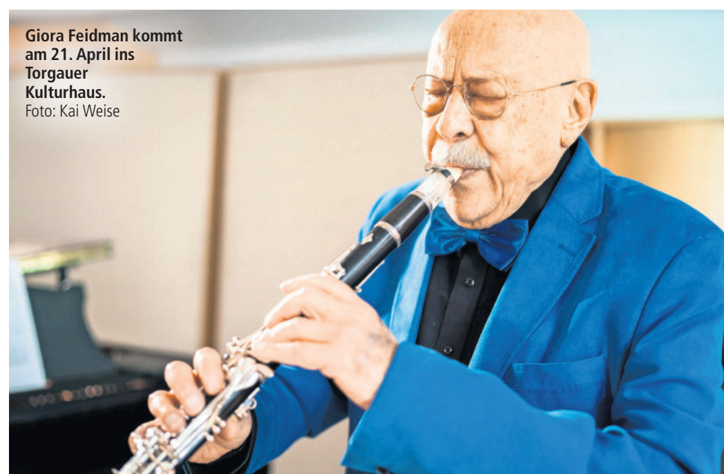
Giora Feidman kommt am 21. April ins Torgauer Kulturhaus.