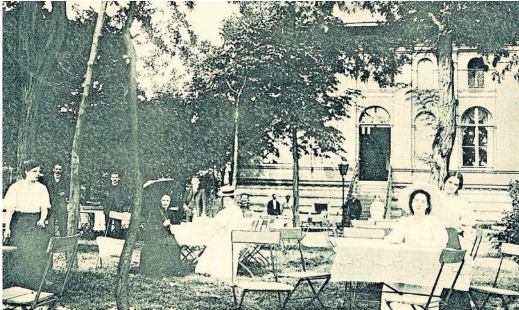
Zu einem vergnüglichen Streifzug durch die Genuss-Geschichte in mageren Zeiten und die Torgauer Kneipen-Geschichte wird im Stadtmuseum Torgau eingeladen.

ERLEBNISFÜHRUNG IM STADTMUSEUM inklusive Torgauer Kneipenkultur