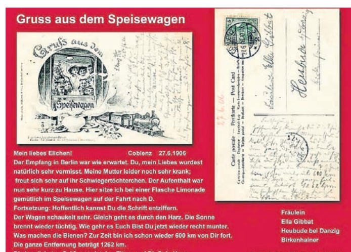
Philokartistische Schätze werden in Oschatz gehoben.