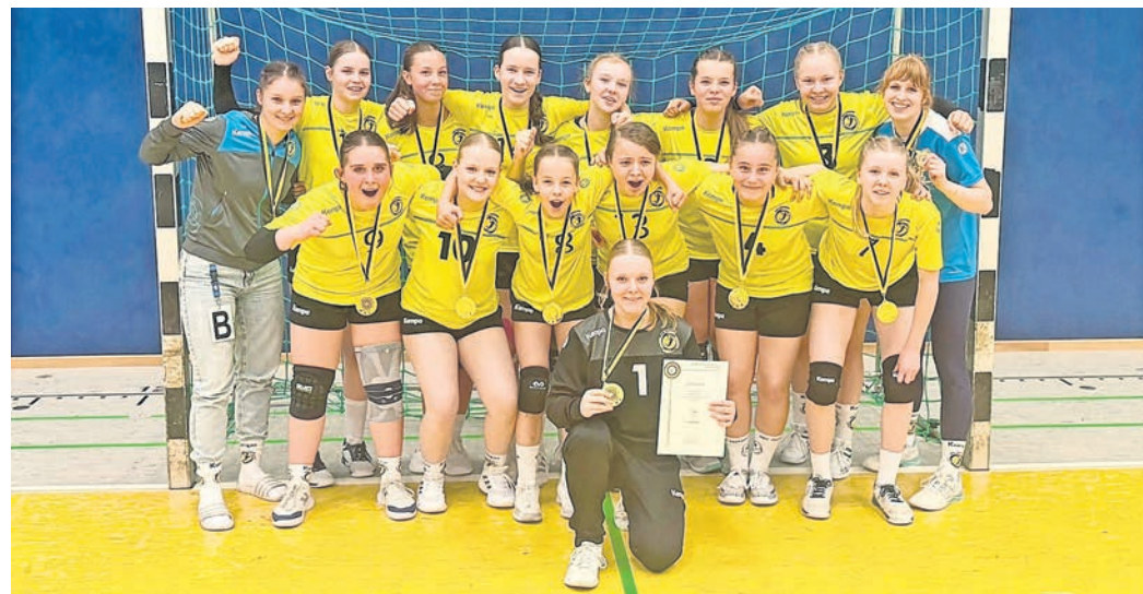
Die C-Jugend-Handballerinnen vom SHV Oschatz durften dieser Tage feiern – und zwar den Meistertitel in der Regionsoberliga Sachsen-Mitte!

Die Vorgeschichte: In der Staffel 2 belegten die Oschatzerinnen mit neun Siegen und nur drei Niederlagen einen starken zweiten Platz und qualifizierten sich damit verdient für das Final-Four-Turnier der besten vier Mannschaften. Über die gesamte Saison hinweg überzeugte das Team mit konstanten Leistungen, großem Einsatzwillen und einer positiven Entwicklung. Immer wieder zeigte die Mannschaft, dass sie auch in engen Spielen bestehen kann. Ein besonderer Dank gilt den Spielerinnen der D-Jugend, die die C-Jugend regelmäßig unterstützten – ein gelungenes Beispiel für die gute Nachwuchsarbeit im Verein. Ebenso trugen die Eltern mit ihrer zuver-