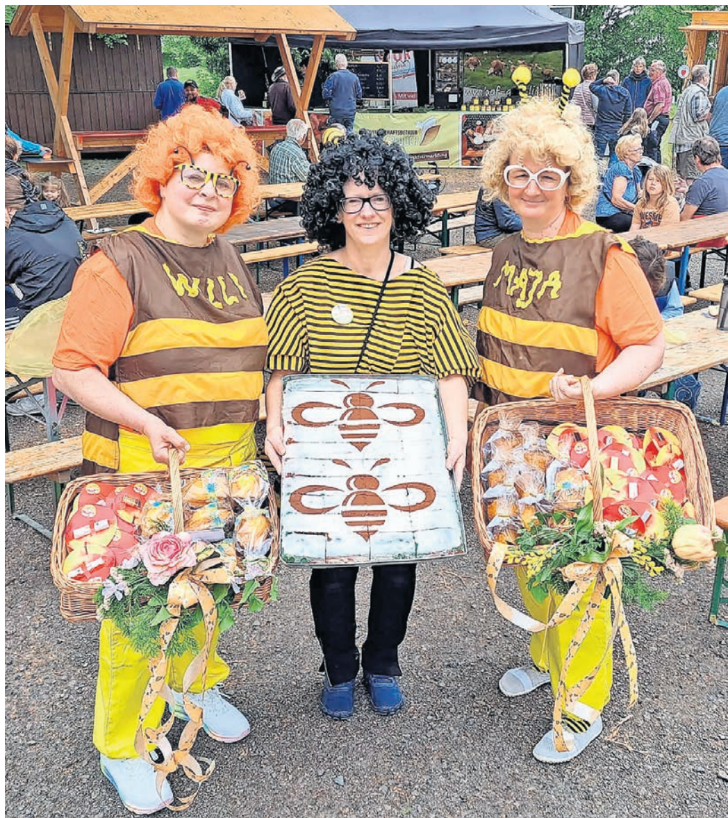
Kunterbunt beim Blütenfest in Sornzig – hier wird die Tradition als Obstbauregion noch gelebt.

Am Wochenende lockt mit dem BLÜTENFEST NACH SORNZIG / Kloster-Innenhof wird zum Fest-Mittelpunkt