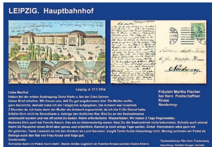
Auch der Leipziger Hauptbahnhof wird gezeigt.