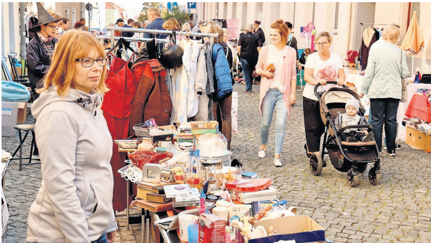
Schnäppchenjagd und Flohmarktbummel: In der Region Oschatz startet die Trödelmarkt-Saison.

FLOHMARKTSAISON führt mit Trödelmärkten von Oschatz bis nach Mügeln – Start in Schmannewitz