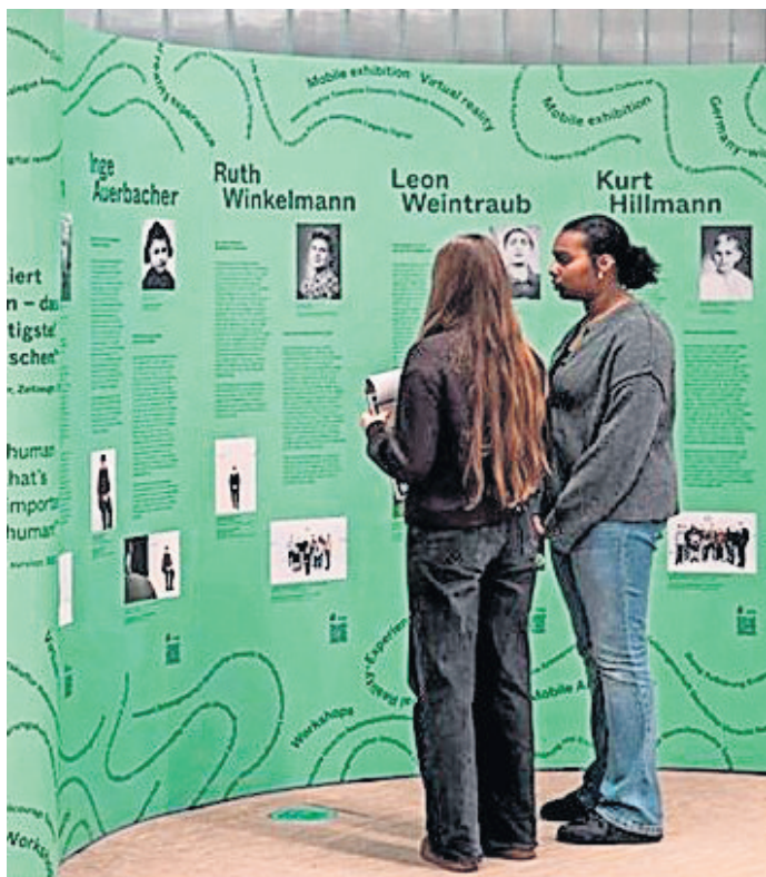
Die Wand mit Lebensläufen.

PRETTIN. In Echt? – Virtuelle Begegnung mit NS-Zeitzeug:innen“ heißt die neue Wanderausstellung in der Gedenkstätte KZ Lichtenburg Prettin. Die Eröffnung erfolgt am Donnerstag, 7. Mai, um 17.30 Uhr , die Ausstellung ist bis 4. Juli zu sehen. In einer Zeit, in der immer weniger Zeitzeuginnen und Zeitzeugen persönlich berichten können, das demokratische Grundfundament unserer Gesellschaft massiv angegriffen wird und antisemitische sowie rassistische Einstellungen zunehmend sichtbar werden, gewinnt die Frage nach zeitgemäßer Erinnerungsarbeit neue Dringlichkeit. Die Wanderausstellung „In Echt? Virtuelle Begegnung mit NS-Zeitzeug:innen“ setzt genau hier an: Wie lassen sich Lebensgeschichten von NS-Verfolgten auch dann vermitteln, wenn direkte Begegnungen nicht mehr möglich sind? Mithilfe modernster VR-Technologie begegnen die Besuchenden fünf jüdischen Personen, die von ihren Erlebnissen während der NS-Zeit berichten. Die Menschen erfahren, wie es war, sich verstecken zu müssen, verfolgt und deportiert zu werden. Dies geschieht in einer immersiven Gesprächssituation, in der die Teilnehmenden in eine virtuelle Umgebung eintauchen und sich ausschließlich auf das Interview mit den Zeitzeuginnen und Zeitzeugen fokussieren können. Johanna Schüller, Co-Kuratorin der Ausstellung, wird