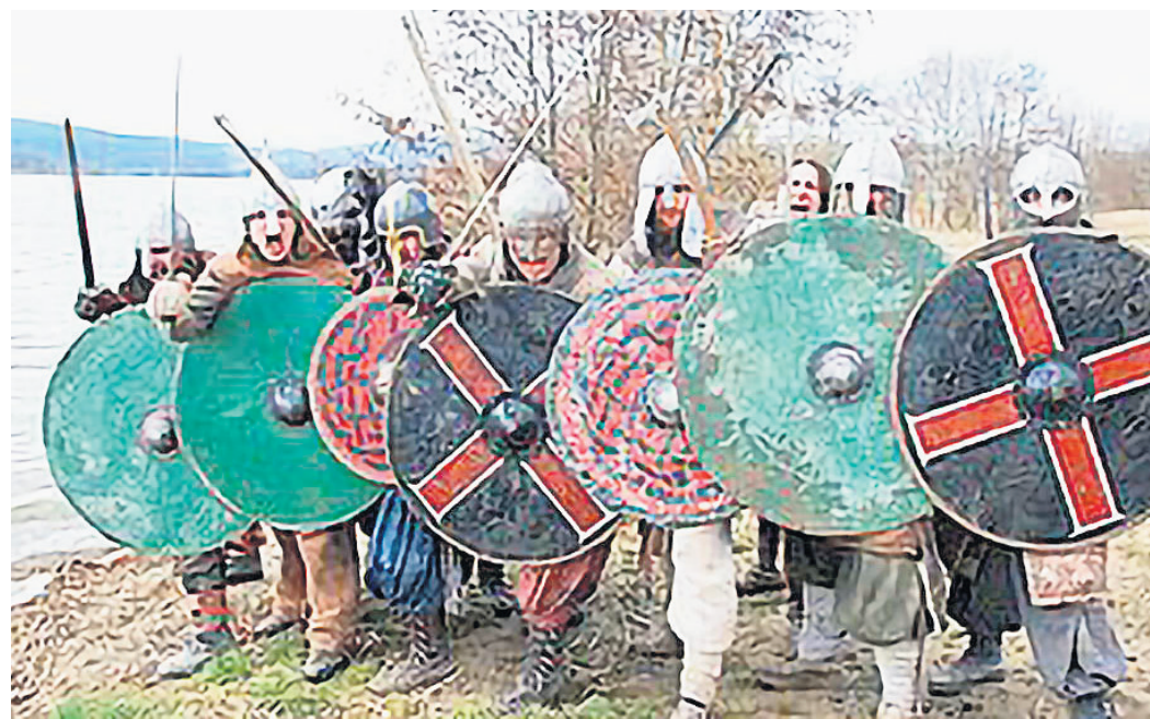
Wikinger erobern die Schladitzer Bucht bei Rackwitz.

REGION. Am Wochenende, 9. und 10. Mai , wird das Ufer der Schladitzer Bucht bei Rackwitz erneut zum Schauplatz für ein großes, mittelalterliches Spektakel. Wikingerschiffe legen direkt am Strand an und entführen die Besucher in eine längst vergangene Zeit. Wikinger hautnah: Erleben Sie wilde Raufereien mit Schilden und Äxten oder stechen Sie selbst mit den Wikingern in See – die Schiffe laden zu Rundfahrten auf der Bucht ein. Zahlreiche Stände bieten historisches Handwerk, Krämerwaren und deftige Gastronomie auf dem Mittelaltermarkt. Spielleute, Gaukler und Narren sorgen auf dem gesamten Gelände für Stimmung und Unterhaltung. Das Highlight ist der Drache Fangdorn – mehrmals täglich findet die spektakuläre Show „Der Drache Fangdorn und der Schatz der Elfen“ statt. Der zwölf Meter lange, technisch beeindruckende Drache spuckt echtes Feuer und verspricht ein span-