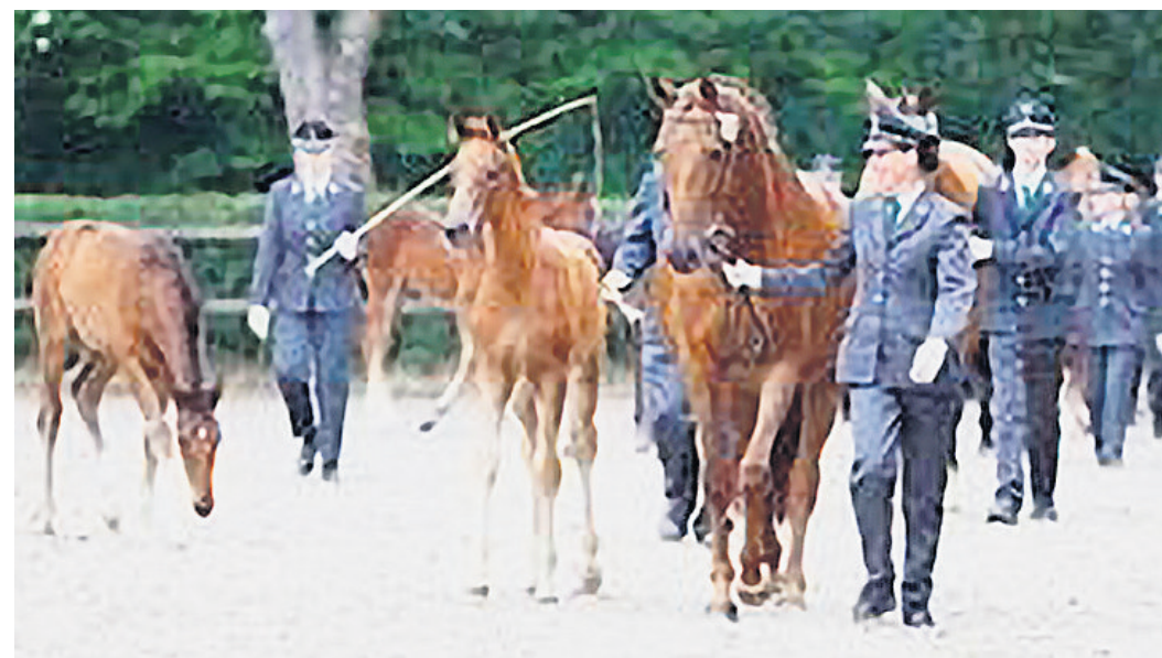
Das Gestüt Graditz lädt am Samstag ein.

2. FOHLENTAUFE MIT OFFENEM GESTÜTSMUSEUM am 2. Mai im Hauptgestüt Graditz