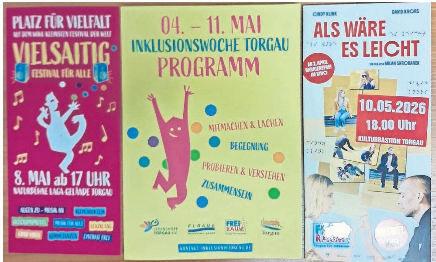
Themenvielfalt ist in der Woche der Inklusion in Torgau Trumpf.

INKLUSIONSWOCHE vom 4. bis 11. Mai in Torgau / 5. INKLUSIONSTAG am 8. Mai