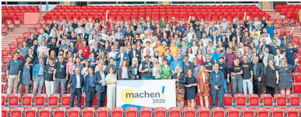
Die Preisverleihung „machen!2025“ fand in der Alten Försterei, Heimstatt des 1. FC Union Berlin statt.

EHRENAMTLICHE UND ENGAGIERTE aus dem Osten Deutschlands können Projekte einreichen