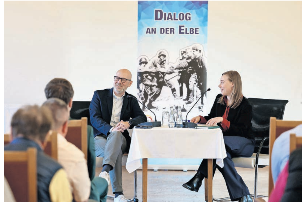
Die offene Gesprächsatmosphäre ermöglichte einen direkten Austausch zwischen Tauber und Publikum.

TORGAU. 60 interessierte Bürgerinnen und Bürger folgten am Freitagabend der vergangenen Woche der Einladung zum „Dialog an der Elbe“ in das historische Rathaus der Stadt Torgau. Gast des Abends war Peter Tauber, ehemaliger Generalsekretär der CDU und Parlamentarischer Staatssekretär im Bundesministerium der Verteidigung. Unter dem Eindruck der aktuellen sicherheitspolitischen Lage stand insbesondere die Verteidigungsfähigkeit Deutschlands im Fokus der Veranstaltung. Tauber sprach über die Herausforderungen für die Bundeswehr sowie über die außenpolitischen Beziehungen Deutschlands und die Rolle der Bundesregierung in einer sich wandelnden Weltordnung. Auch die Verantwortung Deutschlands innerhalb Europas wurde dabei intensiv beleuchtet. Moderiert und begleitet wurde der Abend durch die Landtagsabgeordnete Tina Trompeter sowie die Bundestagsabgeordnete Christiane Schenderlein (beide CDU). Neben den großen politischen Linien gewährte Tauber den Gästen auch persönliche Einblicke in seinen eigenen Werdegang und seine Motivation für politisches Engagement. Dabei wurde ebenso die Rolle der CDU in der aktuellen politischen Landschaft thematisiert, wie auch die