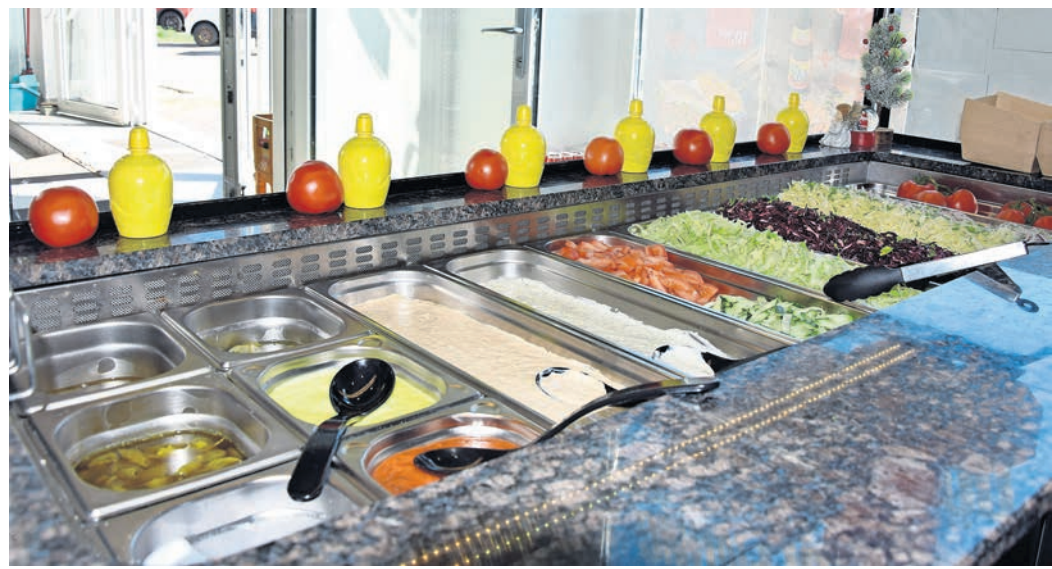
Täglich frisch werden Soßen und Gemüse für Döner und Pizzen zu bereitet.

Öffnungszeiten von Montag bis Sonntag von 10 bis 20 Uhr, telefonische Vorbestellungen unter 0152 24009025.