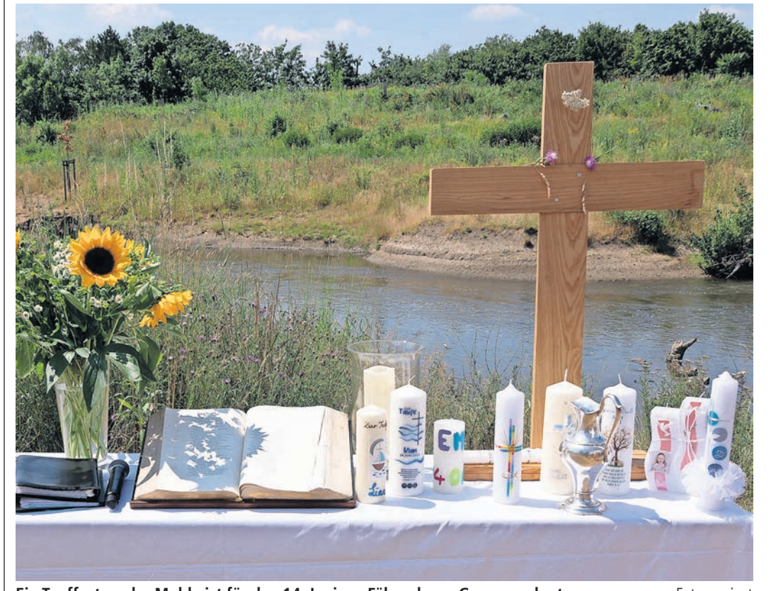
Ein Tauffest an der Mulde ist für den 14. Juni am Fähranleger Gruna geplant.