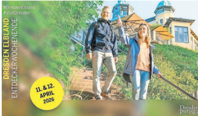
Auch Torgau beteiligt sich am Entdeckerwochenende. Plakat: Elbland Dresden

TORGAU. Am Wochenende, 11. und 12. April, lädt das Entdeckerwochenende Dresden Elbtal ein, die eigene Heimat neu zu entdecken. 90 besondere Angebote eröffnen spannende Einblicke, exklusive Erlebnisse und genussvolle Momente – viele davon sind sonst nicht oder nur eingeschränkt öffentlich zugänglich. Ob Geschichte, Kultur oder Kulinarik: Für Familien, Paare und Entdecker jeden Alters ist etwas dabei. In Torgau erwarten Sie acht spannende Erlebnismöglichkeiten: