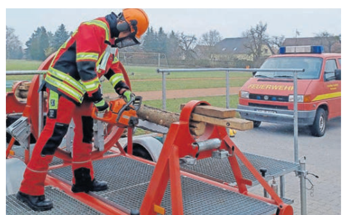
Die Tagesausbildung der drei Ortswehren der Gemeinde Dreiheide war ein voller Erfolg.