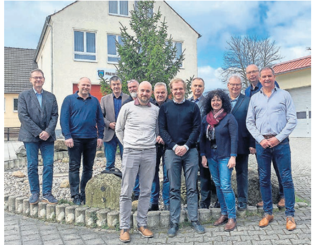
Die Bürgermeister der neun Torgauer Elb-Heidland-Kommunen trafen sich zu ihrer ersten Beratung im neuen Jahr.

TROSSIN. Unlängst trafen sich die Bürgermeister der neun Torgauer Elb-Heidland-Kommunen zu ihrer ersten Beratung im neuen Jahr im Gemeindeamt Trossin. Hauptthema war die Besprechung von investiven Fördermöglichkeiten für die Landkommunen in den kommenden Jahren. Heiko Böttcher und Kollegen von der Leipziger DSK Stadtentwicklung schilderten den Weg für den Kommunalbund des ehemaligen Torgauer Altkreises zur Beteiligung am Städtebau-Förderprogramm. Mit den bei Bewilligung des Antrages in Aussicht stehenden Fördermillionen soll nach Möglichkeit in jeweils einem Ortsteil der neun Kommunen in Projekte investiert werden können. „15 Millionen Euro stehen für 15 Jahre zur Verfügung - eine lukrative Investitionssumme“, befindet der Torgauer OBM Henrik Simon. Die Förderung aus Bundes- und Landesmitteln beträgt 66,6 Prozent. Die weiteren Abstimmungen laufen nun im Frühjahr; das nächste Treffen der Runde findet in Dommitzsch statt. SWB