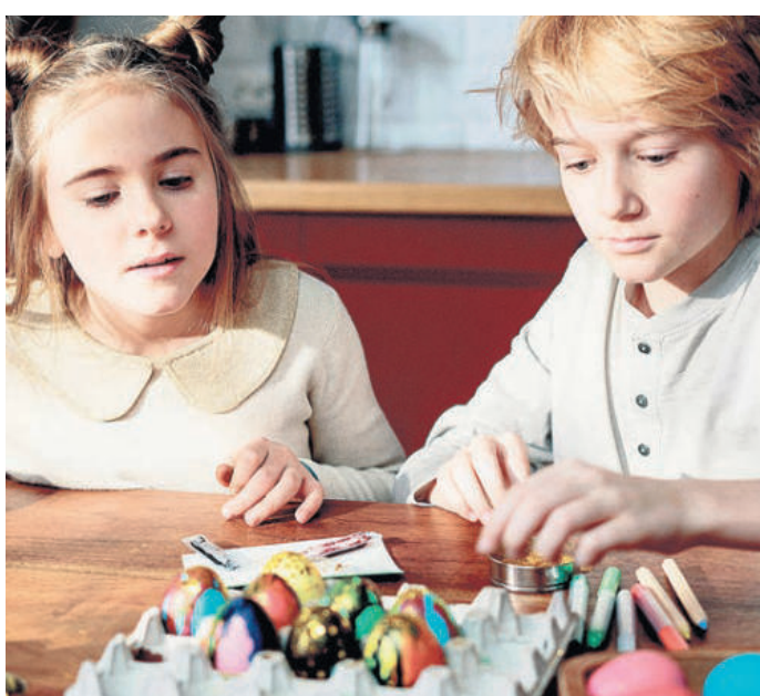
Zu Ostern Eier färben ist in vielen Familien eine feste Tradition und macht besonders Kinder Spaß.

Das Osterei ist das bekannteste Symbol des Festes. Schon im Mittelalter wurden Eier während der Fastenzeit nicht gegessen und stattdessen haltbar gemacht. Zu Ostern verschenkte man sie – oft rot gefärbt als Zeichen des Lebens. Heute sind bunt bemalte Eier fester Bestandteil jedes Osterfestes.