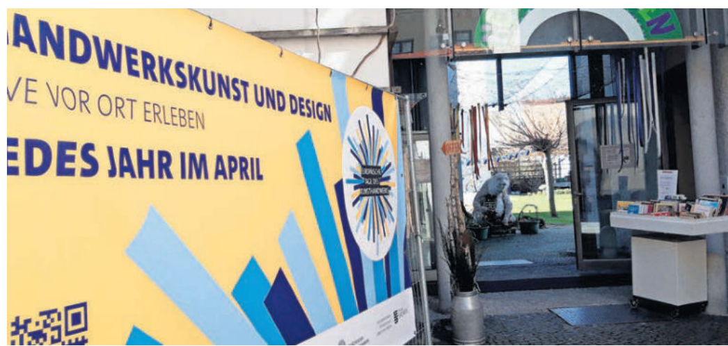
Ein Hoch auf das Kunsthandwerk am 11. April in der KunstGalerie Torgau.

TAGES DES EUROPÄISCHEN KUNSTHANDWERKS in der KunstGalerie Torgau