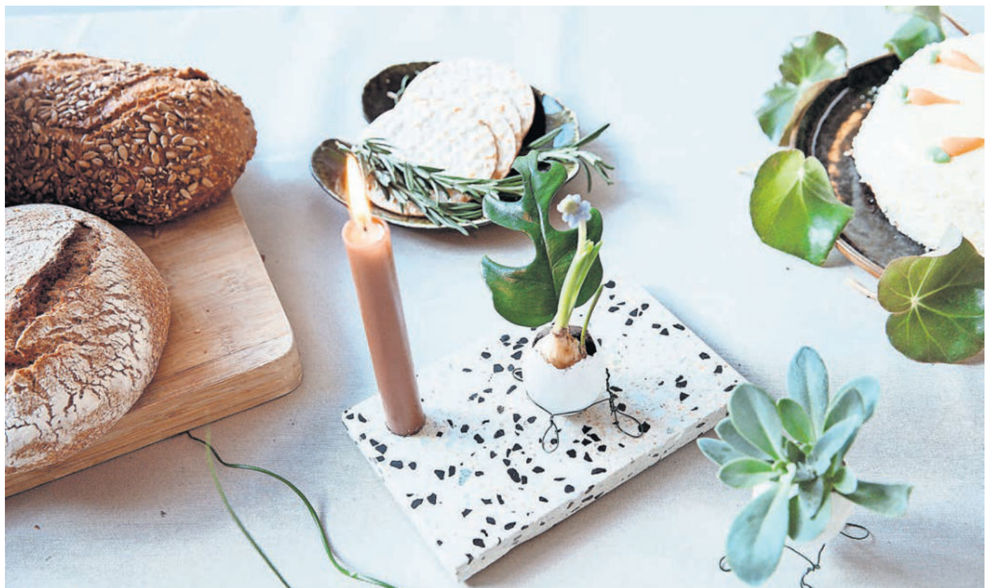
Stehen stilvoll auf dem Ostertisch: mit Pflanzen gefüllte Eiervasen.

Legen Sie Ihre Arbeitsfläche mit Zeitungspapier aus und platzieren Sie die Eier nebeneinander. Nun die Pastellfarben mit einem Abstand von etwa 20 cm auf die jeweils oben liegenden Seiten der Eier sprühen – und zwar in mehreren dünnen Schichten für ein möglichst gleichmäßiges Ergebnis ohne Nasen.