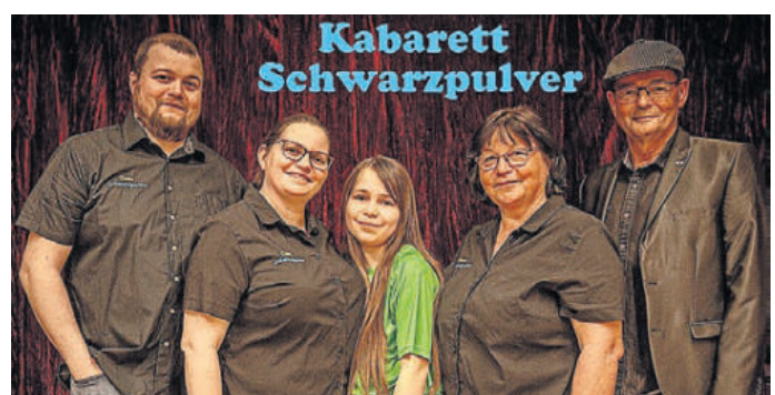
In neuer Besetzung: Das Kabarett Schwarzpulver.

► Karten-Vorverkauf in der Bibliothek Schildau, Telefon 034224 44035 oder per E-Mail: bibliothek-schildau@belgern-schildau.de