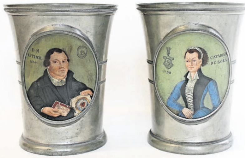
Zinnbecher mit den Porträts von Martin und Katharina Luther, um 1730 – erworben für das Museum im Jahr 2025.

ÖFFENTLICHER VORTRAG des Torgauer Geschichtsvereins am 8. April im Rathaus Torgau