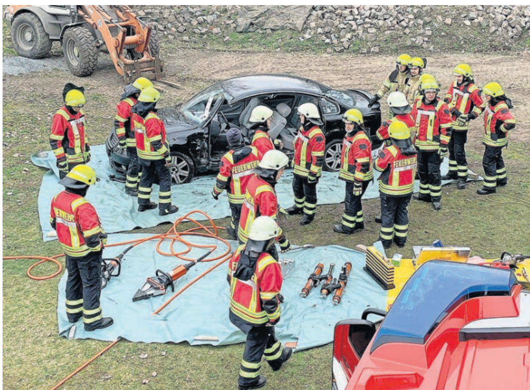
Der Umgang mit der neuesten Technik wurde trainiert.

Tagesausbildung der ORTSWEHREN AUS DREIHEIDE mit großer Beteiligung