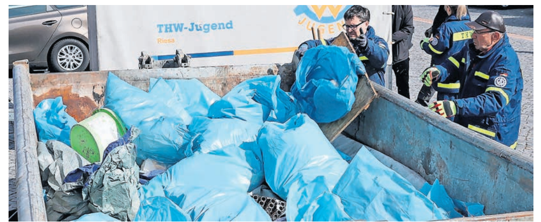
Das THW-Mitstreiter beim Entladen auf dem Rathausplatz.

Elbe und anderen Gewässern oder in Parks und Anlagen waren auch das THW, das DRK, der Leo Club, die Rotarier, die Cheerleader, Schüler der Oberschule „Am Sportzentrum“ und Mitglieder des CDU-Stadtverbandes unterwegs. Bewohner des Obdachlosenheims beteiligten sich traditionell ebenfalls an der Aktion wie die Wohngruppe der Diakonie. Zahlreiche Bürgerinnen und Bürger, darunter viele Familien mit Kindern, gingen auch „einfach so“ auf Sammeltour. Sie fanden Reifen, Kartons, Dosen, Papier aller Art, in der Elbe ein Fahrrad - und sogar Sondermüll wie Lacke und Lösungsmittel, der natürlich auch gesondert entsorgt wird. PM