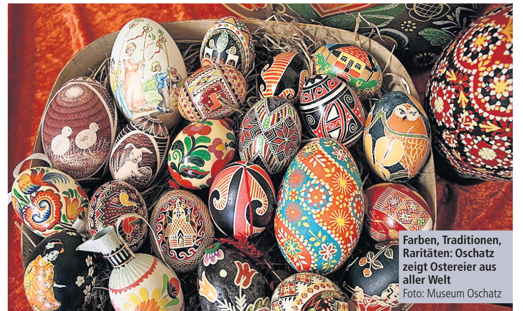
Farben, Traditionen, Raritäten: Oschatz zeigt Ostereier aus aller Welt

Auch im Jahr 2026 organisiert das Museum wieder zwei Trödelmärkte. Alle Schnäppchenjäger sollten sich den 9. Mai und den 5. September vormerken, denn dann kann rund um das Museum wieder nach Herzenslust gestöbert, gefeilscht und