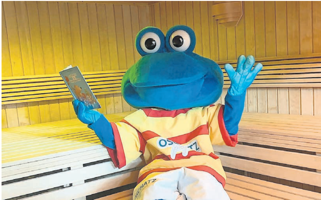
Vielleicht begegnen Sie zur Familien sauna dem Platsch-Frosch im Saunadorf Oschatz.

Familien sauna am 12. April im SAUNADORF OSCHATZ