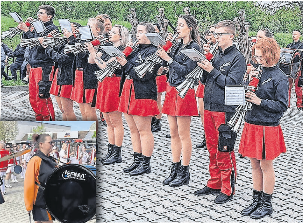
Das 8. Spielleutetreffen im PEP Torgau führt am 25. April ab 10 Uhr verschiedene Fanfaren- und Spielmannszüge zusammen.

TORGAU. Zum 8. Mal wird im PEP Torgau das Spielleutetreffen ausgetragen. Sechs Fanfaren-, Spielmanns- und Schalmienzüge geben am Samstag, 25. April, ab 10 Uhr Kostproben ihres Könnens zum Besten. Mit von der Partie sind der Stadtfanfarenzug Marktleberg e.V., der Fanfarenzug Crimmitschau, der Spielmannszug TV „Deutsche Eiche“ Hirschfeld, der Spielmannszug „Wurzner Spielleute“, die Schalmienkapelle Weiß-Grün e.V.