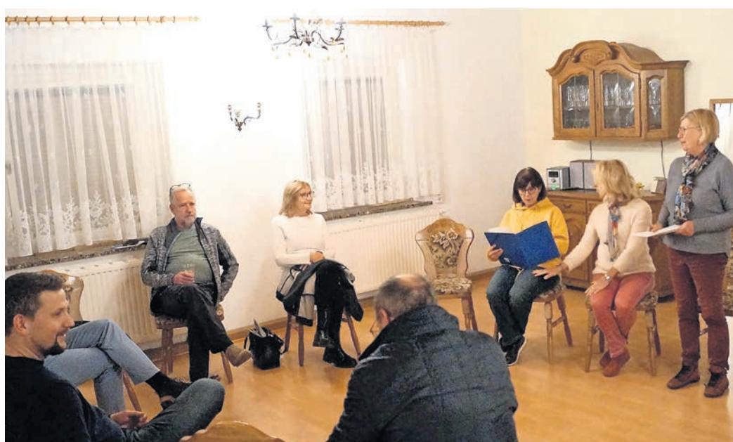
Der Förderverein Dorfkirche Lausa e.V. zog Bilanz.

Im laufenden Jahr sind weitere Aktivitäten geplant. Die Restaurierung der Kanzel, erbaut um 1700 und stehend auf einer gedrehten Holzsäule, kann begonnen werden. Den Auftrag hat der Restaurator Olaf Ehrhardt erhalten. Er hat in den letzten Jahren schon so manches Kleinod unserer Kirche neu erstrahlen lassen. Wir freuen uns, dass die Erhaltungsarbeiten dank der Unter-