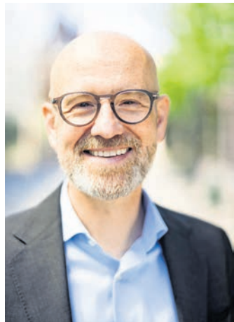
Dr. Peter Tauber

CDU-GENERALSEKRETÄR PETER TAUBER kommt auf Einladung der Junge Union Nordsachsen