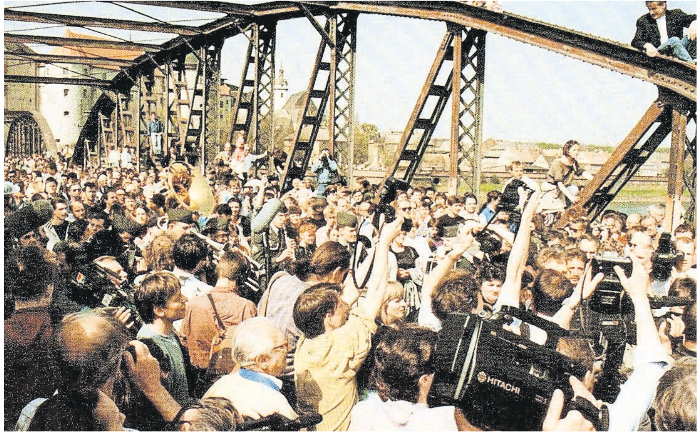
Was waren das für Zeiten, als zum Elbe Day auf der alten Elbbrücke Tausende Menschen die Begegnung feierten.

Der FÖRDERVEREIN EUROPA BEGEGNUNGEN und der Elbe Day 2026