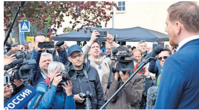
Im vergangenen Jahr, zum 80. Jahrestag des Elbe Days, weilte der Sächsische Ministerpräsident Michael Kretschmer zur Kranzniederlegung am Denkmal der Begegnung. In diesem Jahr fallen die Feierlichkeiten zwei Nummern kleiner aus.

► Markt der Möglichkeiten: Verleihe präsentieren sich mit vielen Mitmachangeboten und Überraschungen für Klein und Groß ► Musikfestival Frieden und Begegnung ► Gastronomie mit kulinarischen Angeboten aus aller Welt – serviert von Torgauer Wirten ► Flohmarkt am Elbanleger von 11 bis 16 Uhr ► Das Rahmenprogramm bietet vom 20. bis 26. April viel Abwechslungsreiches und Wissenswertes. ► Beim Förderverein Europa-Begegnungen e.V. in der Schlossstraße 19 ist von Montag, 20.