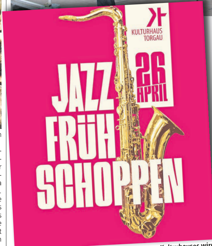
Zum Jazz-Frühschoppen im Garten des Torgauer Kulturhauses wird am 26. April ab 10 Uhr eingeladen.

TORGAU. Das Team von Torgau-Kultur e.V. lädt Freunde und Förderer, Nachbarn und Dich zur Begegnung im Garten des Kulturhauses Torgau ein. Lasst uns zusammensitzen und der Torgauer Big Band „Die Synkopenmuffel“ lauschen. Ab 10 Uhr sind wir am Sonntag, 26. April, anlässlich des diesjährigen Elbe Days bereit, Euch als Gäste zu empfangen. Natürlich versorgen wir euch mit Getränken und Bratwürsten vom Grill. Nutzt die Zeit, um euch zu begegnen, alte Bekannte zu treffen, neue Leute kennenzulernen oder einfach nur zu den jazzigen Tönen das Tanzbein zu schwingen. Wir freuen uns, euch als unsere Gäste begrüßen zu dürfen. Übrigens ist der Eintritt frei und ihr erreicht uns über den Eingang in der Kleinen Feldstraße. PM