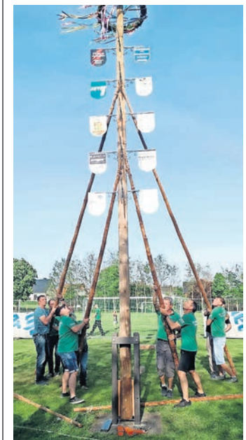
Kraftakt in Mannschatz: Am 1. Mai wird wieder der Maibaum gestellt.

SC GRÜN-WEIß MANNSCHATZ lädt am 1. Mai wird zum großen Frühlingsfest