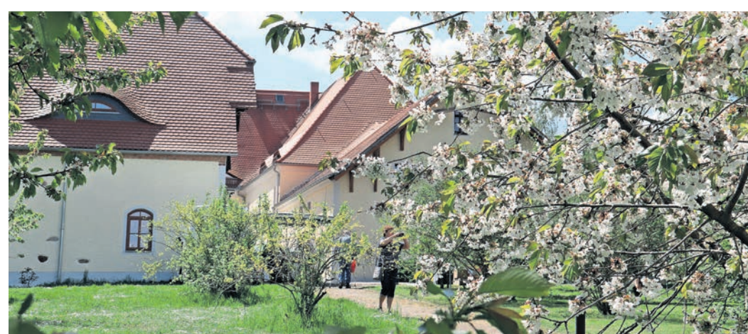
Das Blütenfest Sornzig macht seinem Namen wieder einmal alle Ehre.

Los geht es Freitagabend mit Tanz für die Jugend: Um 20 Uhr startet die Blüten House Night