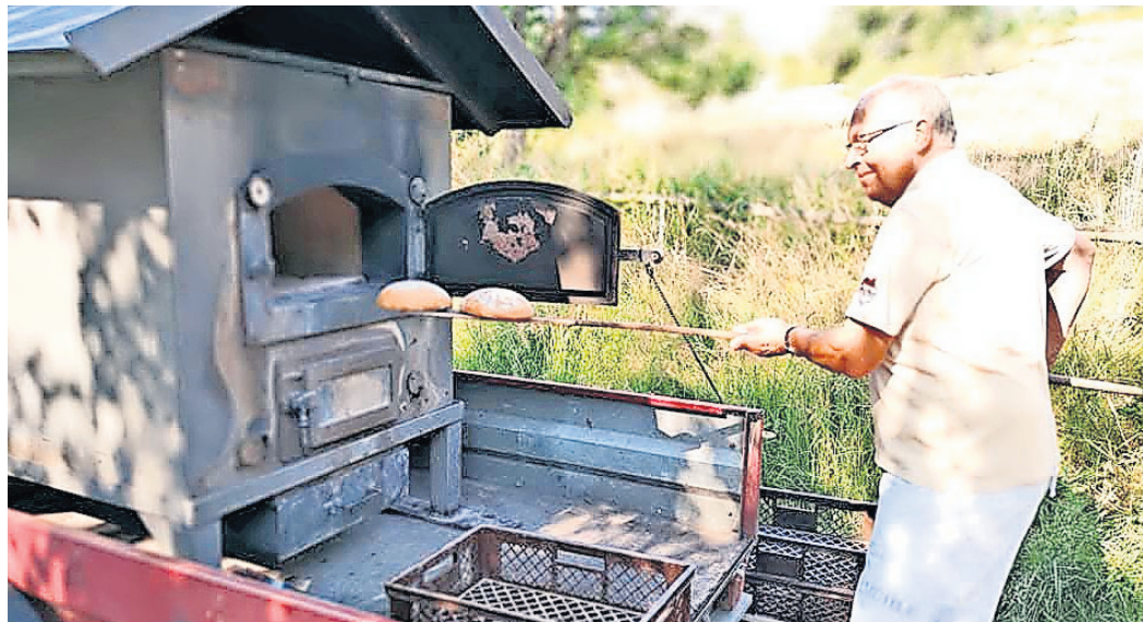
Natürlich wird zum 30-jährigen Jubiläum des Bauernmarktes auf der Hebelei der Ofen angeheizt und Brot gebacken.

Das 30-jährige Jubiläum wird AM 3. MAI gebührend zum Bauernmarkt gefeiert