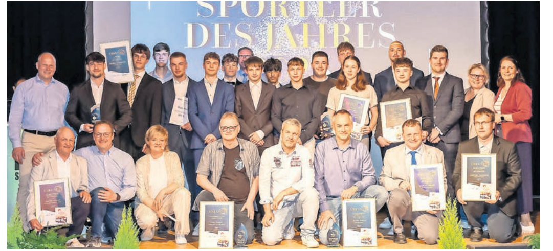
Gruppenfoto mit den Sportlern des Jahres 2025, Ehrenamts-Preisträgern, Sponsoren und Unterstützern.

SPORTLER DES JAHRES 2025 im ausverkauften Kulturhaus Torgau gekürt