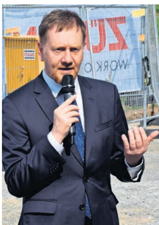
Der sächsische Ministerpräsident Michael Kretschmer betonte, dass mit dem GlasLab ein Ort entsteht, der Industrie, Handwerk und Wissenschaft zusammenbringt, Wertschöpfung sichert und neue Perspektiven schafft. Der Spatenstich stehe für einen gemeinsamen Aufbruch.

Tickets per Telefon 03421 737610, mehr Veranstaltungen auf: www.kulturbastion.de