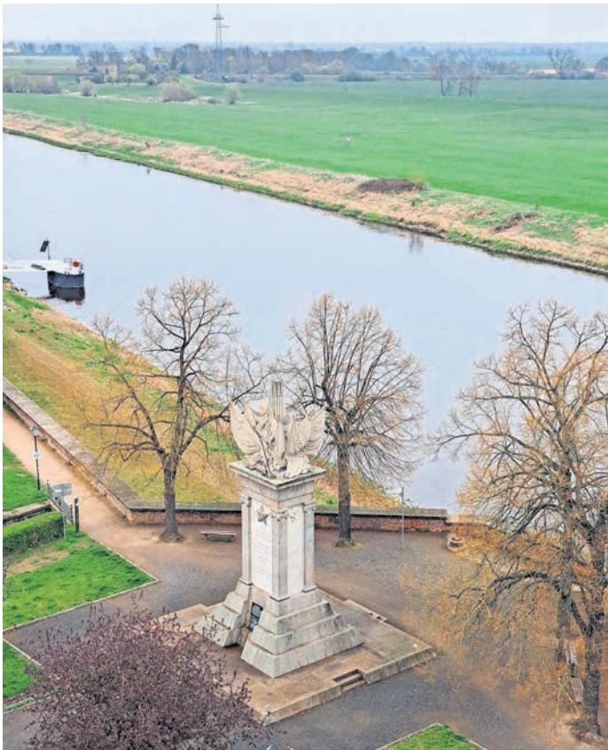
Blick aus dem Flaschenturm von Schloss Hartenfels auf das Denkmal der Begegnung an der Elbe.

TORG AU. Das Foto vom symbolischen Handschlag an der Elbe ging um die Welt: Am 25. April 1945 begegneten sich sowjetische und US-amerikanische Streitkräfte in Torgau – das Ende des Zweiten Weltkriegs stand unmittelbar bevor. Der Elbe Day am 25. April 2026 erinnert an dieses historische Ereignis – und auch der Kulturbetrieb Schloss Hartenfels des Landratsamtes Nordsachsen hat sich dazu einiges einfallen lassen. In der dritten Etage des Flaschenturms inszenieren und kontextualisieren jetzt spezielle Fensterfolien die Ausblicke auf die Schauplätze von 1945. Mit der Smartphone-Kamera können das Denkmal der Begegnung, der Brückenkopf auf der anderen Elbeseite sowie die alte Elbrücke gezielt im Bild festgehalten werden. QR-Codes führen zudem auf Internetseiten mit weiteren Infos. Zugang zum Flaschenturm besteht beim Besuch der Dauerausstellung „Standfest. Bibelfest. Trinkfest.“ im Schlossflügel B. In der Sonderschau „Fairytale – Geschichten aus dem Märchen-