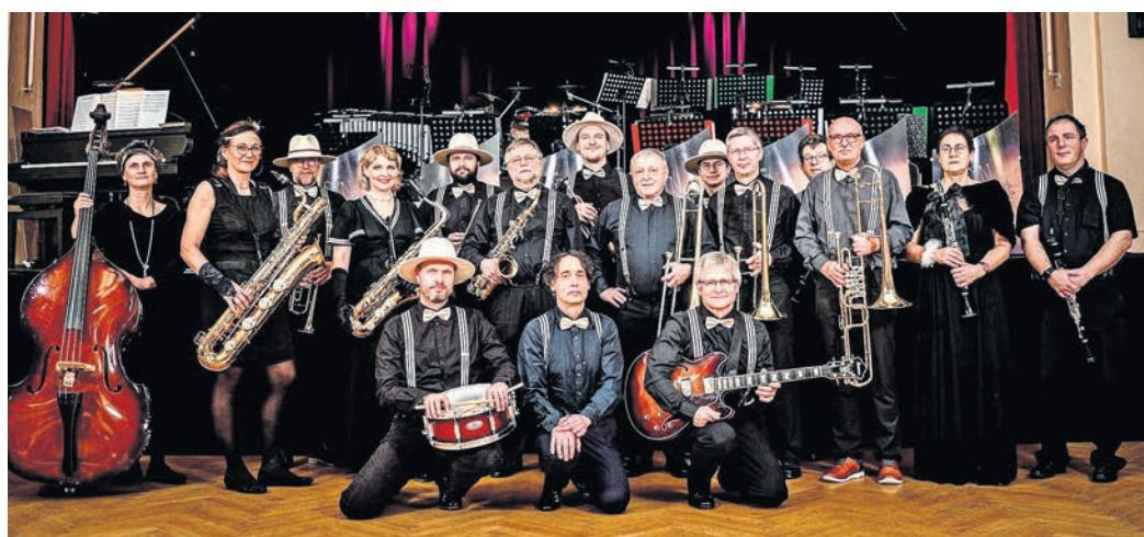
Die Synkopenmuffel - die Big Band aus Torgau lädt am 30. April zum Tanz in den Mai ins Torgauer Kulturhaus.

TANZ IN DEN MAI und Tanzkurs am 30. April IM KULTURHAUS TORGAU