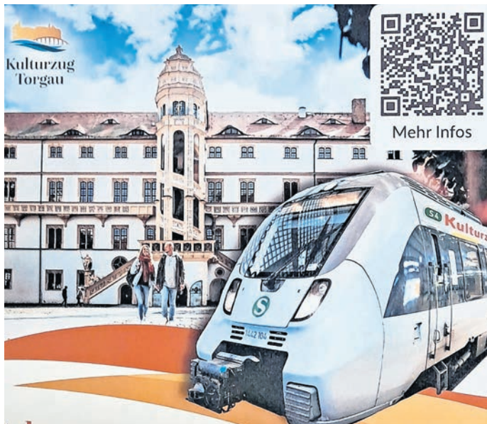
Ab Mai setzt sich der Kulturzug nach Torgau in Bewegung.

TORGAU. Vom neuen, monatlichen Angebot: „Mit dem Kulturzug nach Torgau“ können auch lokale Akteure profitieren, und das steckt dahinter. Die S4 der S-Bahn Mitteldeutschland wird zum Kulturzug und bringt Kulturinteressierte entspannt in 50 Minuten nach Torgau – an jedem ersten Wochenende im Monat (außer Dezember). Die Besucher erwarten spannende Geschichten, Museen und viele Tipps für einen rundum gelungenen Tagesausflug. Die Abfahrt in Leipzig Hauptbahnhof (tief, Gleis 2) ist am 2. Mai um 10.16 Uhr. Am Bahnhof Torgau werden die Reisenden von einem Stadtführer begrüßt und zu einem Spaziergang in die historische Altstadt eingeladen. Ankunft des Kulturzuges in Torgau ist um 11.06 Uhr. „Auch Torgauerinnen und Torgauer selbst sowie Bürgerinnen und Bürger anderer Gemeinden