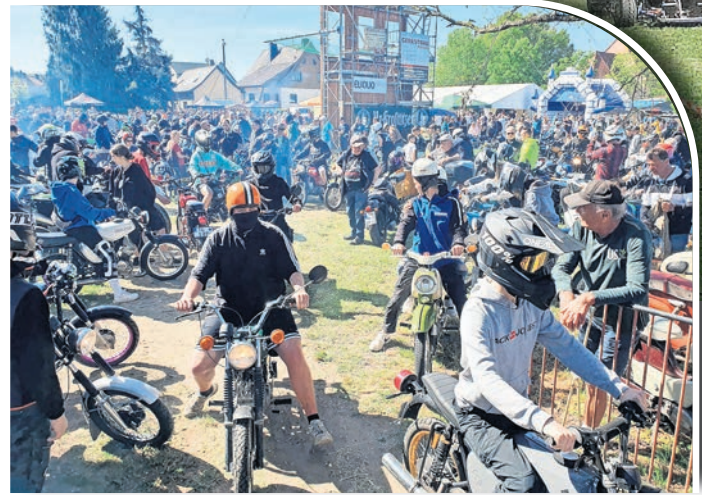
Zu einem Mekka für Zweiradfreunde hat sich das SR- und Simson-Treffen in Taura entwickelt.

SR- und Simsontreffens – Benzingsprache und Fachsimpeln steht neben dem Zeigen des „Schätzchens auf zwei Rädern“ im Vordergrund. Von 11 bis 13 Uhr heizen die Hobbys Musiker zum Frühschoppen richtig ein. Ab 14 Uhr wird es laut und staubig, wenn das K-Wagen-Rennen gestartet wird. Für das leibliche Wohl ist an beiden Tagen gesorgt.