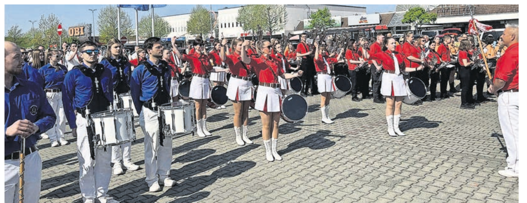
Sechs Fanfaren-, Spielmanns- und Schalmeeinzüge marschieren im PEP Torgau auf.