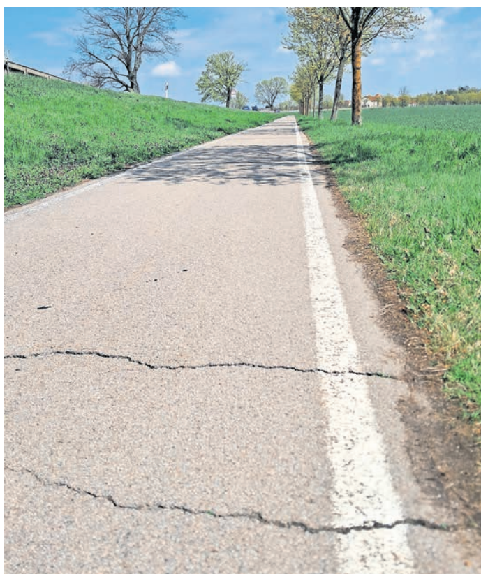
Sollen bald der Vergangenheit angehören: Risse und Unebenheiten auf dem Radweg parallel der B87 zwischen Abzweig Kreischau und Ortseingang Zwethau.

ZWETHAU. Seit dem 20. April bestimmen Bauarbeiten zur Erneuerung des Radwegs an der B87 – westlich von Zwethau das Geschehen. Die Maßnahme umfasst die Instandsetzung der Radwegfahrbahn und der Brücke über den Teichgraben (Ortseingang Zwethau). Dabei werden vorhandene Querrisse geschlossen und die Oberfläche des Radwegs eben wiederhergestellt. Die Arbeiten im Auftrag der Niederlassung Leipzig des Landesamtes für Straßenbau und Verkehr (LaSuV) sollen voraussichtlich bis Mitte Juli 2026 abgeschlossen sein. Während der Bauzeit ist der Radweg vom Abzweig Kreischau bis Ortseingang Zwethau voll gesperrt. Die Radwegmaßnahme beginnt östlich der Kreuzung B87/K8910 am Ortsausgang Kreischau und endet am Ortseingang Zwethau an der Parkstraße. Die Brücke liegt unmittelbar am westlichen Ortseingang von Zwethau und führt dort über den trockenen „Teichgraben“ (Bezeichnung gemäß Bauwerksbuch; nicht ausgeschlossen ist, dass es dazu abweichend ggf. auch einen anderen örtlichen Namen geben könnte). Für Radfahrer wird eine Umleitung eingerichtet, die über die K8910 nach Kreischau, weiter über Gemeindestraßen nach Beilrode und anschließend über die S25 zurück nach Zwethau führt. Die Umleitung gilt in beiden Fahr-