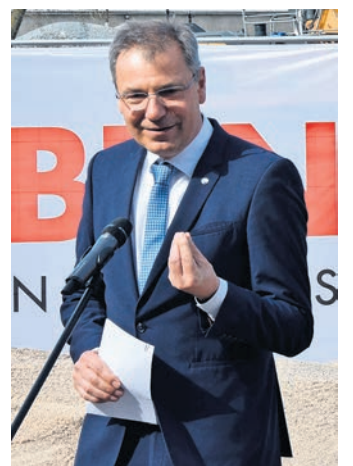
Landrat Kai Emanuel: „Die Investition zeigt, was möglich ist, wenn Menschen an eine Idee glauben und sie gemeinsam vorantreiben.“