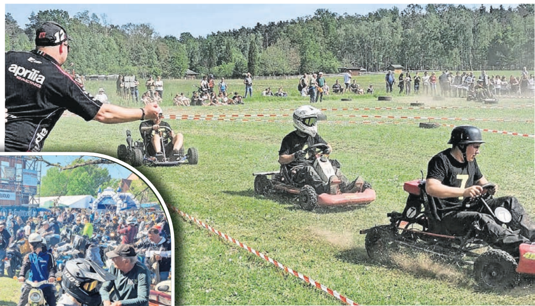
Das K-Wagen-Rennen zieht in Taura ab 14 Uhr am 1. Mai in seinen Bann.

TAURA. Das traditionelle SR- und Simsontreffen in Heidedorf Taura zieht am 30. April und 1. Mai in seinen Bann und Jahr für Jahr Hunderte Zweiradfreunde an. Los geht es am Donnerstagabend, wenn ab 20 Uhr in den Mai getanzt wird. DJ Maik legt tanzbare Mucke auf. Der Freitag steht ab 10 Uhr im Zeichen des