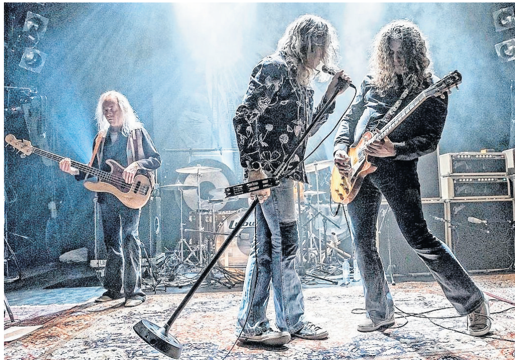
Physical Graffiti spielen die Lieder von Led Zeppelin