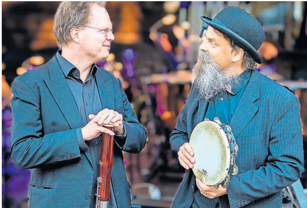
Das Duo Taschenspiel.

TORGAU. Wenn Klassik auf Rhythmus aus aller Welt trifft, entsteht ein Konzert, das garantiert im Kopf bleibt. Am Samstag, 30. Mai, um 19.30 Uhr kommt mit dem Duo Taschenspiel vom Leipziger Symphonieorchester ein außergewöhnliches Musikerlebnis ins Kulturhaus Torgau. Unter dem Titel „Einmal um die ganze Welt – Musik für Fagott und Schlaginstrumente“ erwartet die Gäste eine kreative Mischung aus klassischer Virtuosität, modernen Sounds und spannenden Instrumenten aus verschiedenen Kulturen. Hier trifft das klassische Fagott auf eine ganze Welt voller Rhythmen. Von der arabischen Riq über die südafrikanische Kalimba bis hin zu sphärischen Zimbelen – das Duo Taschenspiel nimmt das Publikum mit auf eine musikalische Reise rund um den Globus. Mal klingt es überraschend modern, mal swingend und manchmal fast wie ein elektronischer Beat – nur eben komplett live gespielt. Techno auf dem Fagott? Ja, das geht.