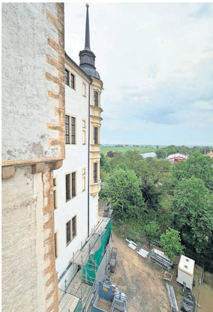
Die ersten Abschnitte der Elbfassade von Schloss Hartenfels strahlen bereits in neuem Glanz.

An der ELBSEITIGEN FASSADE von Schloss Hartenfels Torgau gehts voran