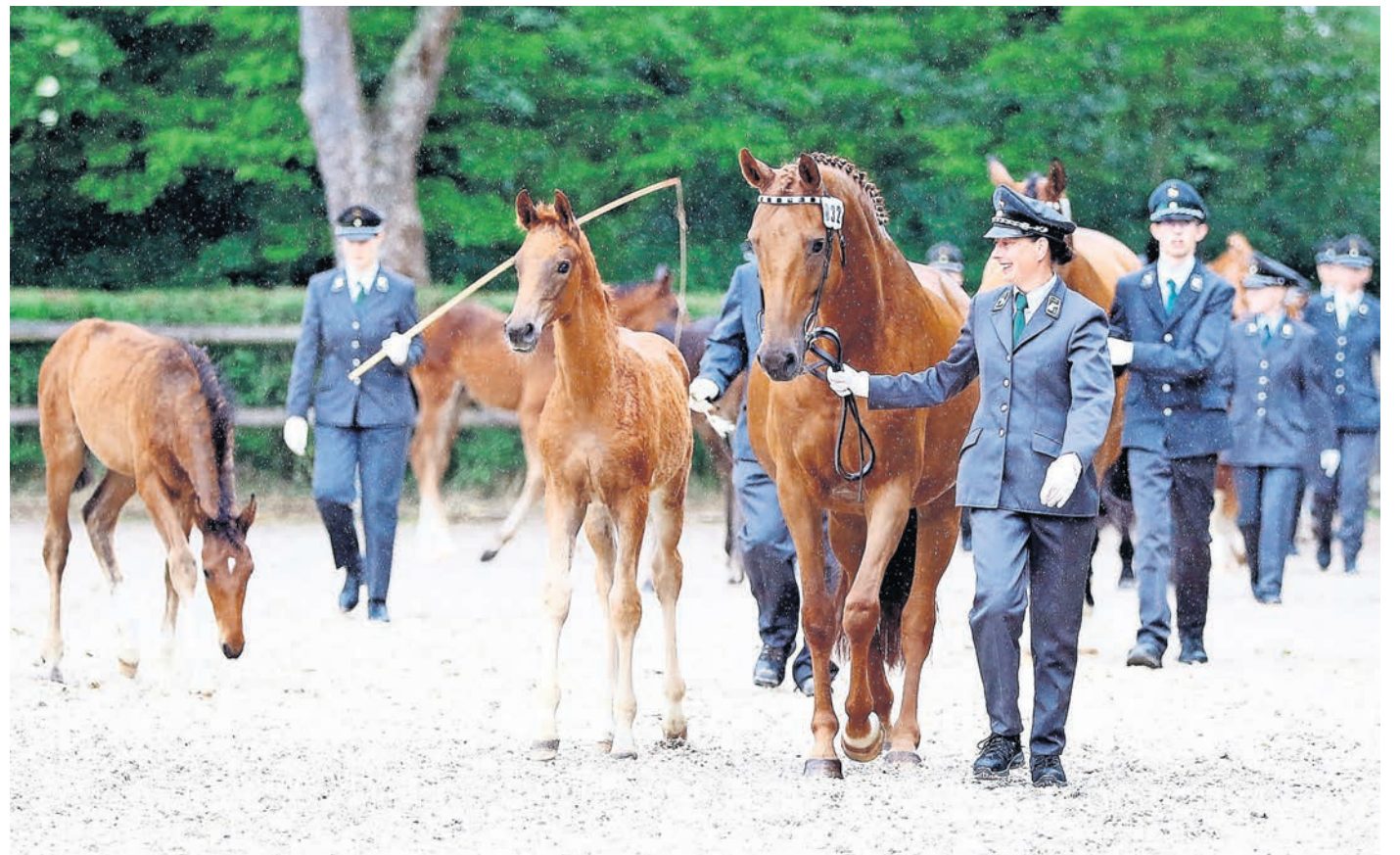
Der Nachwuchs weicht den Stuten nicht von der Seite.

Kartenanzahl empfohlen. Reserviert werden können die Tribünenplätze per E-Mail: sekretariat.hgg@sgv.sachsen.de oder telefonisch unter 03421 70350 während der Bürozeiten (Montag – Freitag von 8 - 15.30 Uhr). Stehplatzkarten zum Preis von zehn Euro gibt es am Veranstaltungstag ab 11 Uhr an den Tageskassen. Stehplätze sind für Kinder bis 12 Jahre kostenfrei.