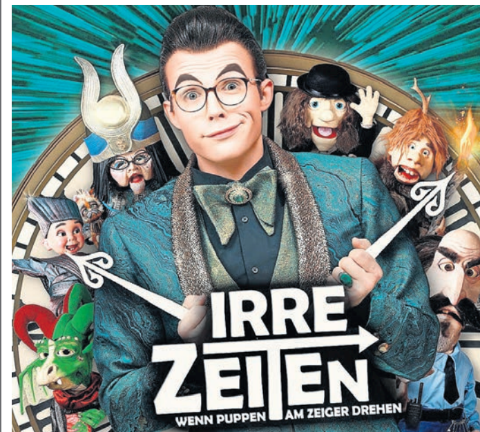
„Wenn Puppen am Zeiger drehen“ heißt die neue Show von Bauchredner Roy Reinker.

ZEITREISE-COMEDY macht im Jahr 2027 sowohl in Oschatz als auch in Torgau Station