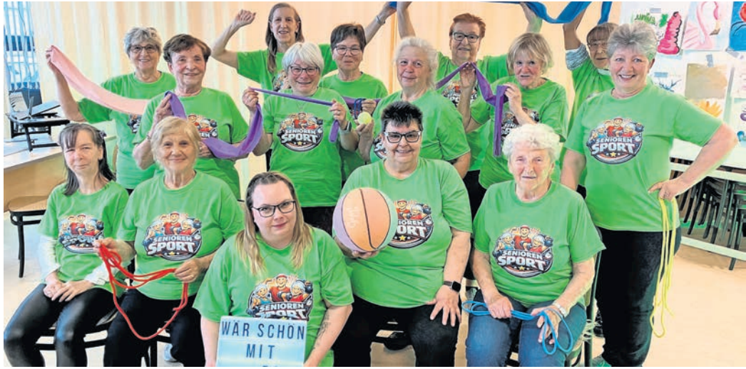
Die Dienstags-Sportgruppe „Fit im Quartier“ feierte unlängst ihren ersten Geburtstag.

Erster Geburtstag der Dienstags-Sportgruppe „FIT IM QUARTIER“ wurde gefeiert