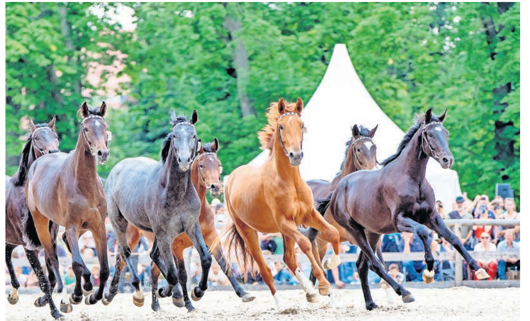
Die traditionelle Gestütsschau findet am Sonntag, 31. Mai, im Hauptgestüt Graditz statt.

☑ Stehplatzkarten zum Preis von zehn Euro gibt es am Veranstaltungstag ab 11 Uhr an den Tageskassen. Stehplätze sind für Kinder bis 12 Jahre kostenfrei.