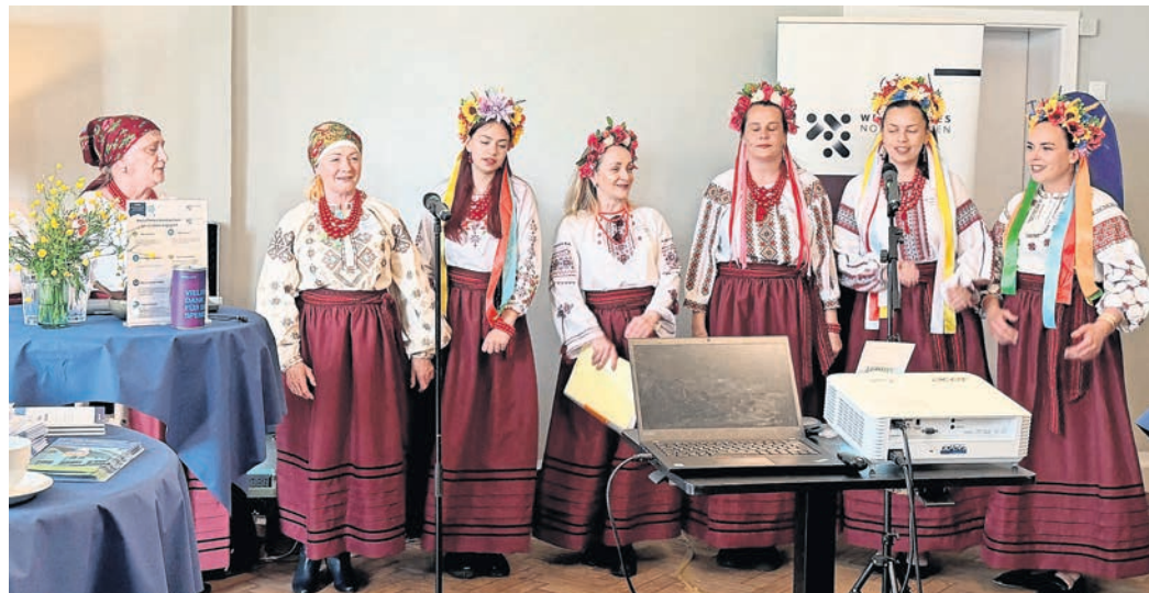
Der Auftritt des Chors „Oberih“ der ukrainischen Community in Torgau bereicherte das Programm.

WELTOFFENES NORDSACHSEN bringt Engagierte aus dem Landkreis zusammen