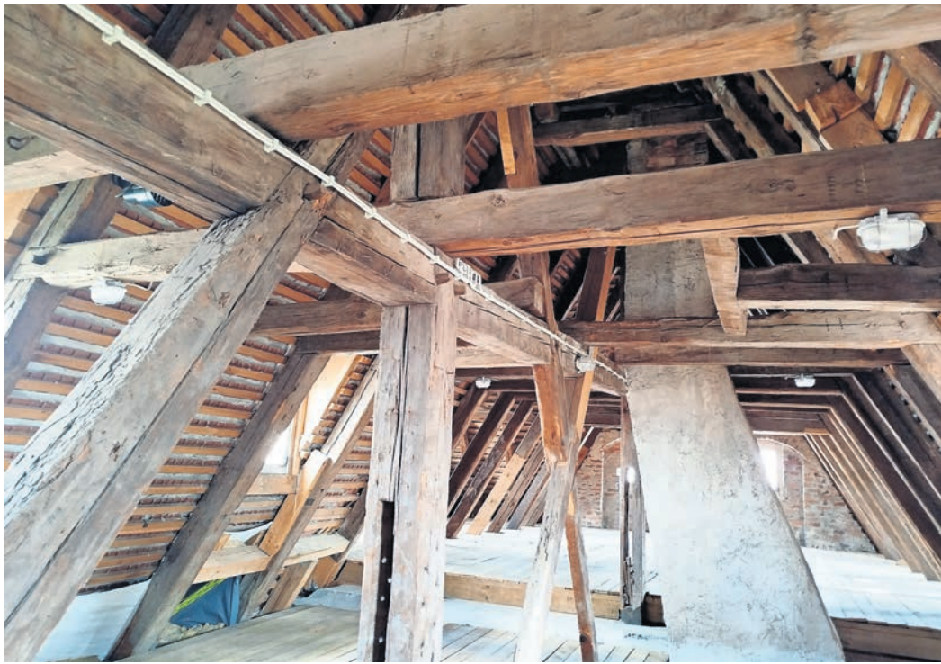
Auf dem alten Dachboden des Stadt- und Kulturgeschichtlichen Museums erklingen plötzlich von irgendwo her Melodien – gespielt von Ina Bär auf dem Cello.

SAGENHAFTES UND MYSTISCHES im Stadtmuseum Torgau