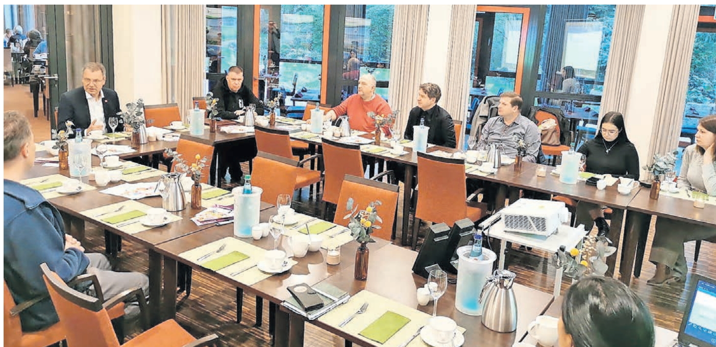
Das Wirtschaftsführerstück des Landrats in Bad Dübener führt Unternehmen unterschiedlicher Branchen zusammen.