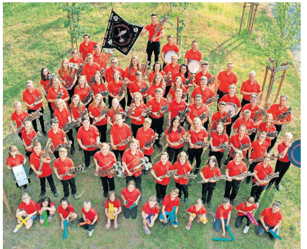
Seit 65 Jahren gibt es in Langenreichenbach die Schalmeienmusikanten. Das muss gefeiert werden!