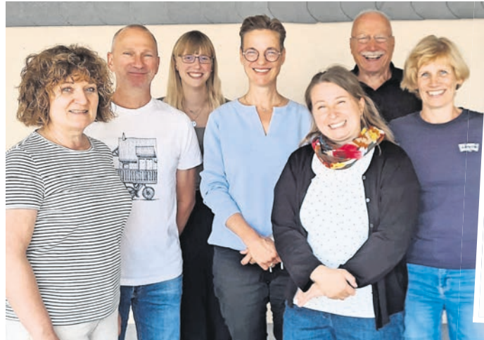
Gut lachen haben die Mitarbeiterinnen und Mitarbeiter des TIC - sie wurden erneut vom Deutschen Tourismusverband zertifiziert.

I-MARKE des Deutschen Tourismusverbandes für das TIC