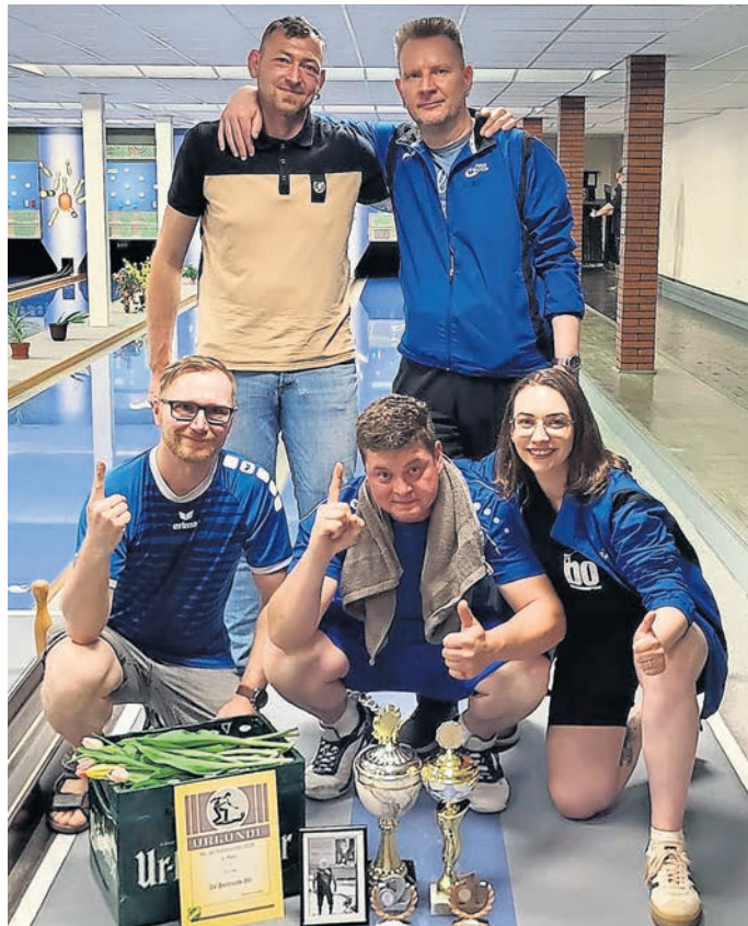
So sehen Sieger aus! Beim traditionellen Zehn-Städte-Turnier in Stauchitz sicherten sich die Beilroder Kegler in diesem Jahr den Gesamtsieg.