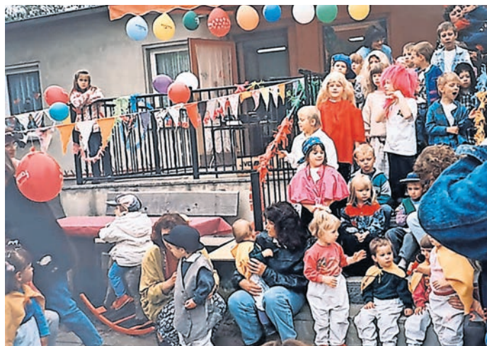
Erinnerungen an die Vergangenheit der Kita „Elbhasen“ in Mehderitzsch: Die erste Krippengruppe 1986, ein Artikel zum zehnjährigen Bestehen und ein Foto von den Feierlichkeiten zum 10-jährigen Jubiläum.

einem Schreiben der Gemeinde Mehderitzsch von 1986. „Schon lange hegten die Mehderitzscher Bürger den Wunsch eine Kinderkrippe zu schaffen. Immer wieder waren es junge Muttis, die das Problem aufwarfen.“ Nachdem ein geeignetes Gemeindegrundstück gefunden und die finanziellen Mittel über die regionalen Betriebe nach dem Prinzip „der territorialen Rationalisierung“ und über den Rat des Kreises Torgau eingeholt worden waren, wurde der erste Mauerstein am 3. März 1985 gesetzt. „Durch den Fleiß der Feierabendbrigade [...] und der Hilfe durch den unermüdlichen Einsatz der Bürger der Gemeinde wuchs der Bau heran.“ Zwei Monate vor Zeitplan war das Gebäude fertiggestellt. Am 16. April konnten die ersten neun Krippenkinder zusammen mit vier Erzieherinnen, einer Küchenfrau und einer Reinigungskraft in die Räumlichkeiten, die für 24 Kinder ausgelegt waren einziehen. Die öffentliche Einweihung fand am 21. April 1986 statt. Bis 1991 stand die Einrichtung ausschließlich für Krippenkinder offen. Mit der Übernahme der Trägerschaft durch den ASB kam dann auch die erste Kindergartengruppe.