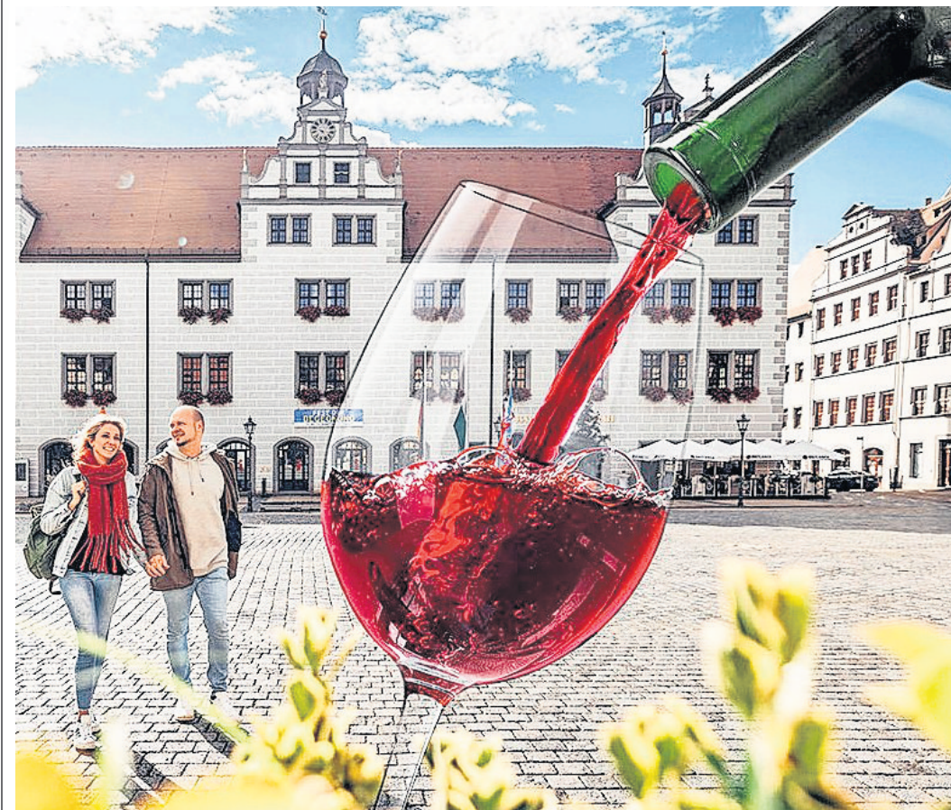
Ob Stadtführung oder kulinarische Erlebnistour in Torgau – die Gäste können sich auf Spannung und Abwechslung freuen.

Auch im Monat Juni ist VIELFÄLTIGKEIT TRUMPF