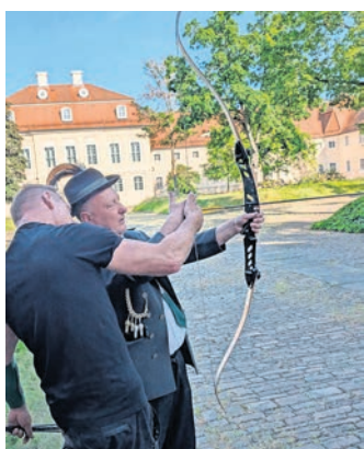
Der Schützenverein Malkwitz eröffnete die Wermsdorfer Schlössernacht und probierte sich im Bogenschießen.

WERMSDORF. Am 30. Mai eröffnete der Schützenverein Malkwitz e.V. die Schlössernacht in Wermsdorf mit Salutschüssen aus der Kanone. Nach dem Schießen flanierten die Schützen zur Hubertusburg und probierten sich im Bogenschießen. Die Schlössernacht ist willkommene Gelegenheit, das Schloss Hubertusburg bei Vorträgen, Führungen und Ausstellungen kennenzulernen. drumherum gibt es ein familientaugliches Programm mit vielen Mitmach- und Kreativangeboten.