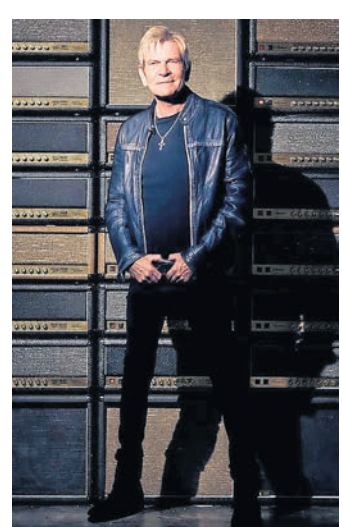
Matthias Reim

35 Jahre nach seinem Durchbruch feiert er das Jubiläum eines Songs, der Generationen verbindet und jede Halle zum Beben bringt. Zum ersten Mal überhaupt präsentiert er sein Kultalbum „REIM“ komplett live – von der ersten bis zur letzten Note. Dazu kommen seine größ-