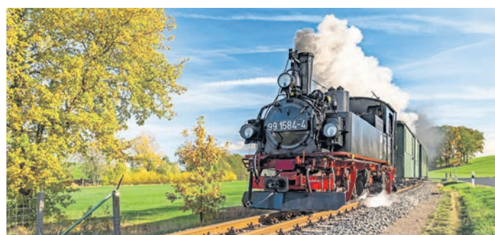
Die Döllnitzbahn ist im Sommer wieder unter Dampf.

Ergänzt wird das sommerliche Programm in der Region rund um Mügeln durch Familienangebote und Aktivitäten wie ein Quad-Training auf der Motocross-Strecke Kemmlitz am 28. Juni. SWB