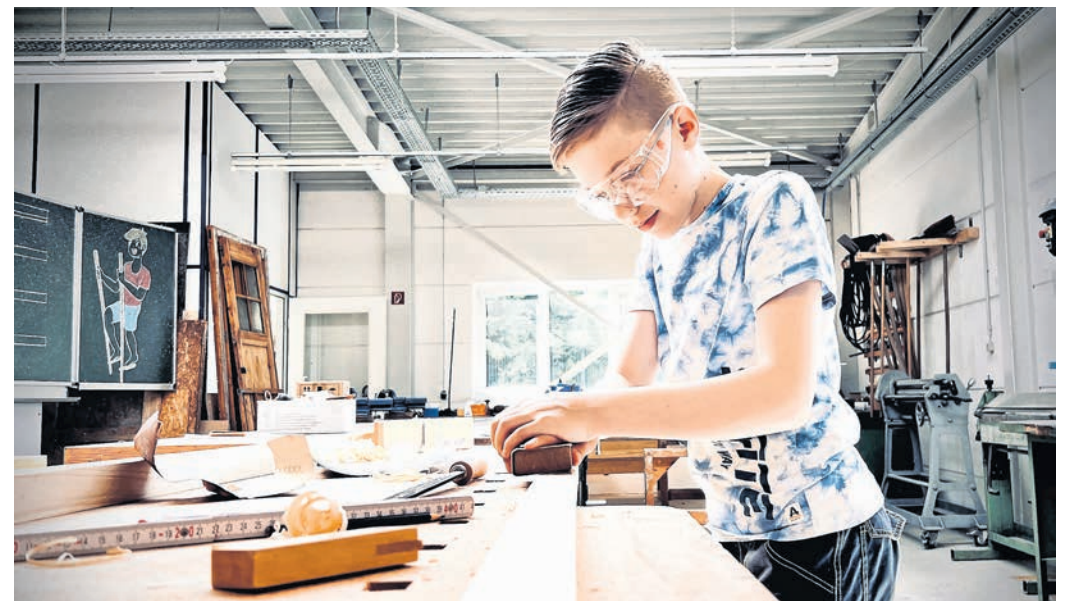
Am 28. Juli starten die Sommerferien-Berufetage in der Offenen Werkstatt Riesa, für die man sich bereits jetzt anmelden sollte.

☑ Eine Anmeldung zum Sommerferienprogramm ist unbedingt notwendig, da die Plätze für alle Angebote begrenzt sind. Interessierte finden das Anmeldeformular unter: www.inno-handwerk.de/offene-werkstatt