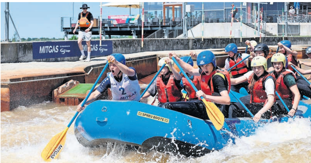
Das Team der „Mulde Piraten“ aus dem Magnus-Gottfried-Lichtwer-Gymnasium Wurzen steht im Finale des 17. Mitgas-Schüler-Raftings.

➔ Mehr Informationen zum Mitgas-Schüler-Rafting sowie die Start- und Ergebnislisten stehen auf der Website des Kanuparks: www.kanupark-markkleeberg.com/msr2026