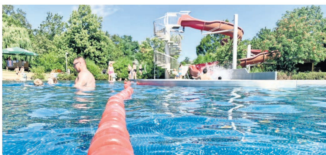
Ab ins kühle Nass: Die Qualität des Wasser stimmt im Platsch Oschatz.

Neben der hygienischen Reinheit überzeugen die Anlagen durch ihre vielfältigen Freizeitangebote. Die Sichttiefen zum